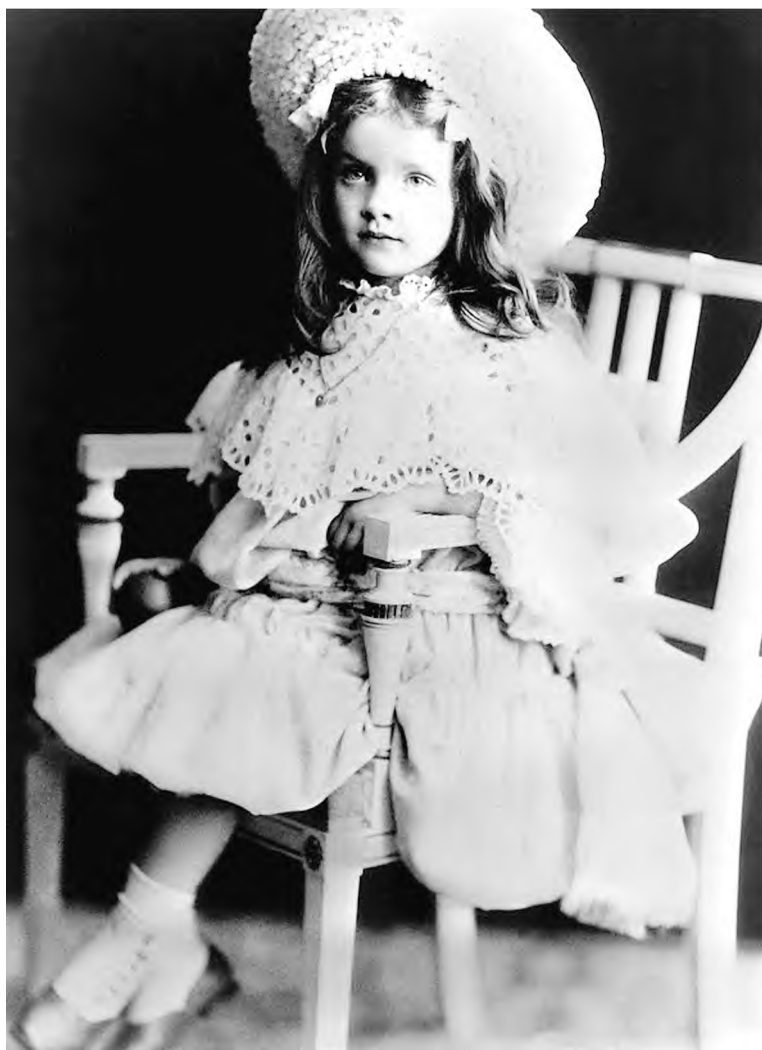
Марлен Дитрих в детстве. Берлин. 1900-е гг.