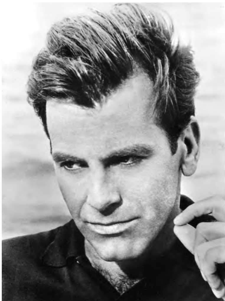
Максимилиан Шелл (1930–2014) – австрийский актер, продюсер и режиссер. Обладатель премий «Оскар» и «Золотой глобус» за главную роль в фильме «Нюрнбергский процесс» (1961)