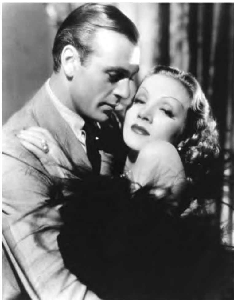
Марлен Дитрих и Эрих Мария Ремарк.

«...я твой ангел с черным мечом, и я тебя охраняю». (Из письма Эриха Марии Ремарка Марлен Дитрих)