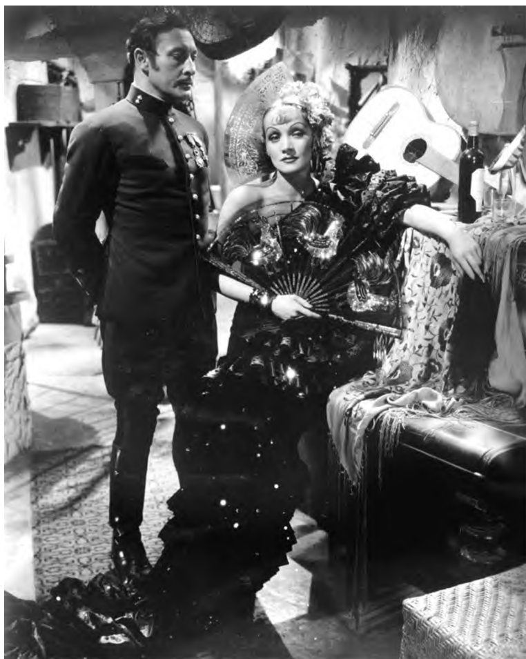
Кадр из кинофильма «Дьявол – это женщина». 1935 г.