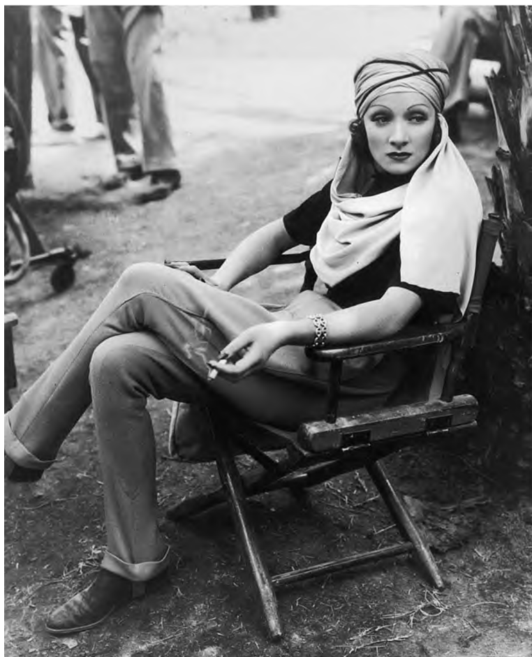
Марлен Дитрих на съемках фильма «Сад Аллаха». 1936 г.