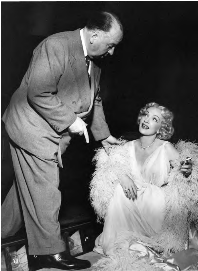
Альфред Хичкок и Марлен Дитрих на съемках фильма «Страх сцены», 1950 г.

«Я совершенно определенно знаю: для решения различных проблем ясное мнение мужчины – лучшее средство привести в порядок свою собственную запутанную голову. Я всегда любила, когда мной руководили. И нет ничего лучше, когда знаешь чего от тебя хотят, будь то в жизни, работе или любви». (Альфред Хичкок)