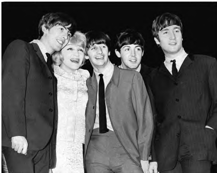
Марлен Дитрих с музыкантами группы «Битлз». 1963 г.