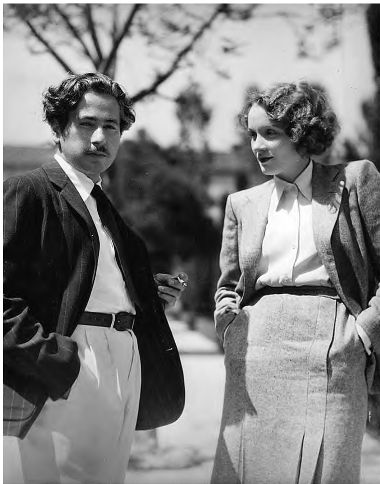
Джозеф фон Штернберг и Марлен Дитрих. 1932 г.

«В любви невозможно отличить победу от капитуляции». (Марлен Дитрих)