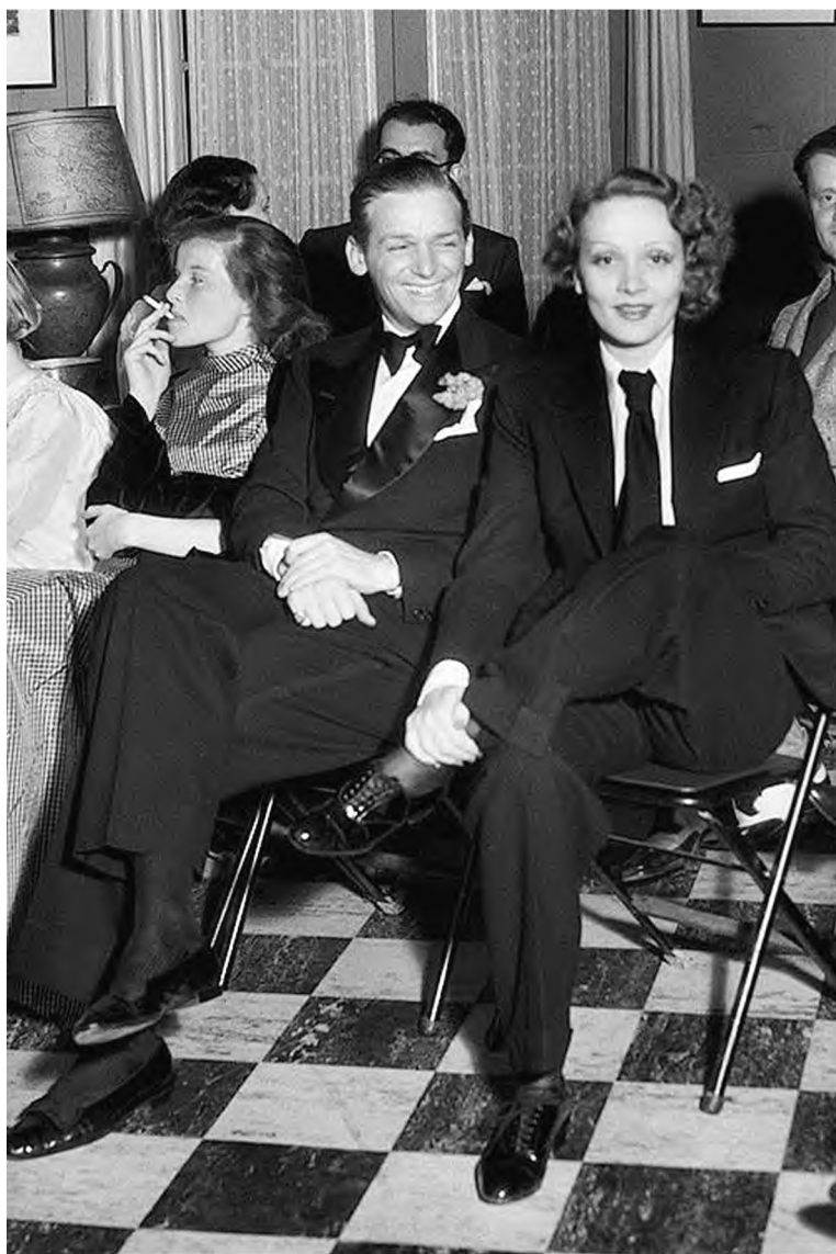
Кэтрин Хепберн, Дуглас Фербенкс-младший и Марлен Дитрих на закрытом показе. 1933 г.