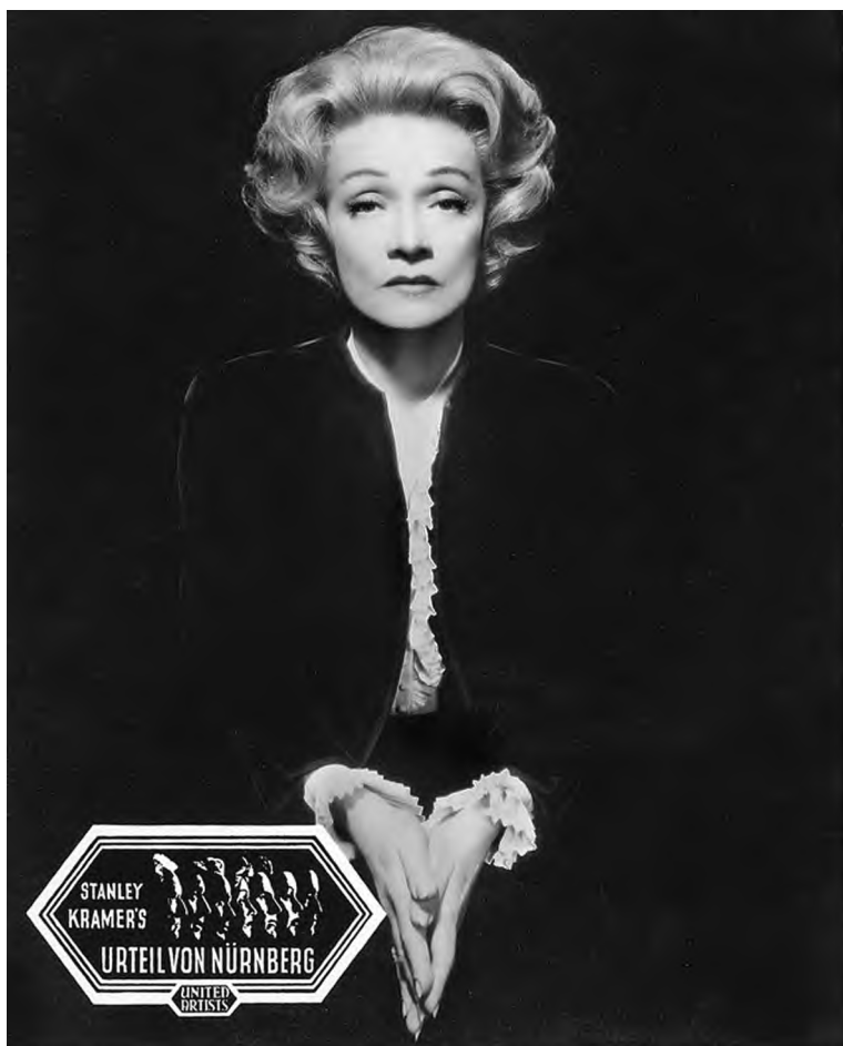
Марлен Дитрих на промо-фото к фильму Стенли Крамера «Нюрнбергский процесс»