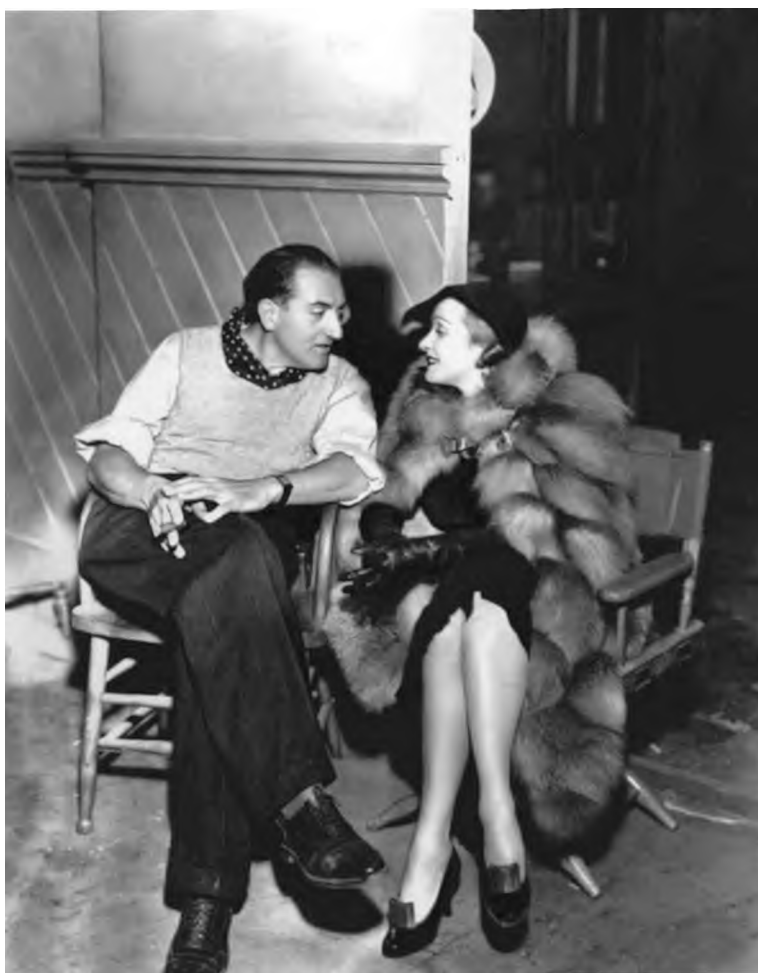
Марлен Дитрих и кинорежиссер Фриц Ланг.

«Если ты возвращаешься в девять вечера вместо семи, и он еще не позвонил в полицию, – значит, любовь уже кончилась». (Марлен Дитрих)