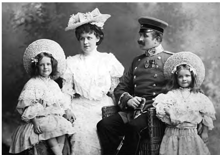
Элизабет и Марлен Дитрих с родителями. Берлин. 1906 г.