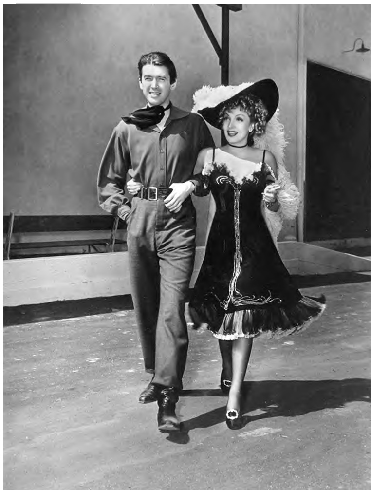
Джеймс Стюарт и Марлен Дитрих на съемках «Дестри снова в седле». 1939 г.