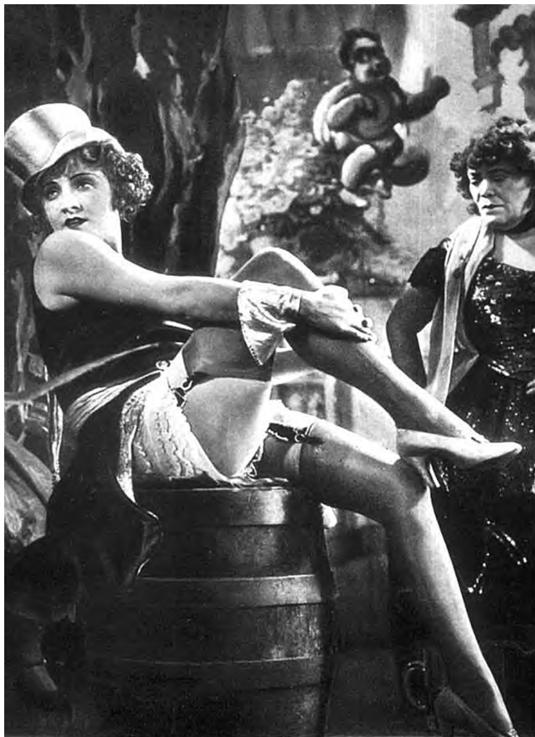
Кадр из кинофильма «Голубой ангел». 1930 г.