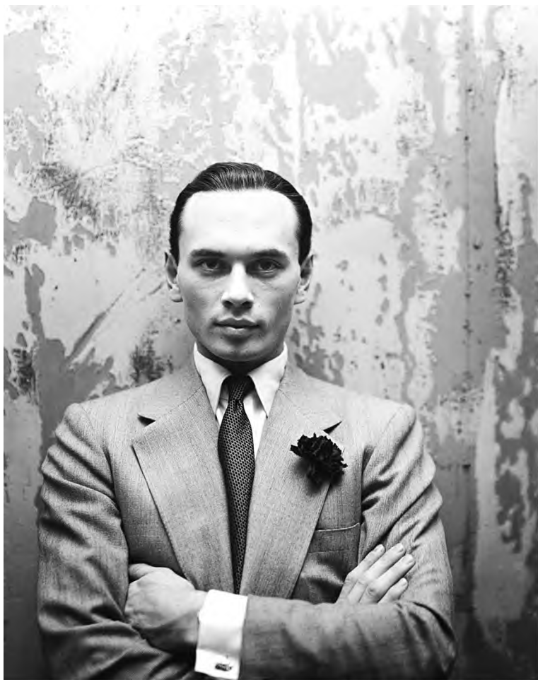
Юл Бриннер (1920–1985) – американский актер театра и кино русского происхождения