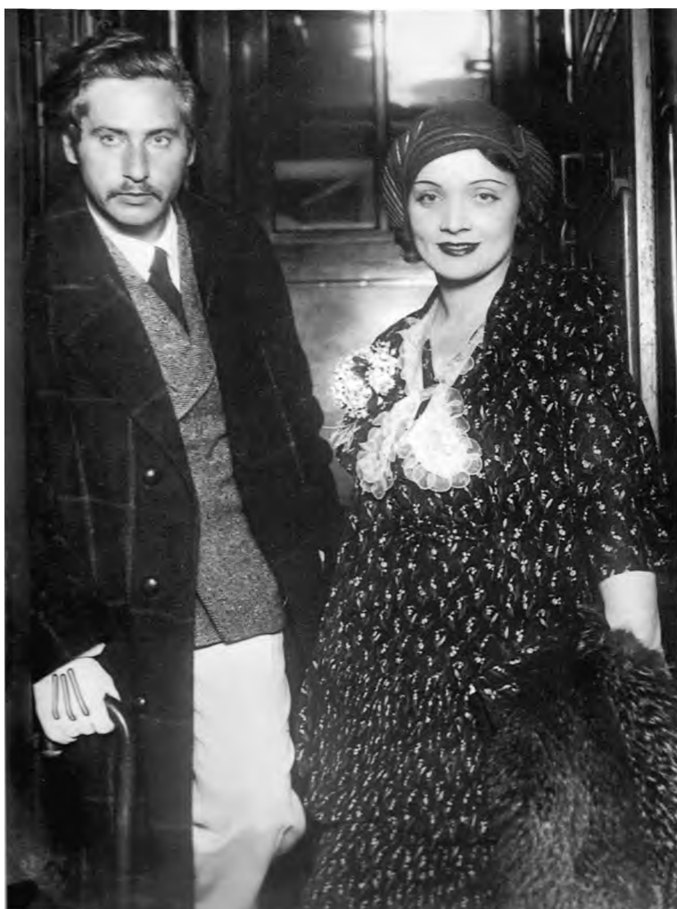
Кинорежиссер Джозеф фон Штернберг и Марлен Дитрих. Берлин. 1930 г.

«Женщины, бесспорно, умнее мужчин. Вряд ли найдется женщина, которая была бы без ума от мужчины только из-за его красивых ног». (Марлен Дитрих)