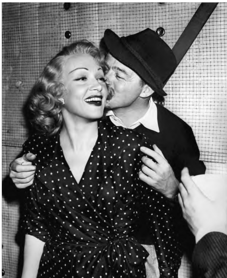
Билли Уайлдер и Марлен Дитрих на съемках фильма «Зарубежный роман». 1948 г.