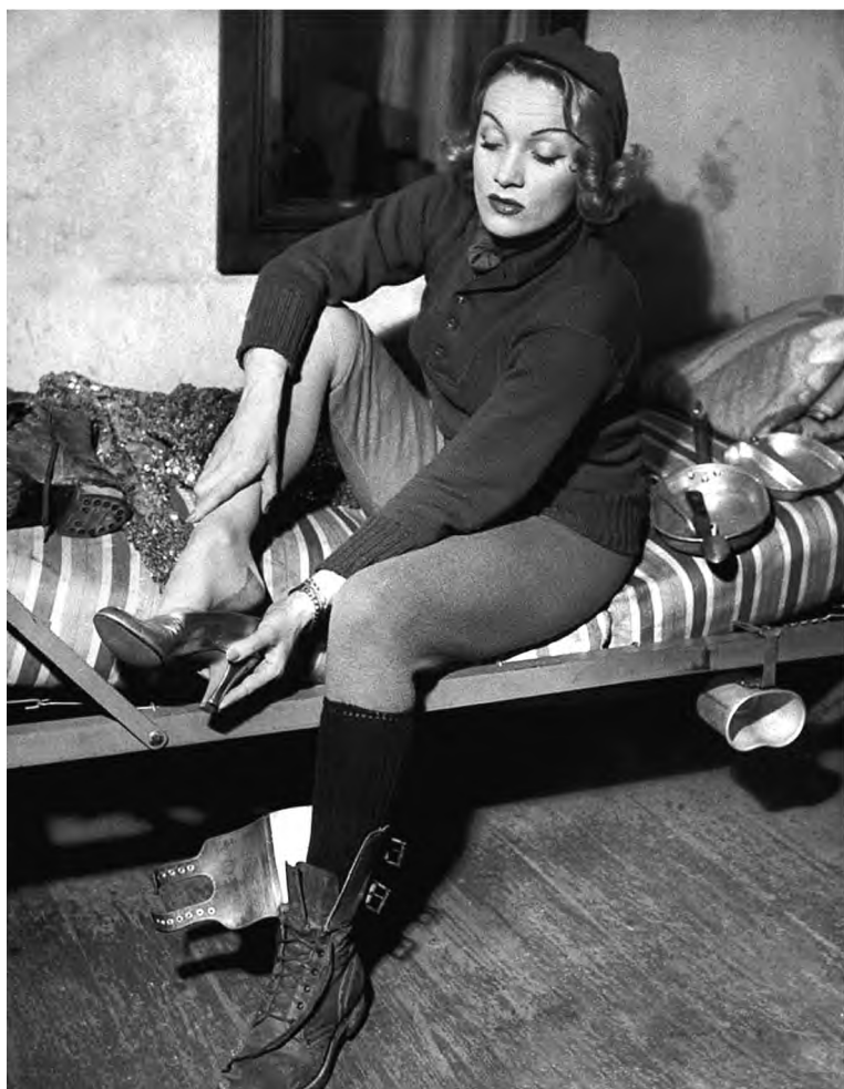
Марлен Дитрих готовится к выступлению перед солдатами. Бельгия. 1944 г.

«Курить я начала во время войны. Это и сохранило мое здоровье». (Марлен Дитрих)