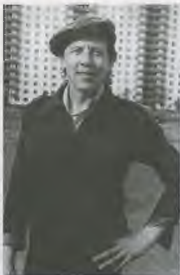
Кооперативный дом. Новая семья, новое жилье, 1980