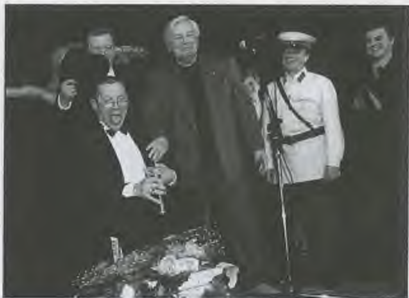
60-летие В. Золотухина. На сцене театра на Таганке, 2001