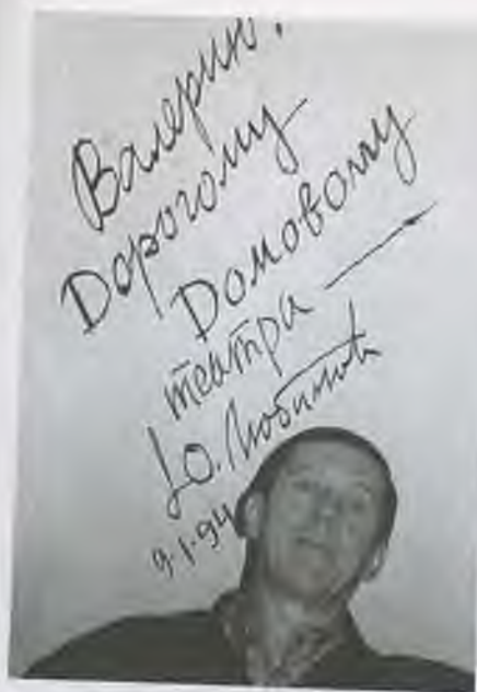
Автограф Ю. Любимова 2001