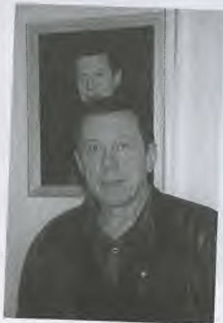
Портрет и оригинал, 2000