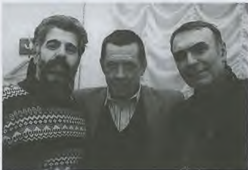
В. Краснопольский — составитель, В. Золотухин — автор, Ф. Медведев — критик, 2001