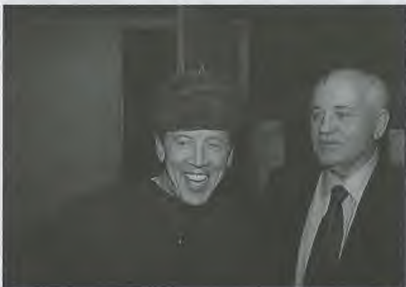
М. Горбачев на спектакле «Шарашка», 2000