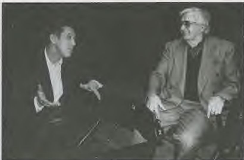
С Ю. Любимовым на Таганке перед премьерой «Живаго», 1993