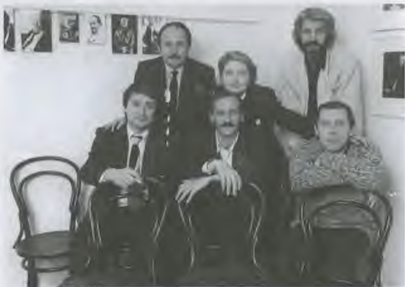
Н. Губенко, Ж. Болотова, Б. Хмельницкий, В. Смехов, Л. Филатов, В. Золотухин. Н. Губенко назначен главным режиссером театра на Таганке, 1988