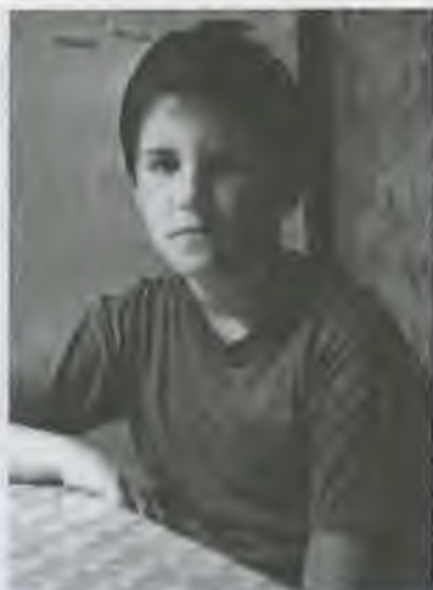
Сергея Золотухин, 1988