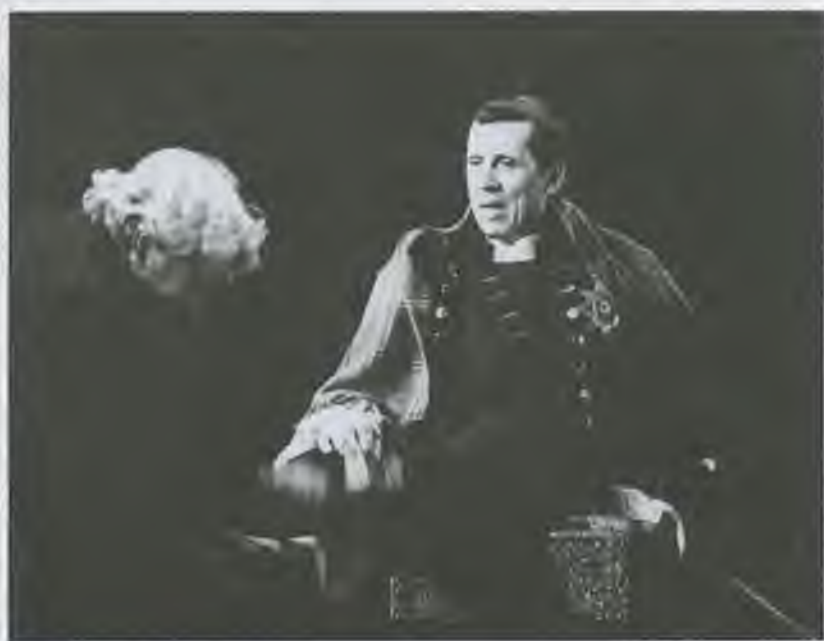
«Павел I». Постановка Л. Хейфеца, 1994