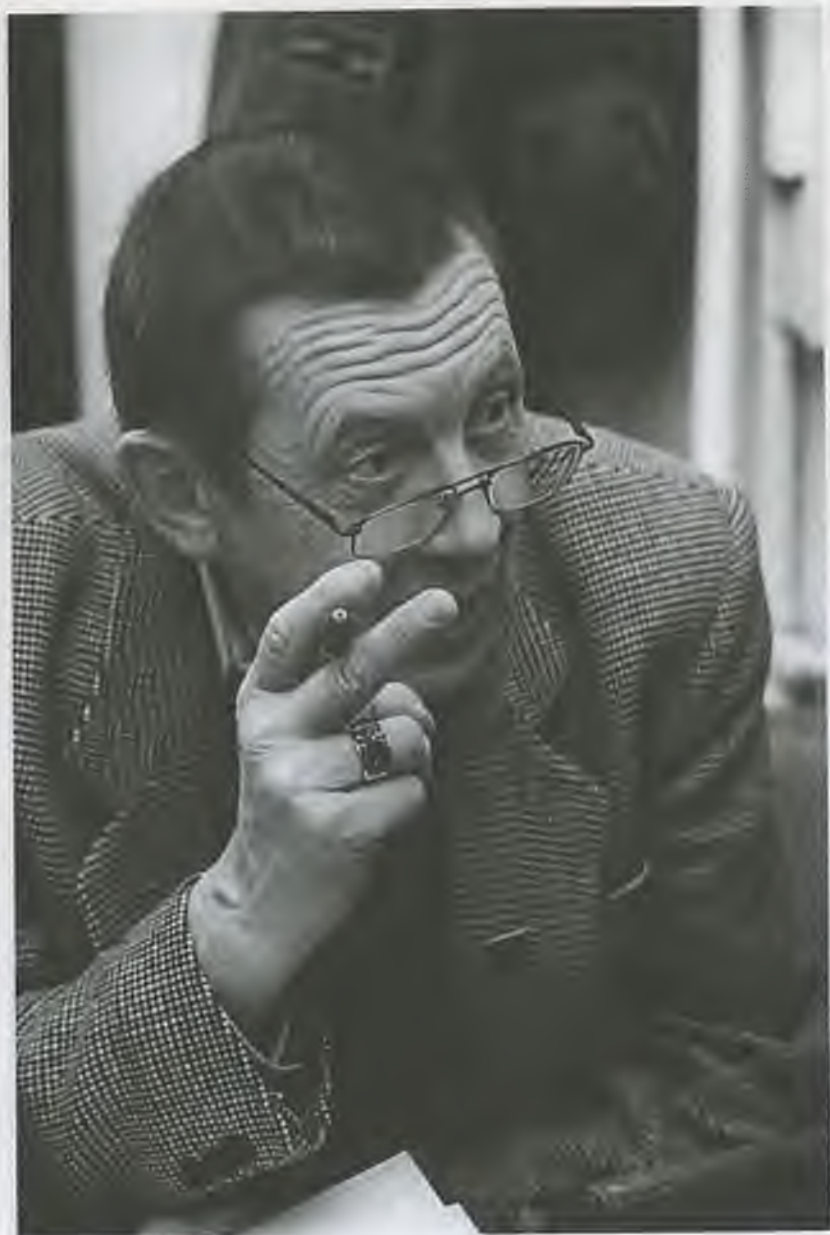
Интервью с Ф. Медведевым, 2001