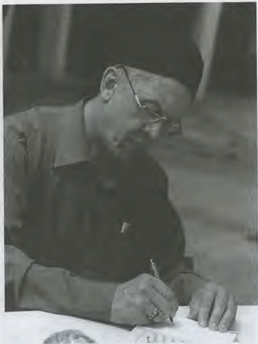
«Утром пишу, днем издаю, вечером продаю», 2001