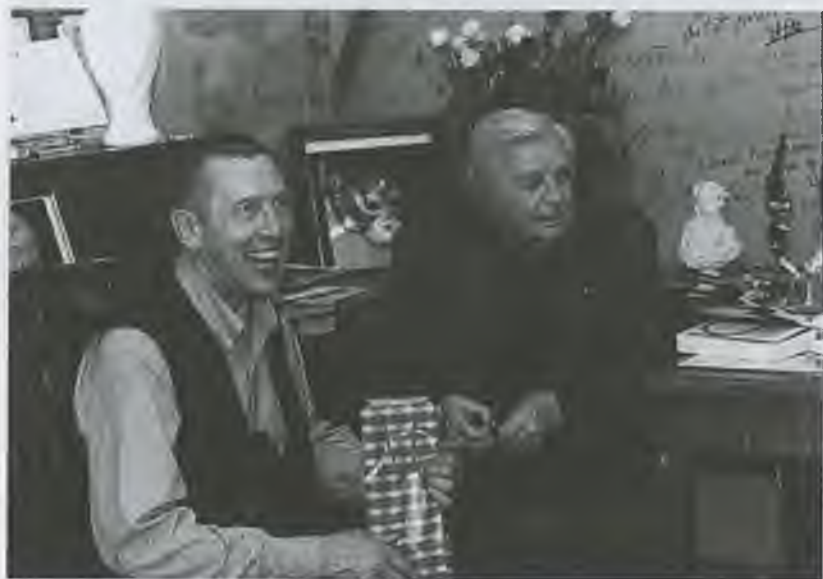
60-летие В. Золотухина. В кабинете Ю. Любимова, 2001