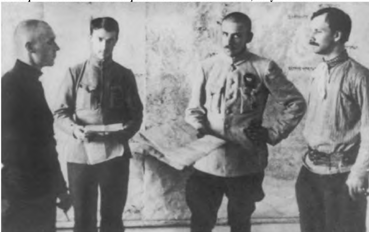
Анализ боевой обстановки. В. К. Блюхер (второй справа) с работниками своего штаба. Кунгур, 1919 г.