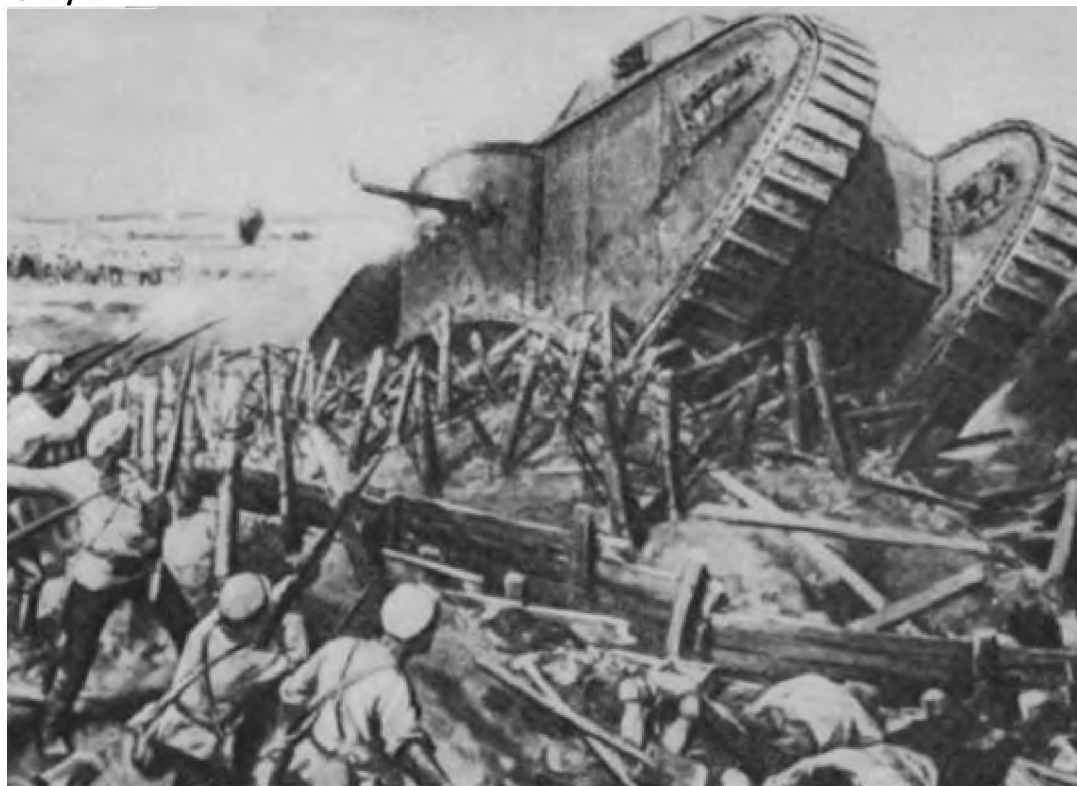
Белогвардейский танк «Рено» на Каховском плацдарме. 1920 г.