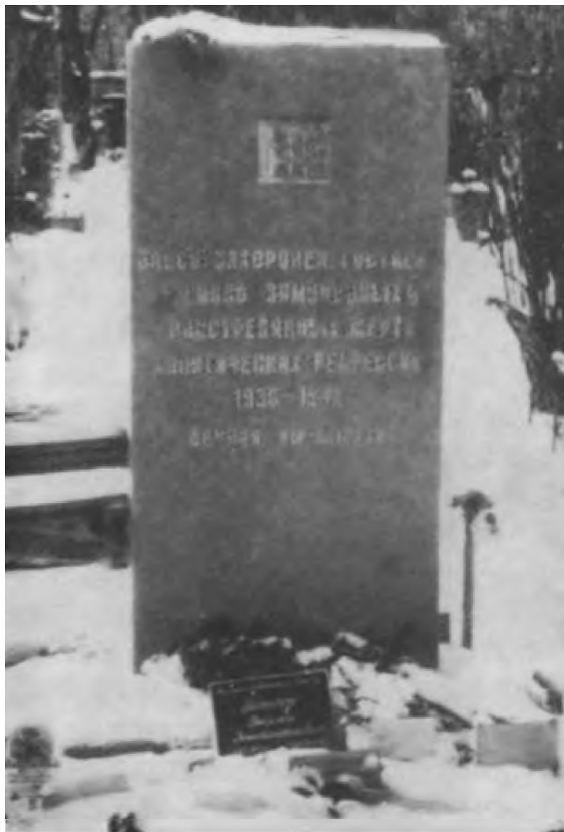
Камень на Донском кладбище, где похоронены жертвы репрессий 1930–1942 годов. Здесь погребен и прах В. К. Блюхера