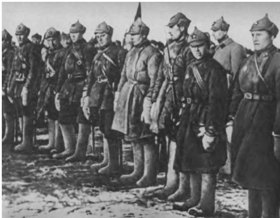
Воины ОДВА, отличившиеся в боях на КВЖД