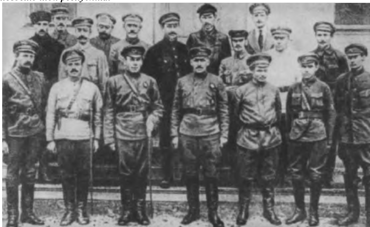
В. К. Блюхер (в первом ряду в центре) с членами Реввоенсовета Народно-революционной армии и работниками штаба Амурской дивизии. 1921 г.