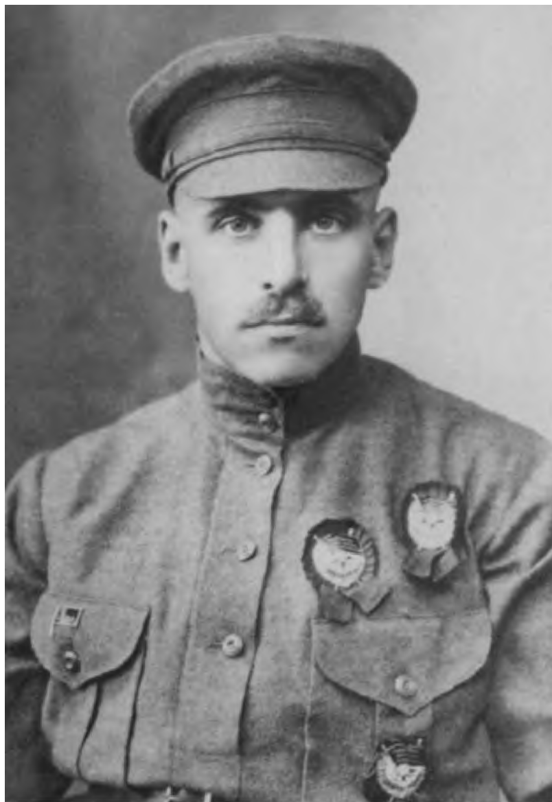
Командир 1-го стрелкового корпуса В. К. Блюхер. Петроград, 1922 г.