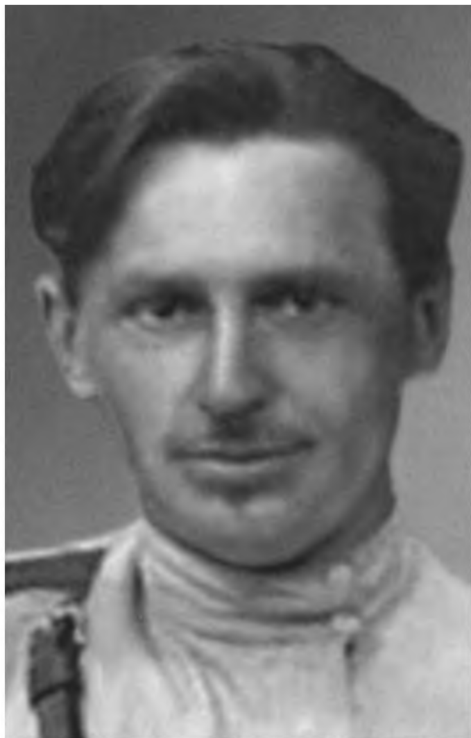
С. М. Серышев, командующий войсками Восточного фронта