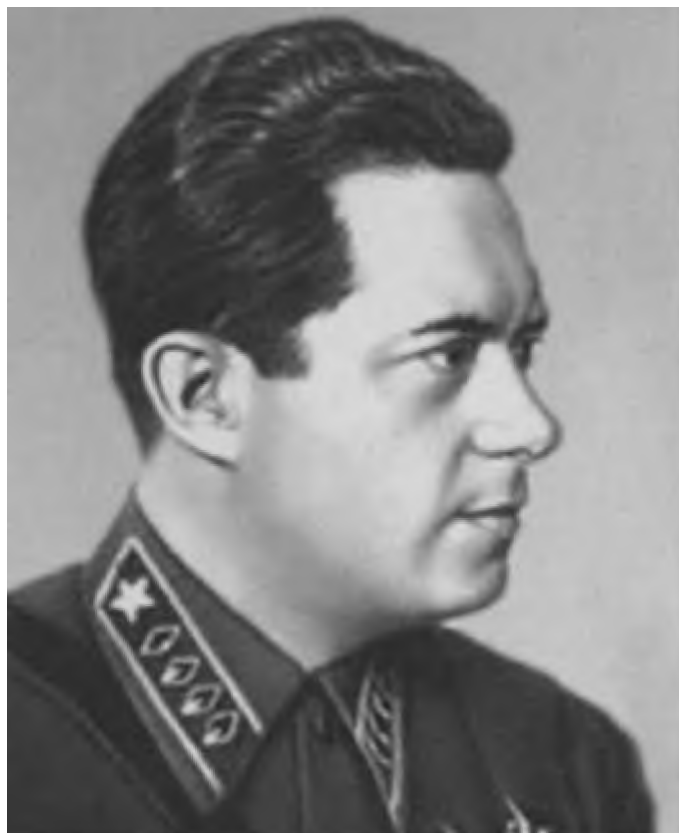
И. Э. Якир, командующий Украинским военным округом