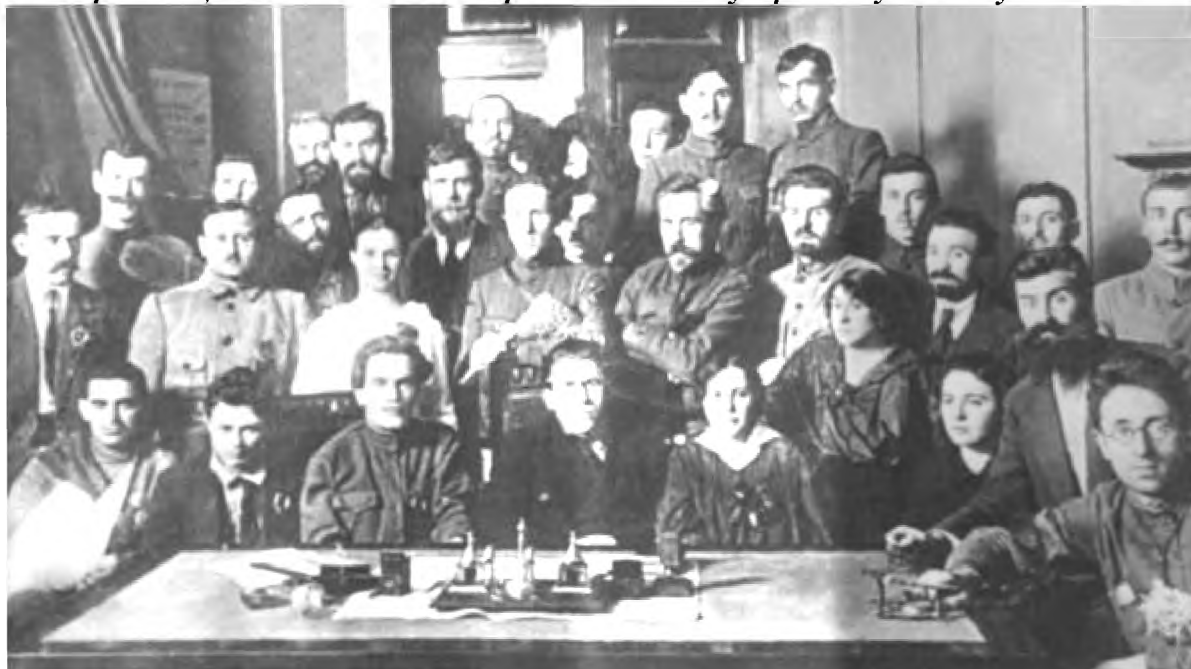
Большевистский актив Самары. В первом ряду третий слева — В. В. Куйбышев. 1917 г.

Советов рабочих и солдатских депутатов, полковых, ротных и заводских комитетов, представителей «комитетов народной власти» и уездных крестьянских организаций, принявшее резолюцию большевиков о передаче власти губернскому Совдепу