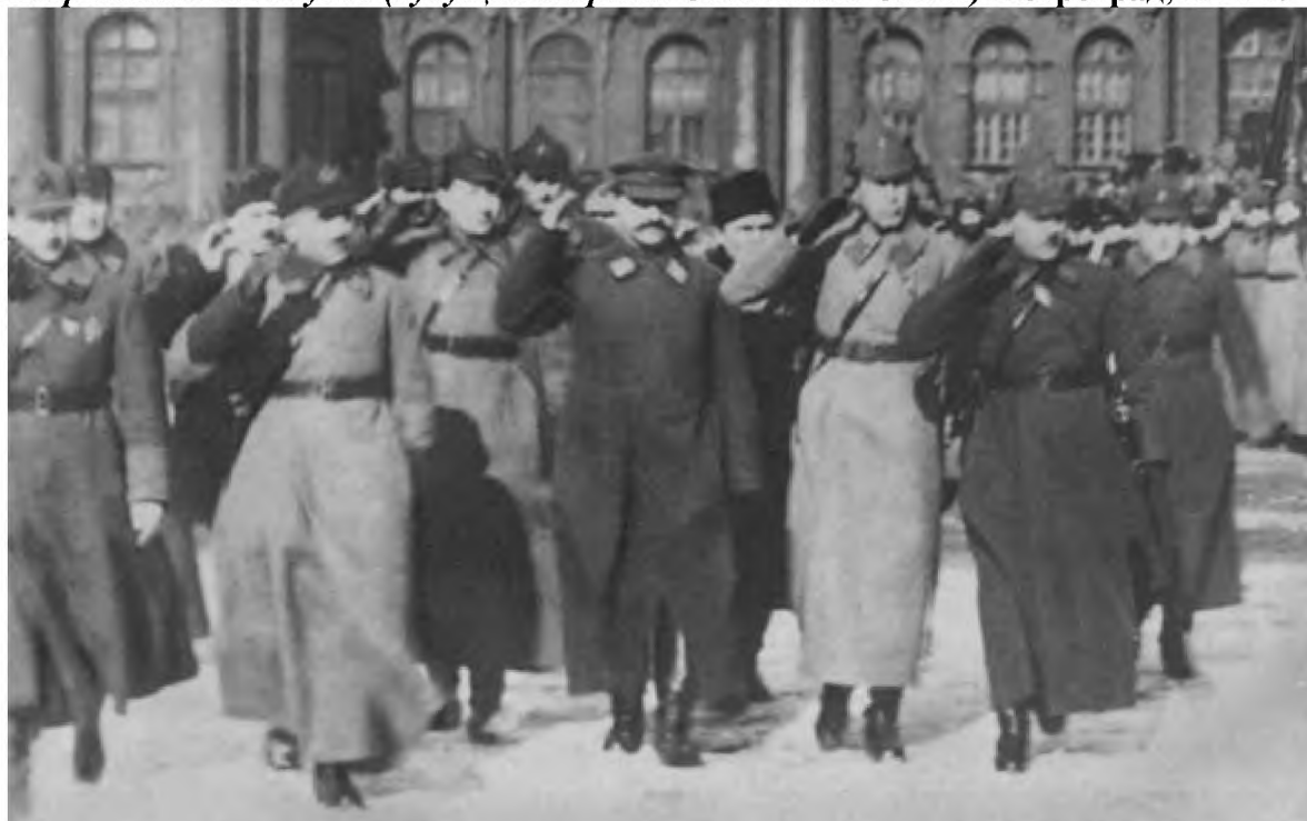
На переднем плане слева направо: В. К. Блюхер, Г. К. Орджоникидзе, Б. М. Шапошников, К. Е. Ворошилов обходят строй войск 1-го стрелкового корпуса. Петроград, 1923 г.