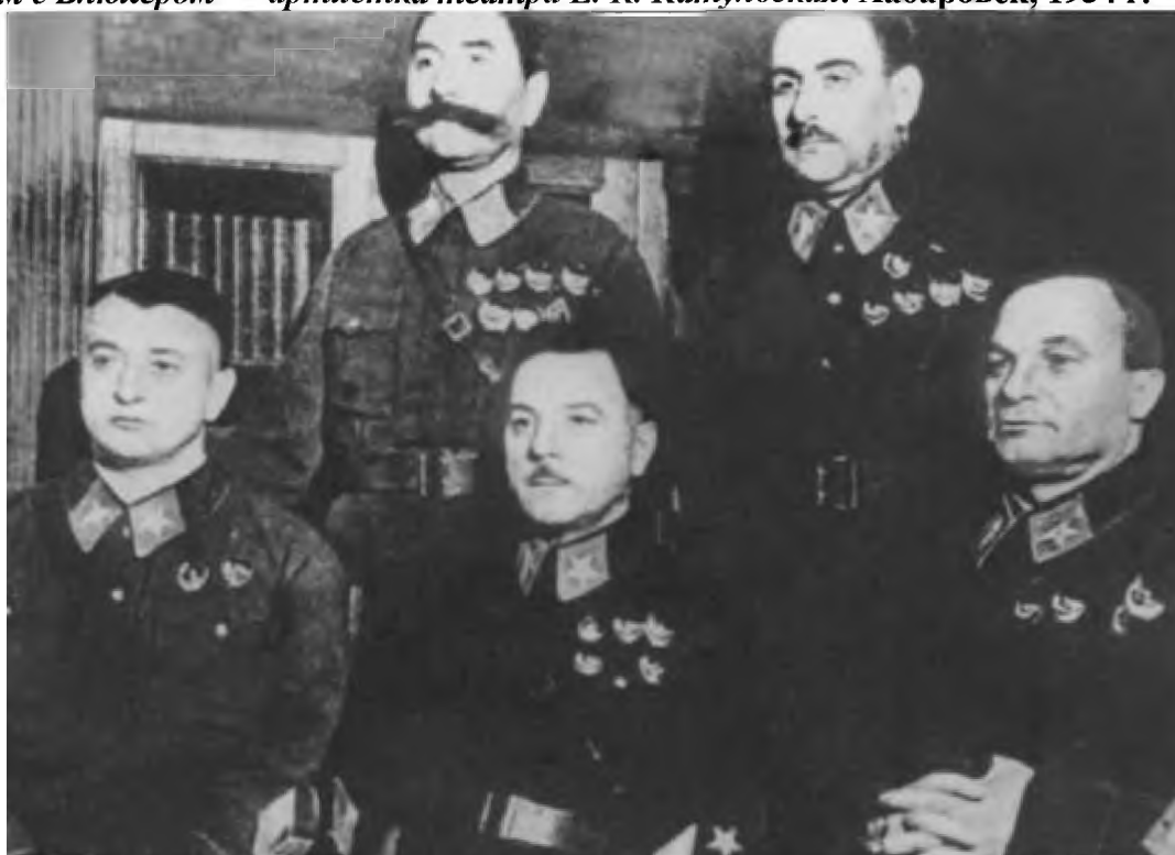
Первые Маршалы Советского Союза. Сидят: М. Н. Тухачевский, К. Е. Ворошилов, А. И. Егоров; стоят: С. М. Буденный, В. К. Блюхер