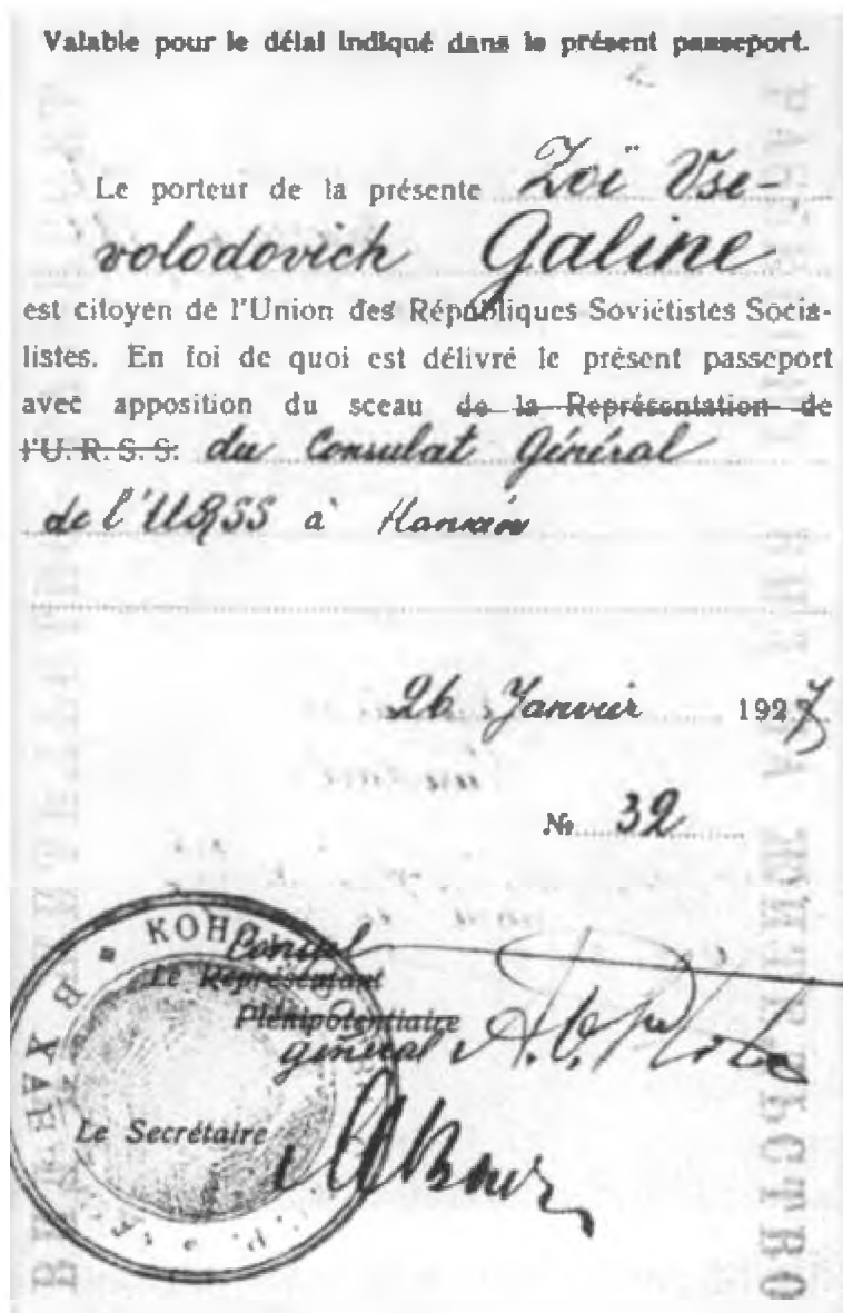
Вид на жительство в Китае, выданный Зою Всеволодовичу Галину (В. К. Блюхеру). Китай, Ханькоу, январь 1927 г.