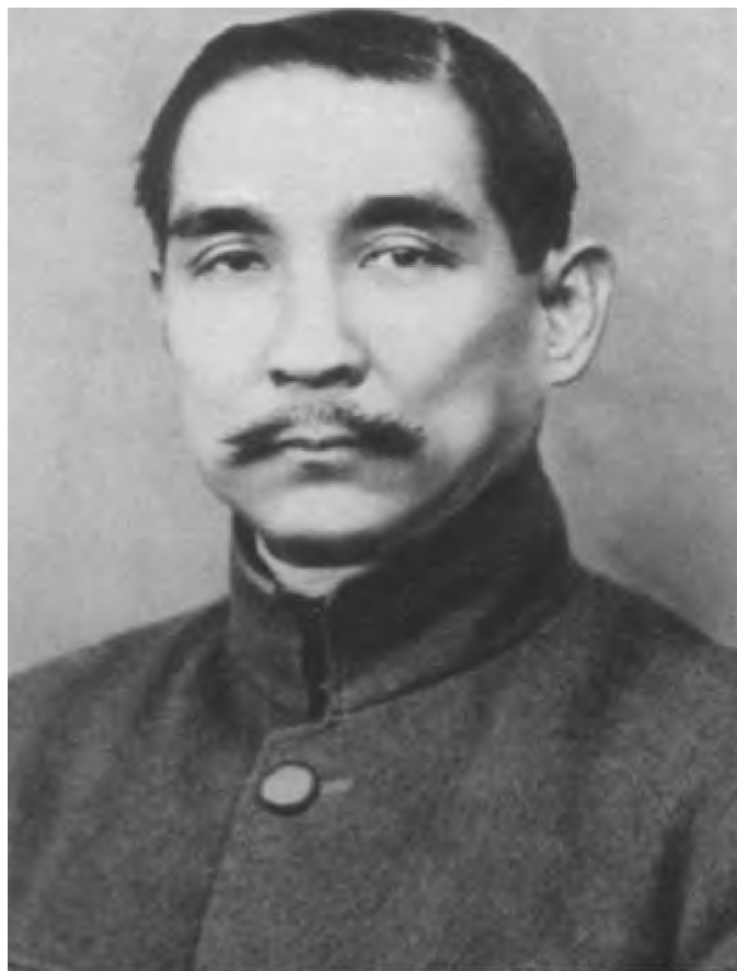
Сунь Ятсен — председатель партии гоминьдан, президент Китая в 1921–1925 годах