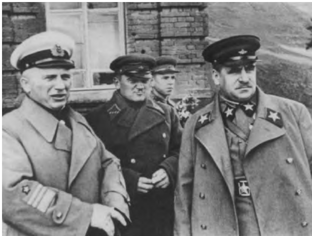
Слева направо: флагман 1-го ранга Г. П. Киреев, командарм 1-го ранга М. К. Левандовский и Маршал Советского Союза В. К. Блюхер