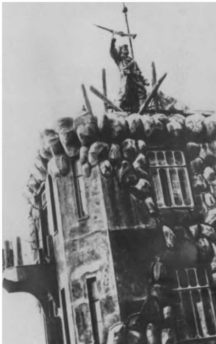
Памятник погибшим народоармейцам на вершине сопки Июнь-Карань