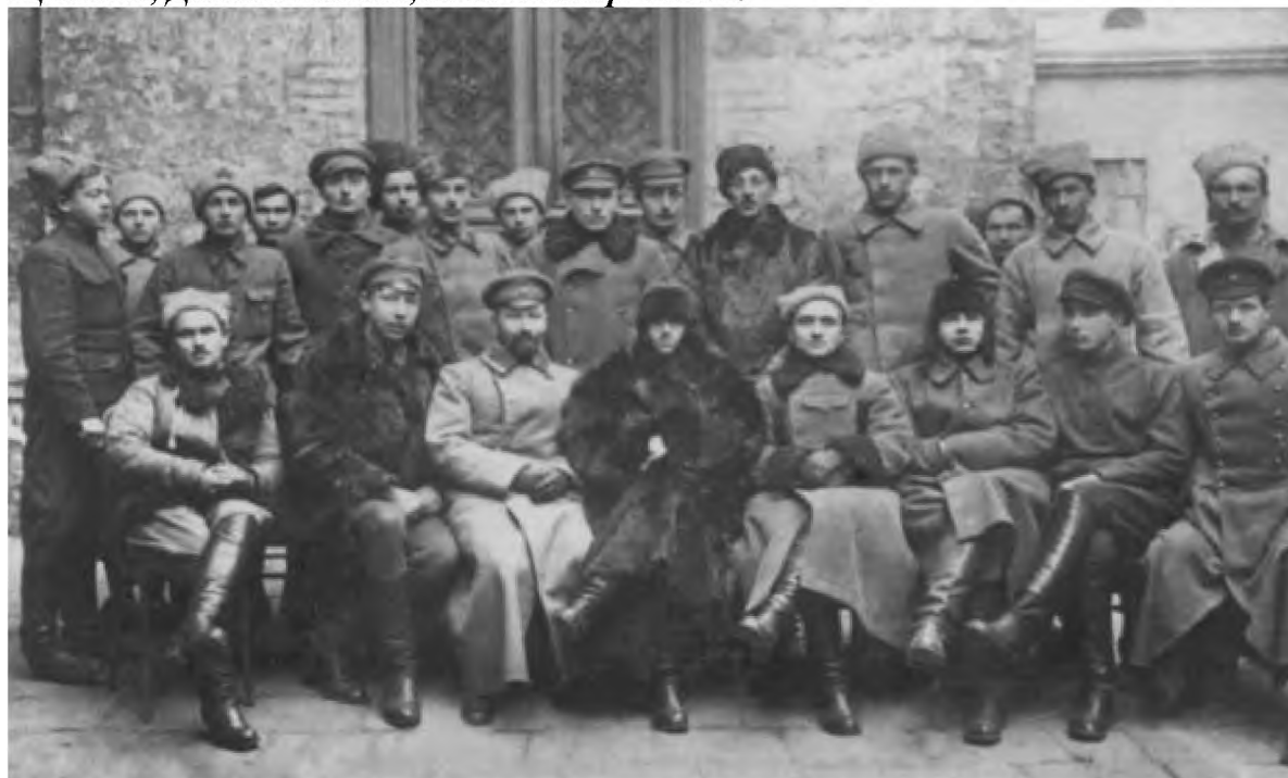
Командиры и работники штаба 51-й Московской дивизии. Крым, январь 1921 г.