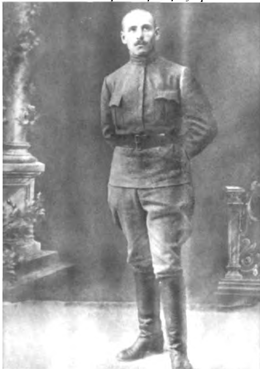
В. К. Блюхер — главнокомандующий Сводным отрядом южноуральских партизан. 1918 г.