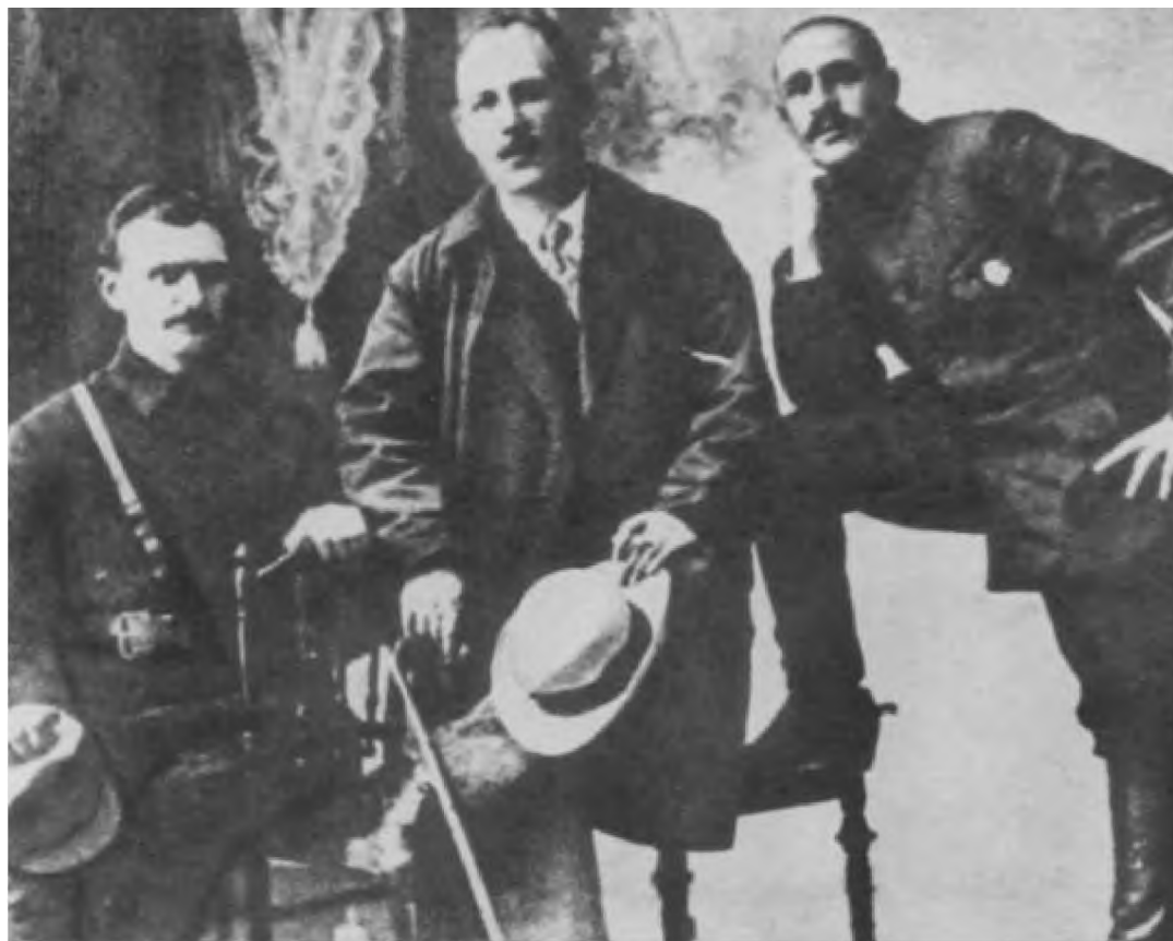
Е. А. Щаденко, Демьян Бедный, В. К. Блюхер. 1920 г.