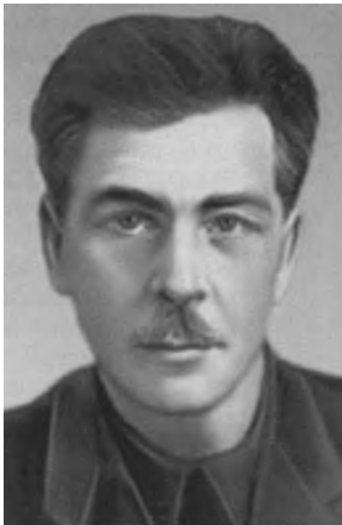
П. П. Постышев, член военного совета Восточного фронта