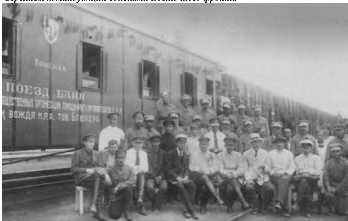
Поезд-баня Центрального комитета общественных организаций помощи фронту при правительстве Дальневосточной республики имени вождя НРА тов. Блюхера. В. К. Блюхер (сидит шестой слева в первом ряду) среди членов правительства ДВР, командиров и бойцов НРА