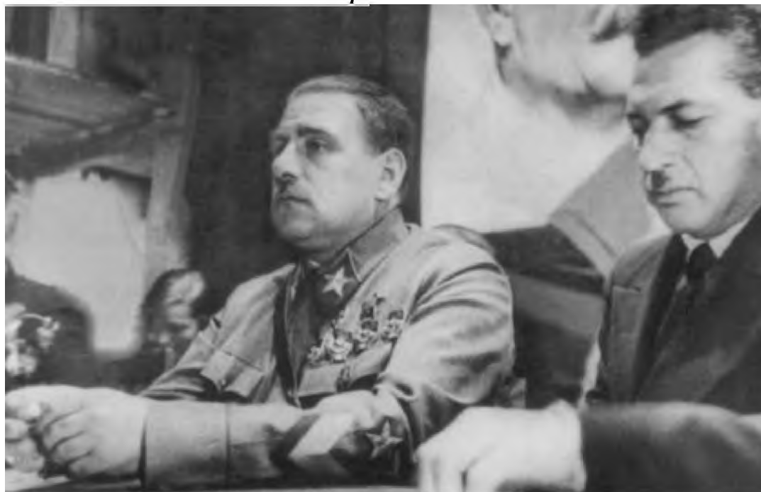
В. К. Блюхер и первый секретарь Дальневосточного крайкома ВКП(б) И. Т. Варейкис. 1937 г.