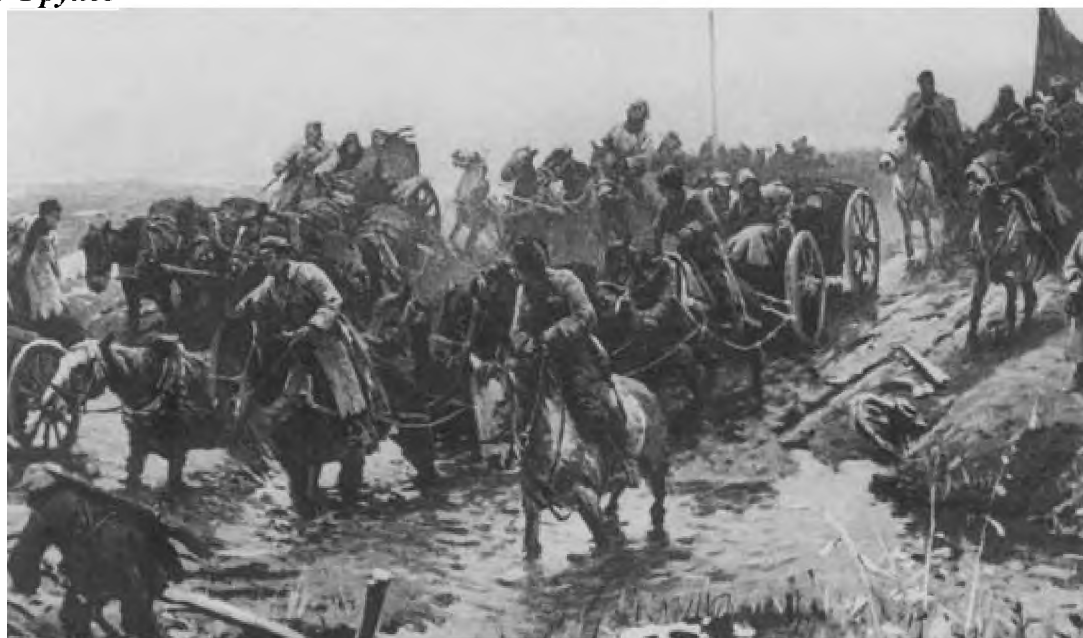
На штурм Перекопа. Фрагмент диорамы