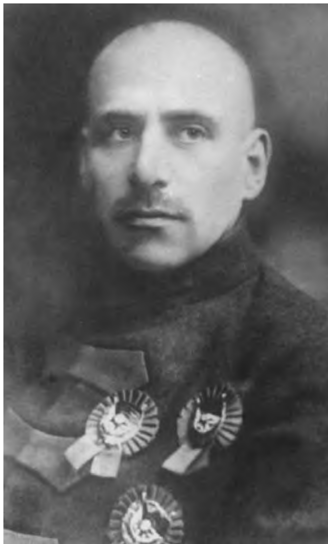
В. К. Блюхер — военный министр, главнокомандующий вооруженными силами Дальневосточной республики