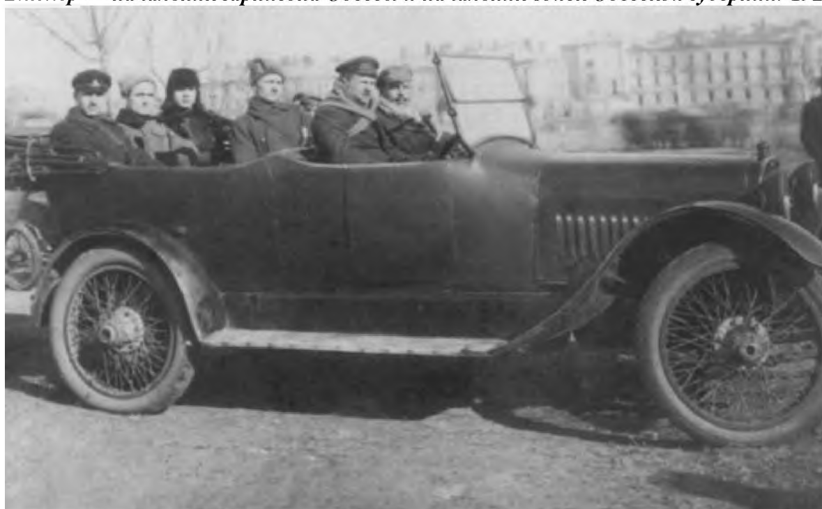
В. К. Блюхер (в автомобиле первый слева) перед парадом войск гарнизона в честь 3-й годовщины РККА. Одесса, 23 февраля 1921 г.