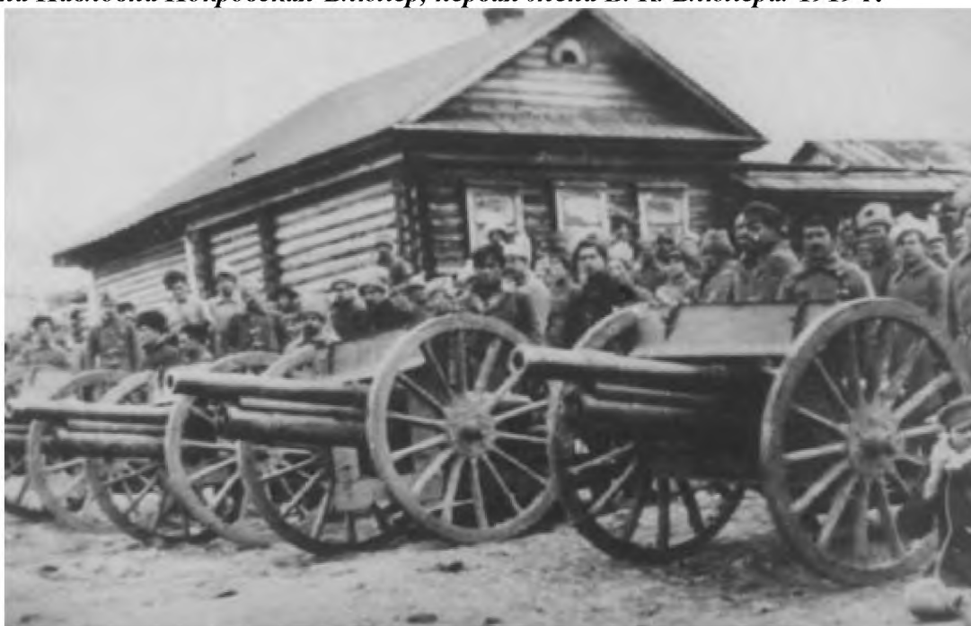
Артиллерия Красной армии на Восточном фронте. 1919 г.