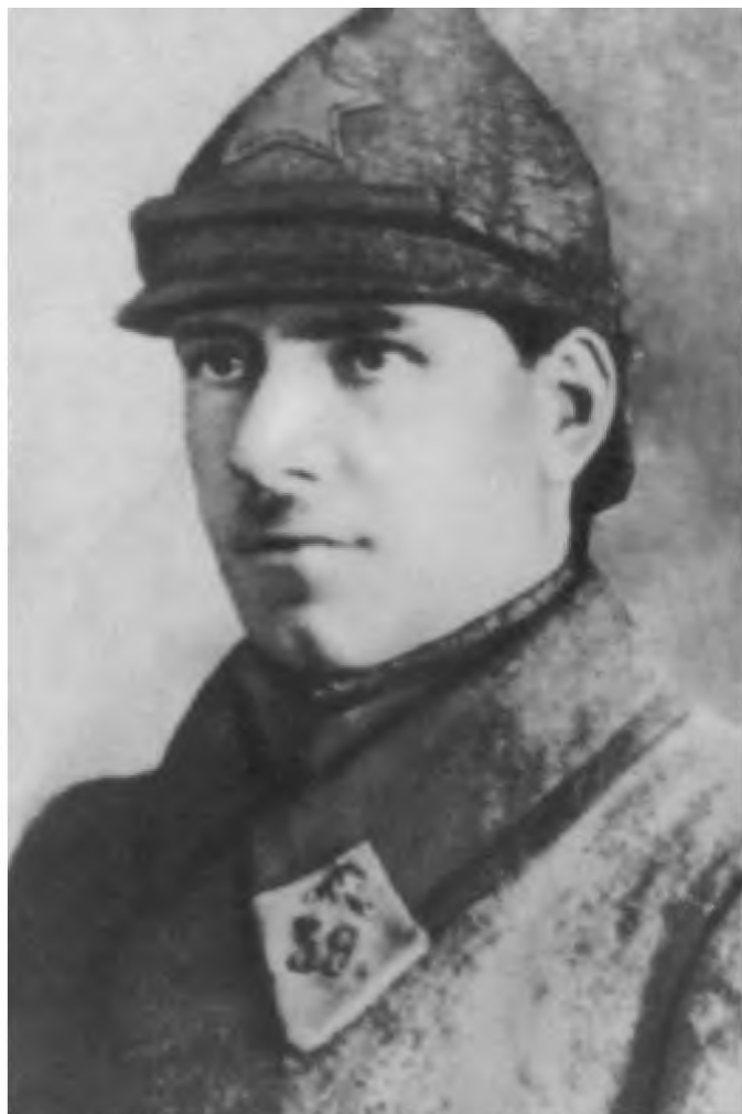
Командир полка Г. К. Жуков (будущий Маршал Советского Союза) Петроград, 1923 г.