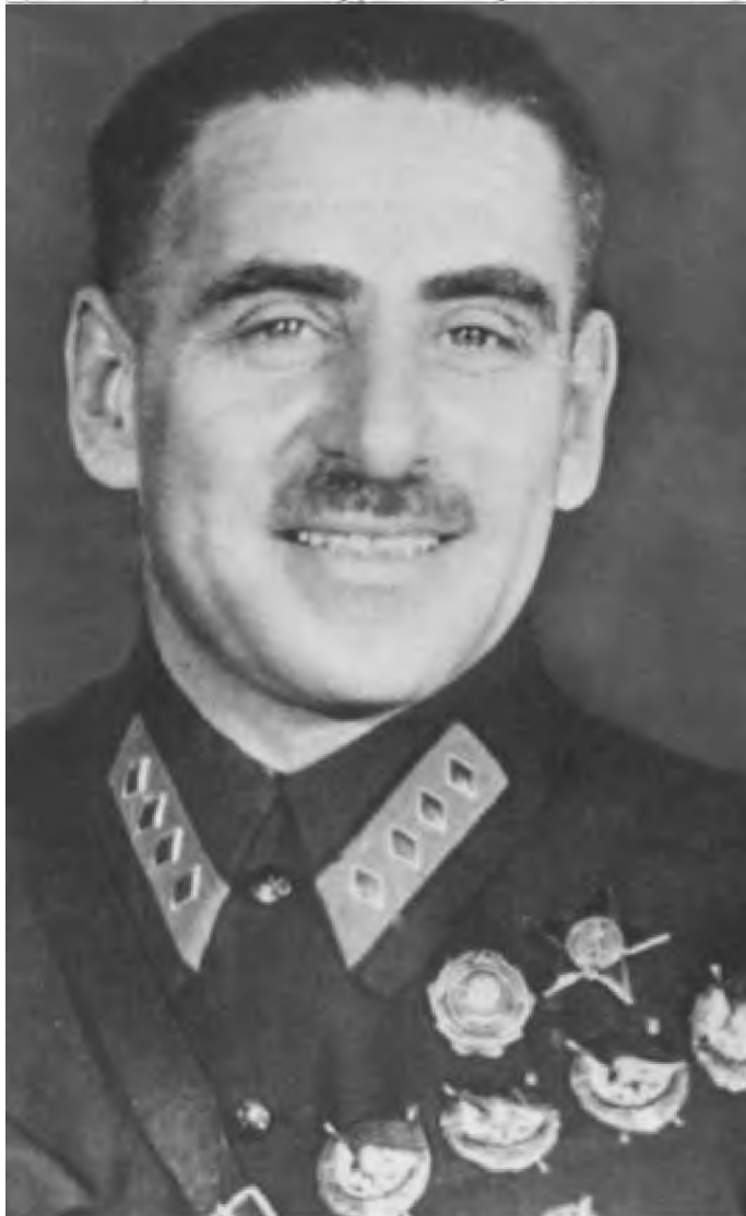
Командующий Особой Дальневосточной армией командарм 1-го ранга В. К. Блюхер

П. Е. Дыбенко, В. К. Блюхер, К. Е. Ворошилов. Киев, 1928 г.