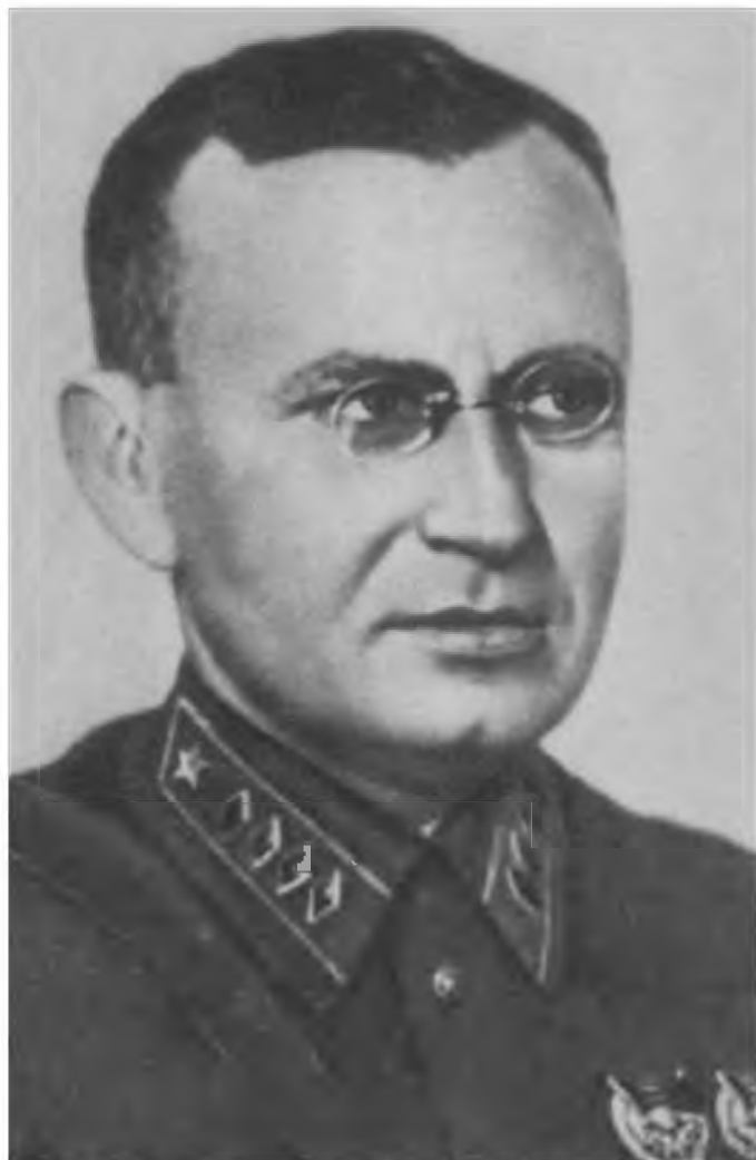
И. П. Уборевич