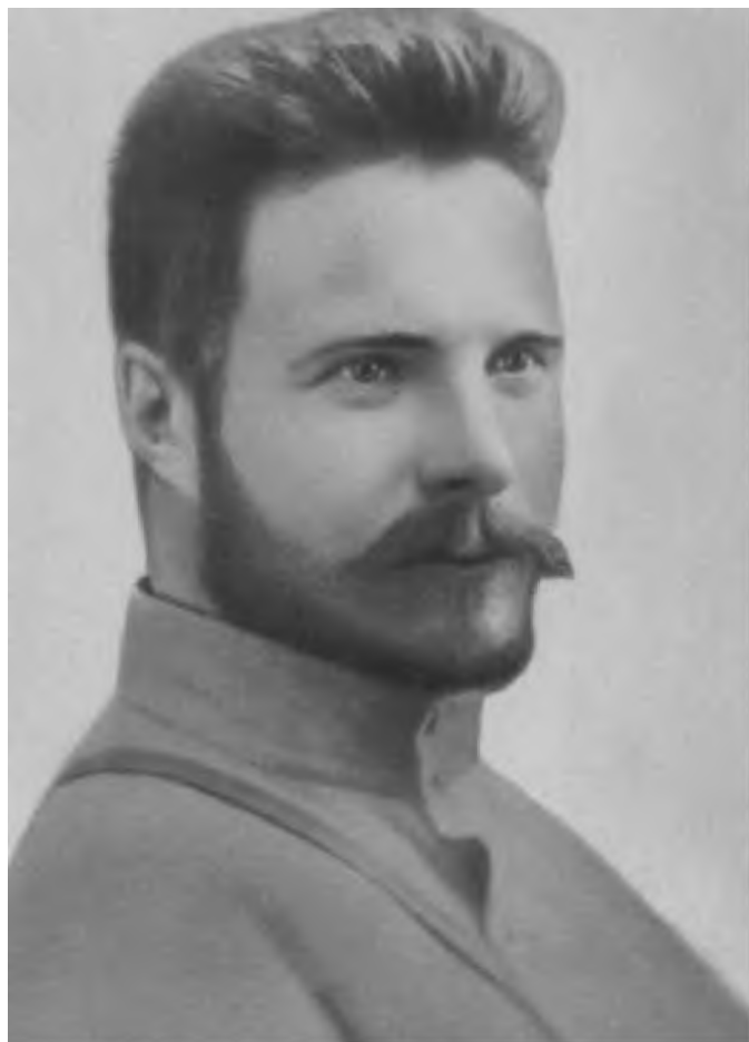
М. В. Фрунзе