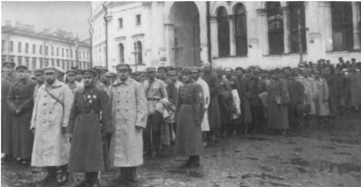
Впереди колонны войск Я. Ф. Фабрициус (заместитель командира 1-го стрелкового корпуса) и В. К. Блюхер. Петроград, 1923 г.