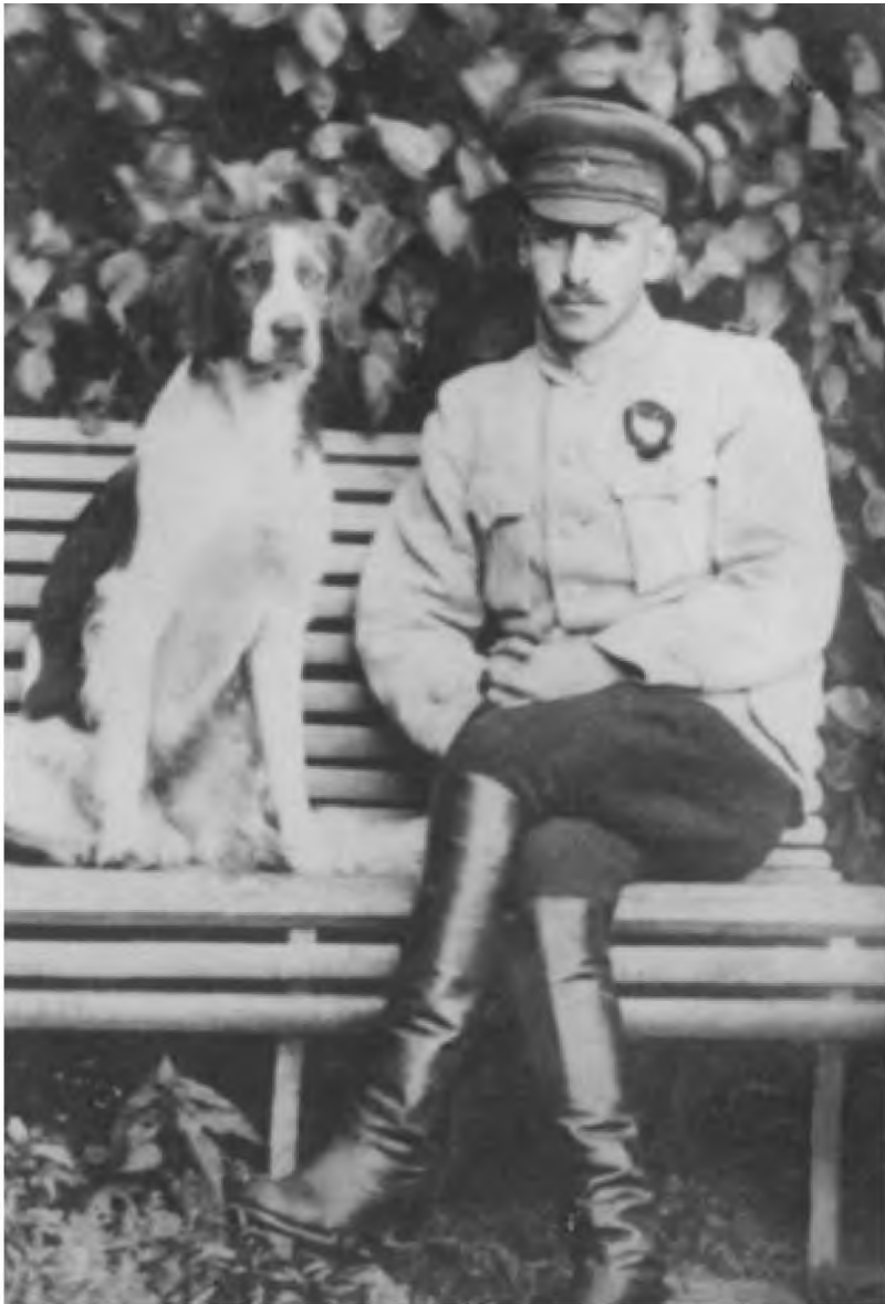
В. К. Блюхер — начальник 51-й стрелковой дивизии. Тюмень, август 1919 г.