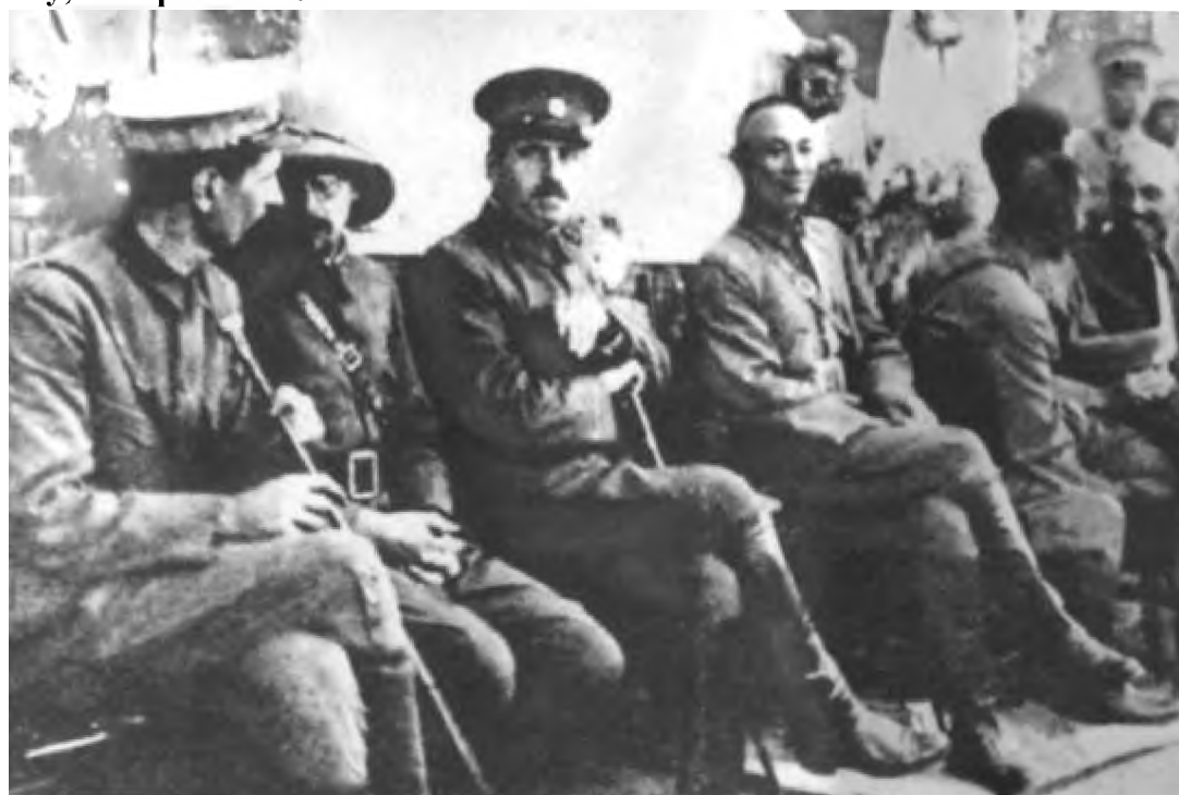
М. М. Бородин (второй слева), В. В. Уральский (В. К. Блюхер), Чан Кайши