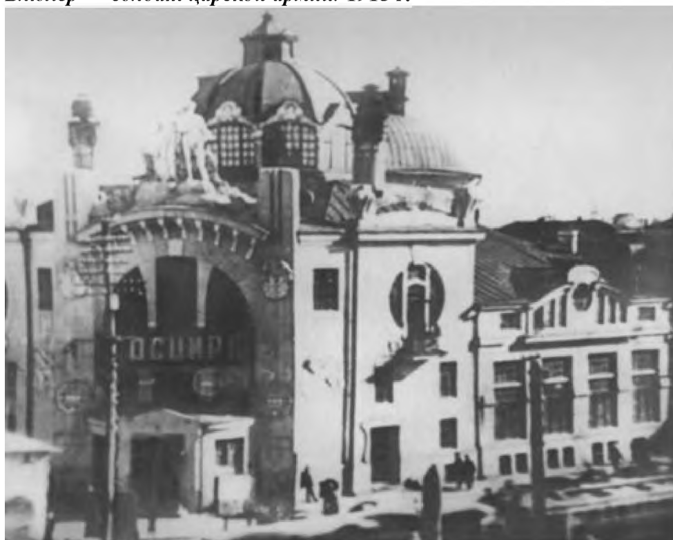
Здание театра «Триумф» в Самаре, где в ночь на 26 октября 1917 года проходило заседание