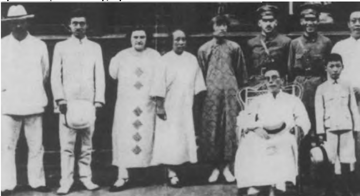
Стоят: М. М. Бородин (первый слева), его жена (третья слева), жена Чан Кайши (пятая слева), З. В. Галин (В. К. Блюхер), Чан Кайши