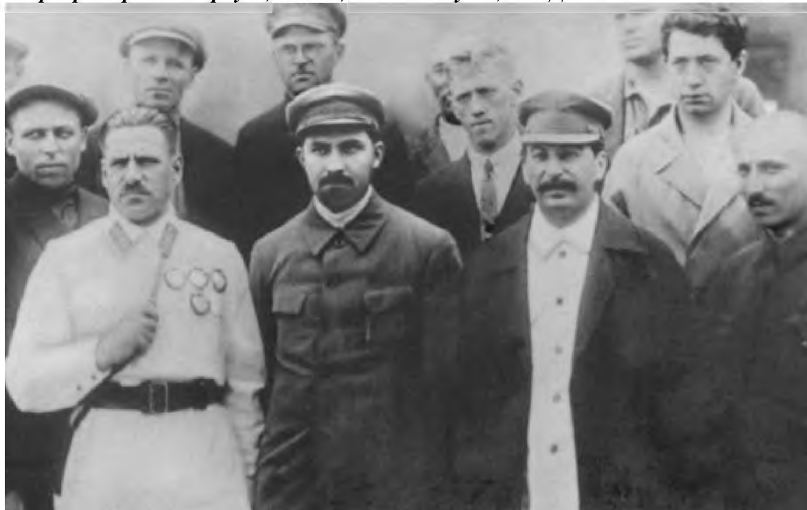
Среди делегатов-дальневосточников XVI съезда ВКП(б). Стоят в центре: В. К. Блюхер, Л. М. Каганович, И. В. Сталин, И. Н. Перепечко. Москва, июль 1930 г.