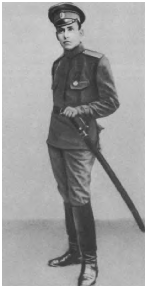
В. К. Блюхер — солдат царской армии. 1915 г.