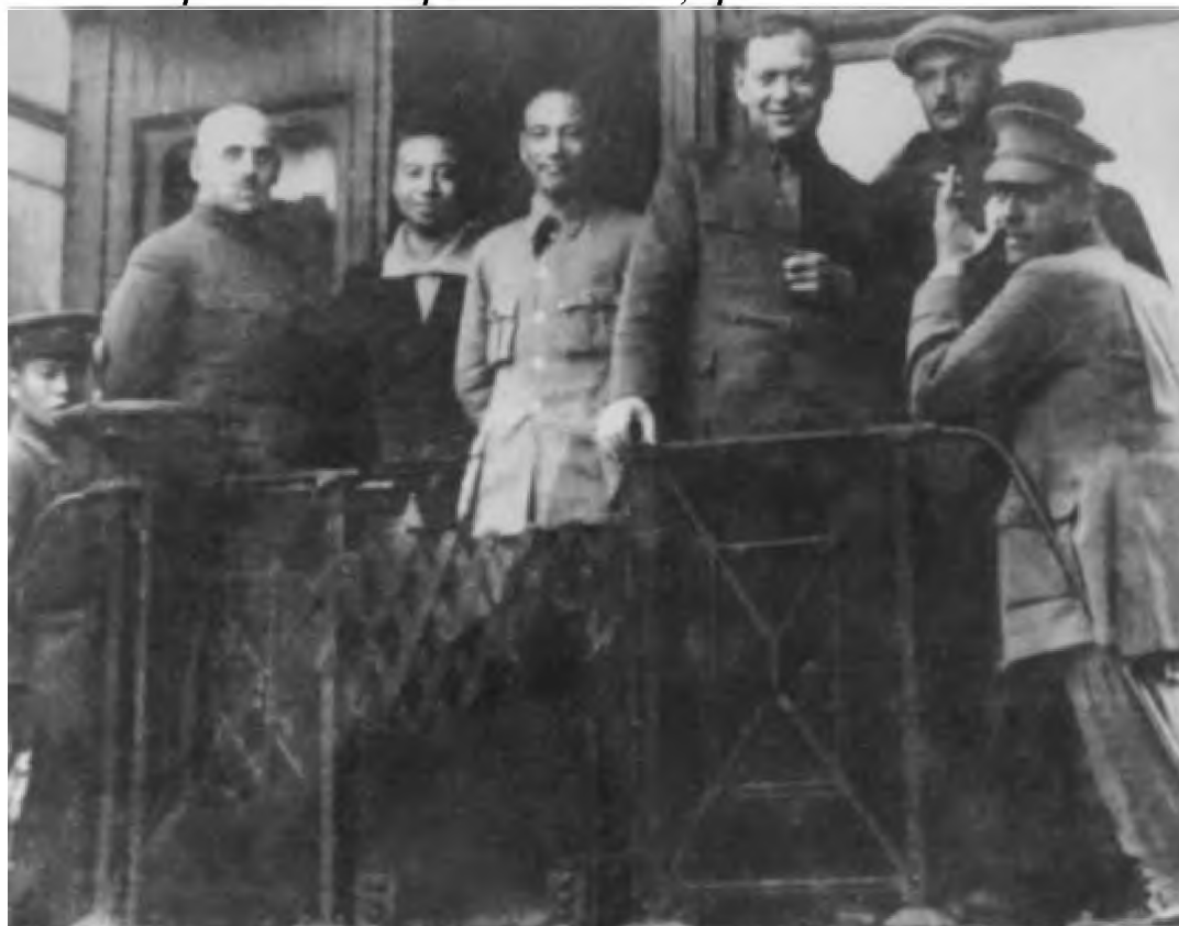
Главный военный советник в Китае В. В. Уральский (В. К. Блюхер) — второй слева и командующий Народно-революционной армией Китая Чан Кайши — четвертый слева во время первого Восточного похода. Железная дорога Кантон-Коулун, 1925 г.