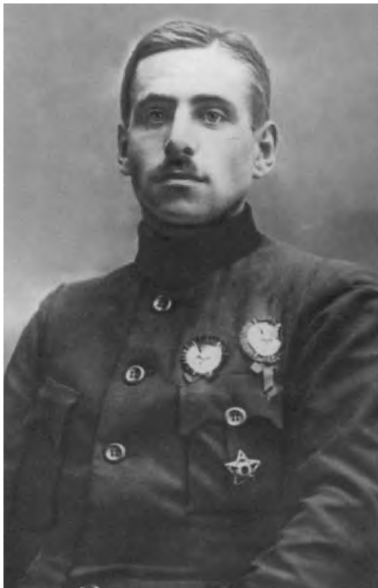
В. К. Блюхер — начальник гарнизона Одессы и начальник войск Одесской губернии. 1921 г.