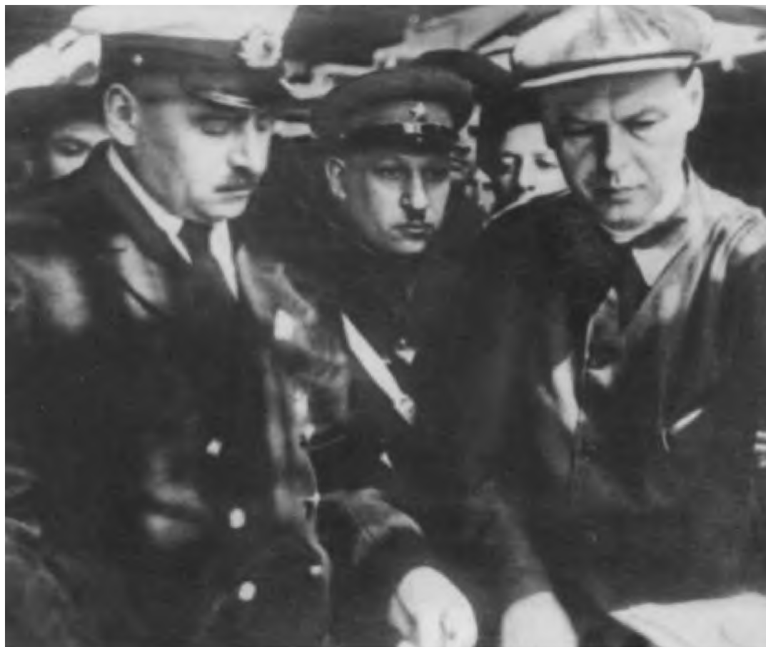
В. К. Блюхер на Дальмашзаводе в Комсомольске-на-Амуре. 1936 г.