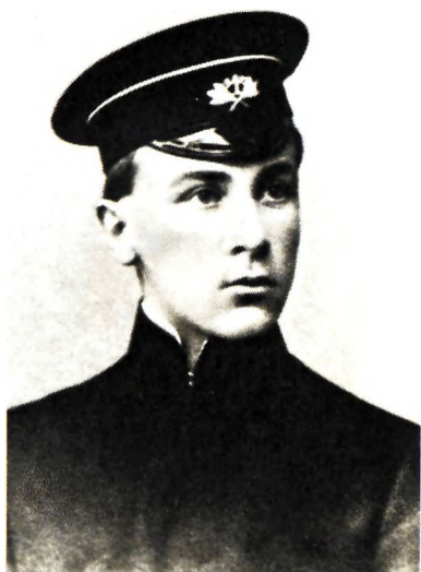
Михаил Булгаков — гимназист. 1908, Киев