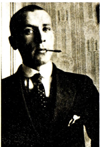
М. А. Булгаков. 1916, Киев