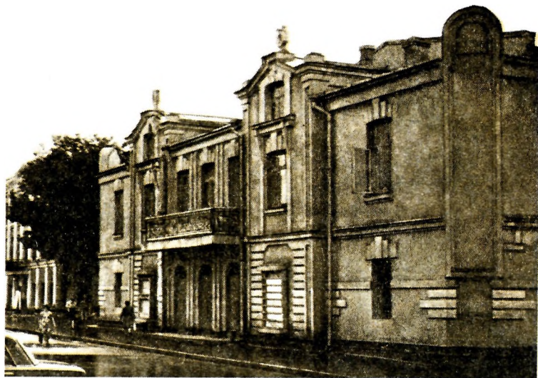
Владикавказ (совр. г. Орджоникидзе). Здание, где в 1920 г. Булгаков работал в подотделе искусств Владикавказского наробраза