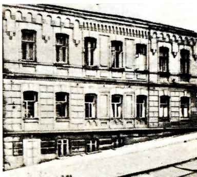
Дом, где жила семья Булгаковых в 1906—1913 и 1918—1919 гг. Киев, Андреевский спуск, д. 13. Фото 1970-х годов