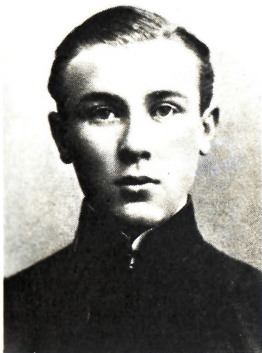
Михаил Булгаков — гимназист. 1909, Киев