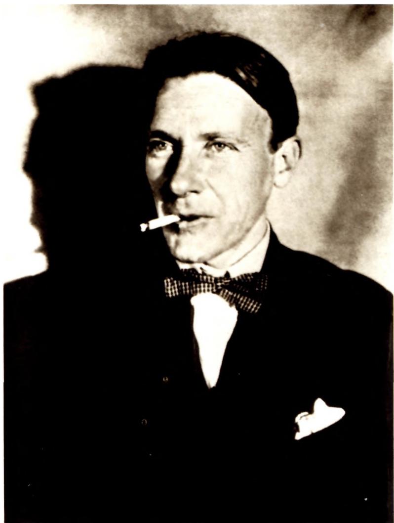
М. А. Булгаков. 1926, Москва