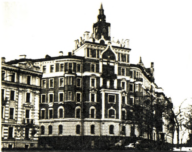
Москва. Дом по Сретенскому бульвару, 6, где в 1921 г. М. А. Булгаков работал в Лито Главполитпросвета. Современное фото