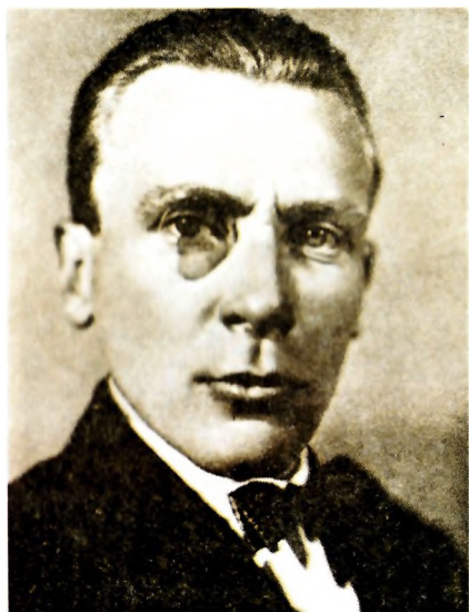
М. А. Булгаков. 1926, Москва