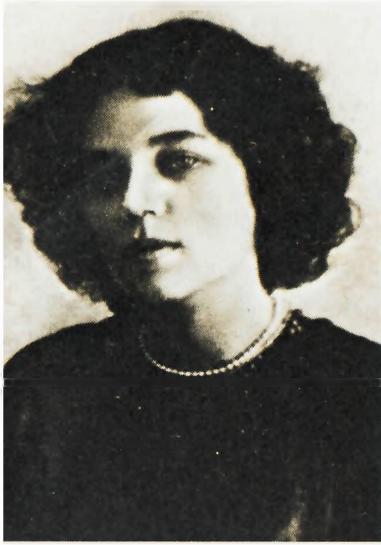
Т. Н. Лаппа. Начало 1910-х годов