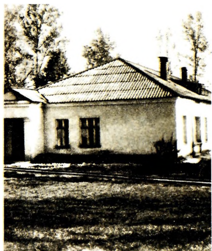
Вязьма. Городская земская больница (флигель), где Булгаков работал врачом в 1917—1918 гг. Современное фото