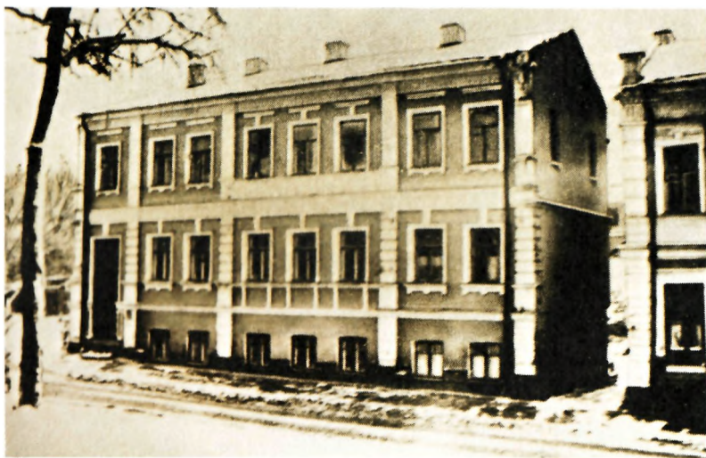
Дом, в котором родился М. А. Булгаков. Киев, Воздвиженская ул., д. 10. Современное фото