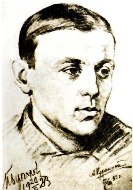
М. А. Булгаков. Рис. А. Куренного. 1923, Москва, изд-во «Никитинские субботники»