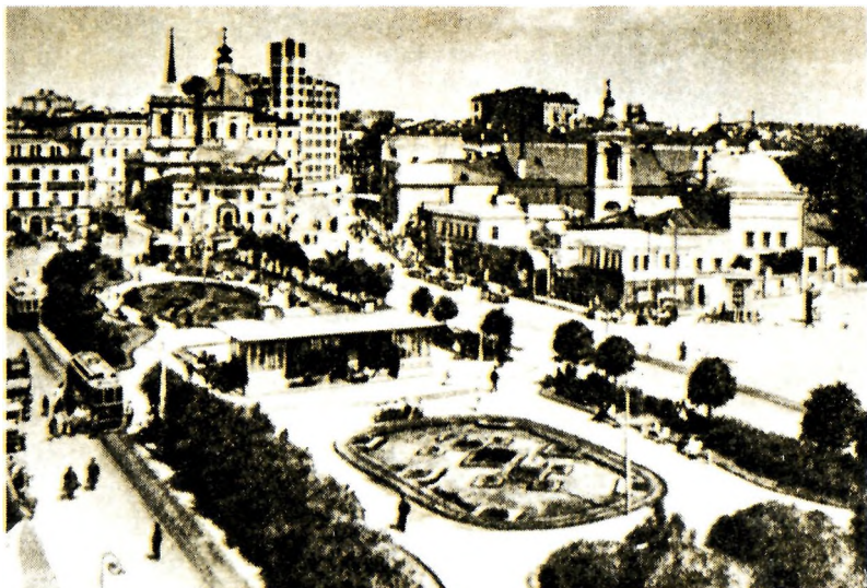
Москва. Арбатская площадь. Фото 1920-х годов