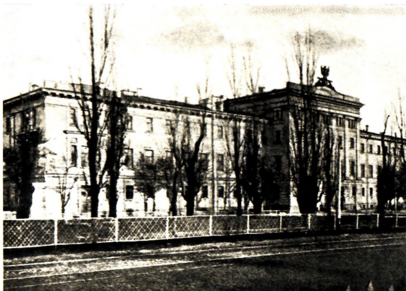
Первая Киевская гимназия, где учился М. А. Булгаков в 1901—1909 гг. 1900-е годы