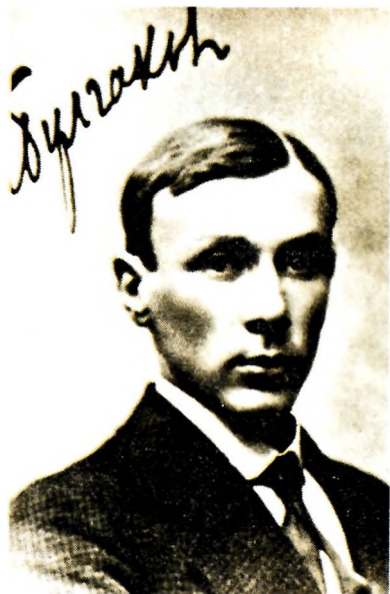
М. А. Булгаков. 1916, Киев