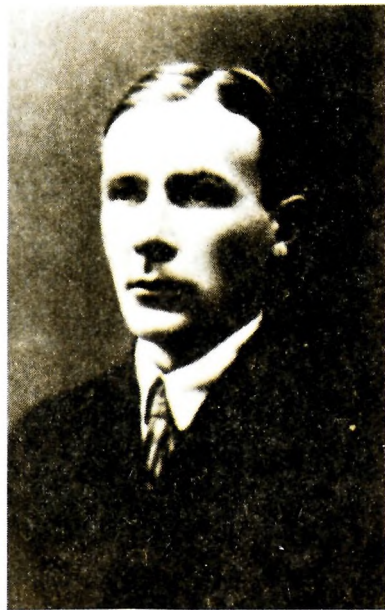
М. А. Булгаков. Начало 1920-х годов, Москва