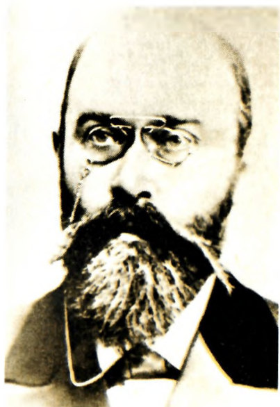
А. И. Булгаков. Начало 1900-х годов, Киев