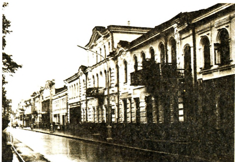
Владикавказ (совр. г. Орджоникидзе). «Первый Владикавказский советский театр», где в 1920—1921 гг. шли ранние пьесы М. А. Булгакова