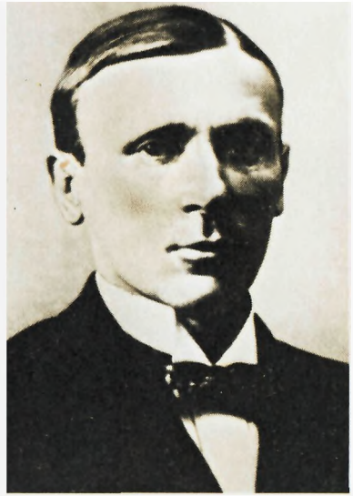
М. А. Булгаков. 1913