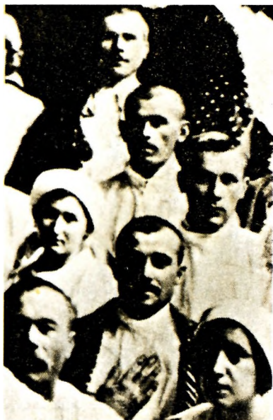
М. А. Булгаков среди раненых в Киевском госпитале Красного Креста. Начало 1916 г.