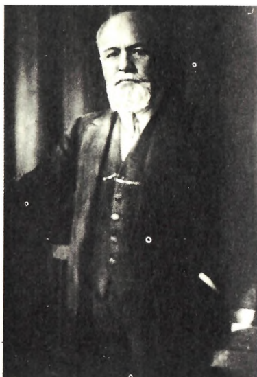
В. И. Немирович-Данченко