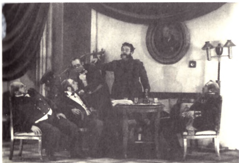
«Мертвые души». МХАТ, 1932. Сцена из спектакля