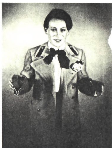
Лариосик — М. Яншин