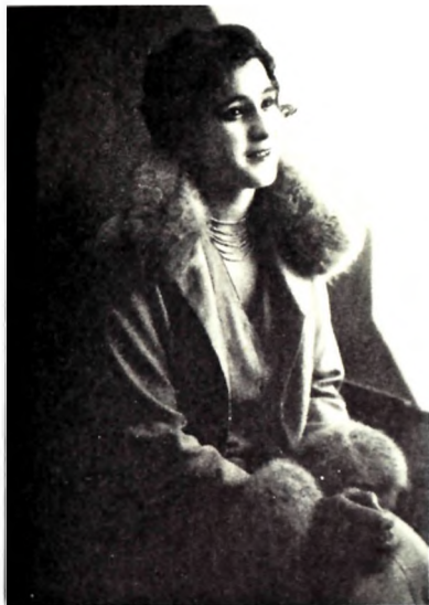
О. Л. Книппер-Чехова