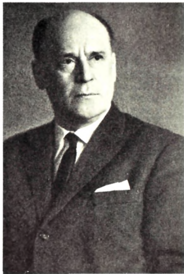
Б. Н. Ливанов