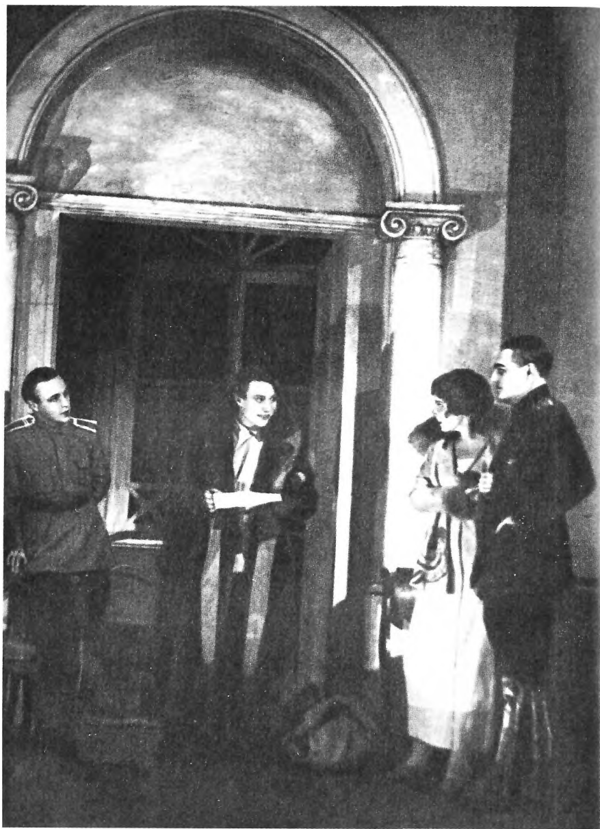
«Дни Турбиных». МХАТ, 1926. Сцена из спектакля