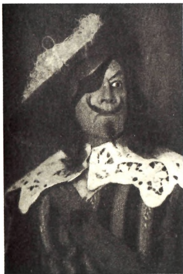
Герцог д'Орсиньи — Н. Подгорный