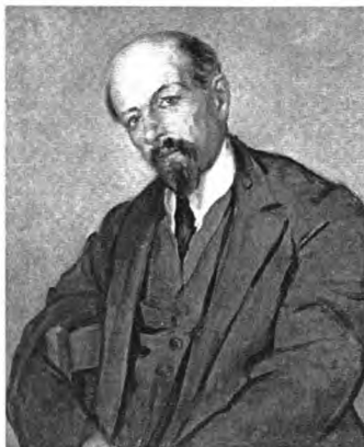
Портрет Ленина. Худ. Эмиль Бернар

Хочется представить редчайший и неожиданный портрет играющего в шахматы Ленина, написанный знаменитым мастером Эмилем Бернаром (1868-1941).