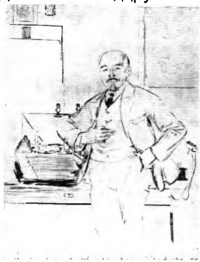
В.И. Ленин.(эскиз) Худ. Ф.Малевин.

Сам Б.М. Кустодиев для статьи «О портретах Ленина», написанной для Лениздата, к изданию сборника, к сожалению не увидевшего свет, писал: «Самое существенное в вопросе о портретах Ленина – это то или иное задание, данное портретисту. Ленин-учёный – одно лицо; Ленин-агитатор, говорящий речь на площади – другое и т.д. На чем же остановиться? Если говорить о каком-то одном портрете, который должен суммировать все стороны характера и деятельности Ленина, то от художника требуется синтез целого ряда образов. Всякий же синтез, понятно, будет субъективен». 74 Для контраста приведём два портрета Ленина: один - Земной, другой – Небесный.