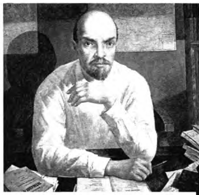
В.И. Ленин Худ. Кузьма Петров-Водкин

В портрете Ленина, написанным выдающимся мастером К. Петровым-Водкиным современные критики видят, чуть ли не карикатуру. Подчёркивается не только монгольские черты лица, но и нечто «дьявольское» в облике вождя, анти-икону. Анализу подвергается чтение Лениным книги А.С.Пушкина «Песни западных славян» и находят здесь критику Брест-Литовского мира или даже Рижского мира 1921 года. Западная Украина и Западная Белоруссия оказались на территории Польши. Всё является передёргиванием фактов. «Песни западных славян» созданных или фальсифицированных Проспером Мериме (1827 г.) и переведённые Пушкиным на русский язык с французского, касаются юго-западных славян: сербов, черногорцев, хорватов и их борьбе против турок, Бонапарта. Есть и шедевры, не устаревшие до сих пор: