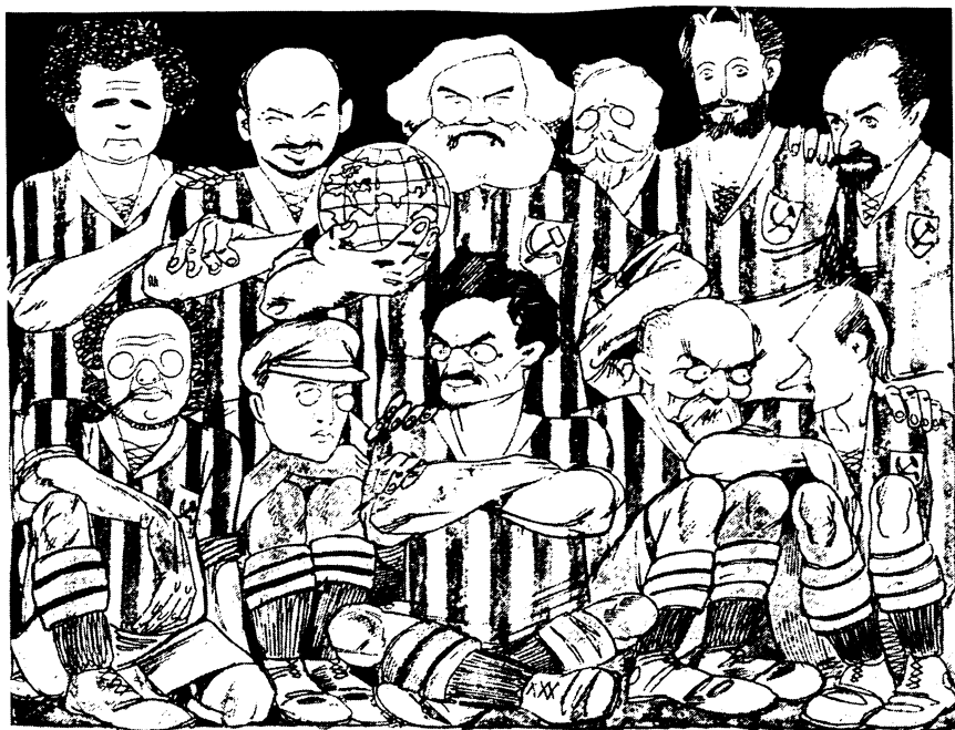
Карикатура из журнала «Красный перец», 1923, №14, с.7.

Карикатурное изображение ведущих советских политиков, стоящих у власти в 1923 году, в виде сборной команды по футболу.