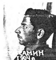
Фото из следственного дела В. Бромберга