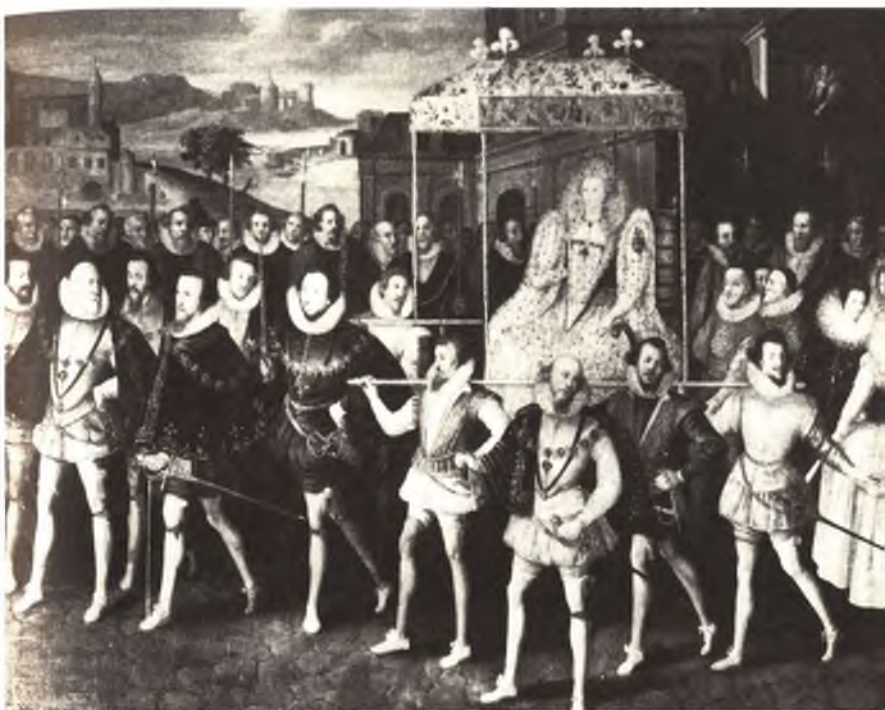
Елизавета I во время турне по стране. Художник Роберт Пик.