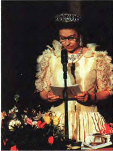
Елизавета II в парламенте.