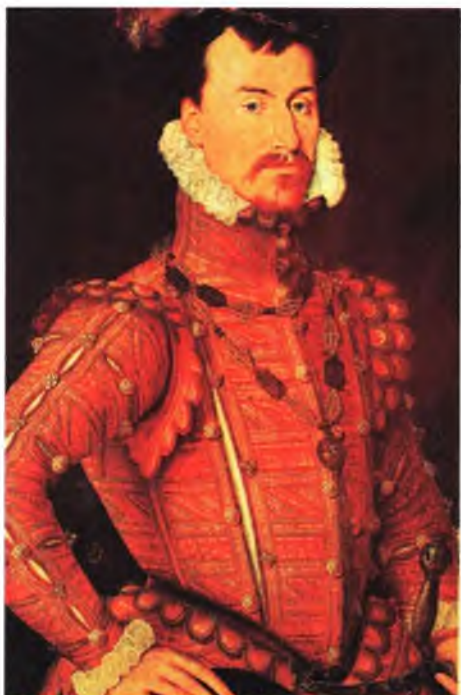
Роберт Дадли, граф Лестер в молодости.