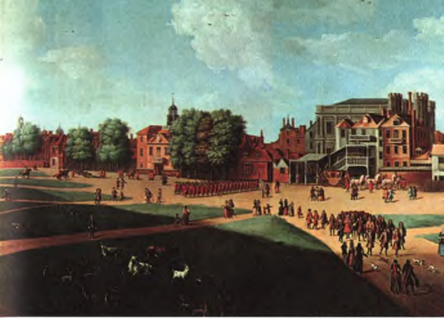
Вид на дворцы Уайтхолл и Сент-Джеймс в Лондоне в XVII в. Художник неизвестен.