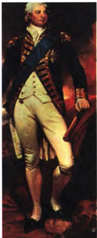
Вильгельм IV в парадной форме. Художник Мартин Ши.