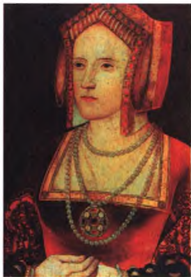
Екатерина Парр, шестая жена Генриха VIII. Из коллекции дворца Лэмбет.