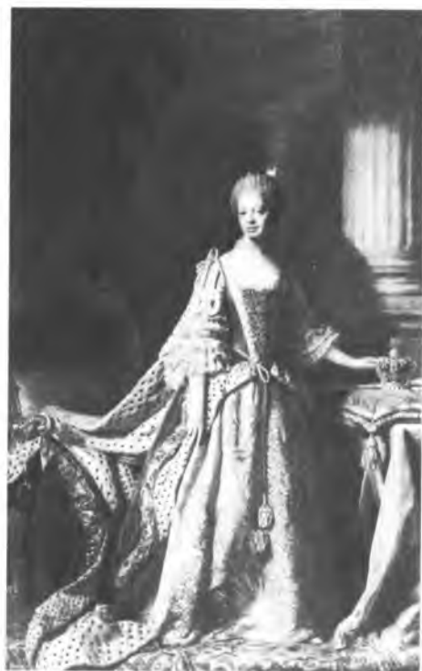
Супруга Георга III Шарлотта. Художник Аллан Рамзей.