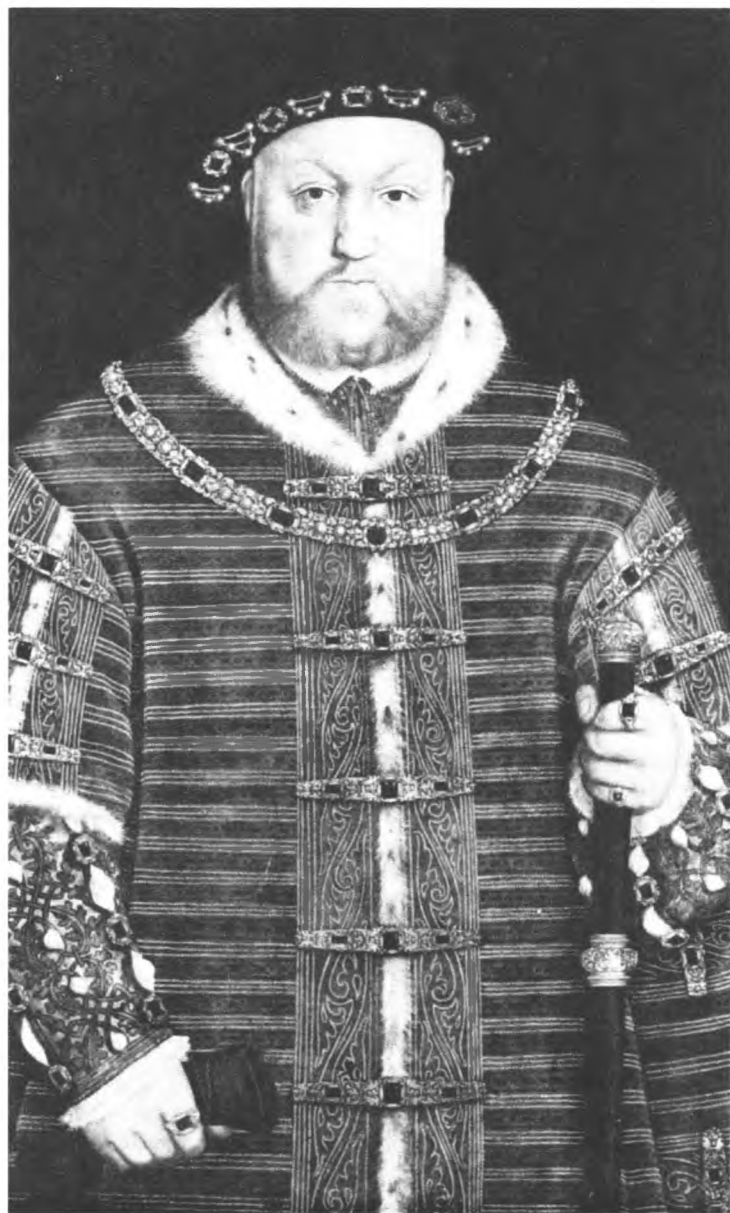
Генрих VIII. Художник Гольбейн младший.