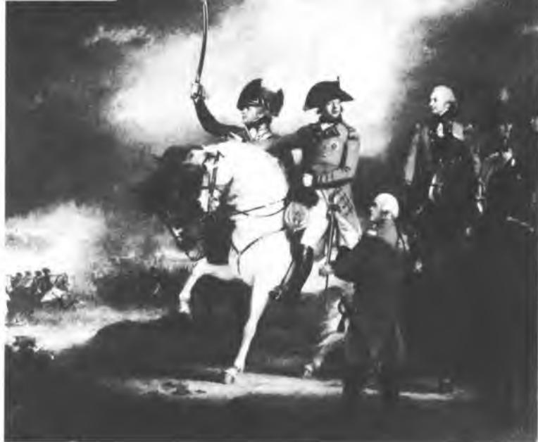
Георг III на параде. Художник Уильям Бичи.