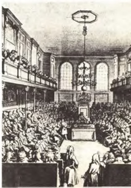
Зал заседаний английского парламента. Середина XVI в. Старинная гравюра.