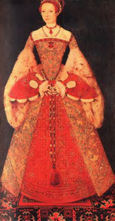
Принцесса Елизавета, 13 лет. Художник неизвестен.