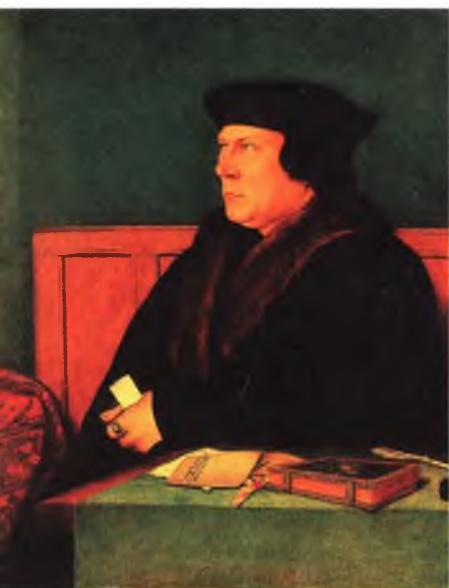
Томас Кромвель, лорд — главный правитель Англии. Художник Гольбейн младший.