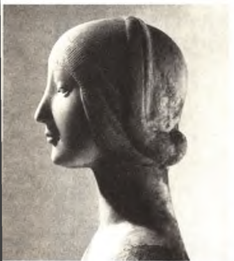
Бюст Екатерины Арагонской, первой жены Генриха VIII. Скульптор Франческо Лаурано.