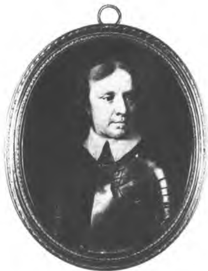
Медальон с портретом Оливера Кромвеля. Художник Сэмюэл Купер.