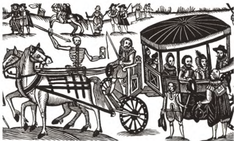
Бегство королевского семейства из Лондона во время чумы. Старинная гравюра.