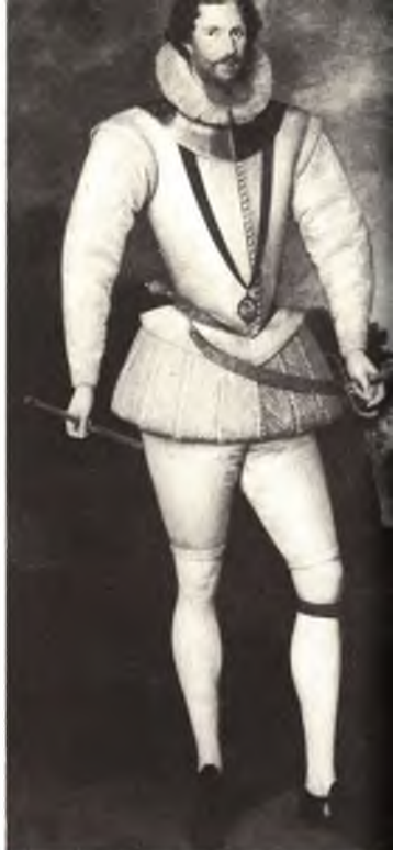
Роберт Деверё, граф Эссекс. Художник Маркус Гирертс.

Королевский теннис в Англии в сер. XVI в. Из книги Яна Коменюса "Орбис сенсуалиум ликтус".