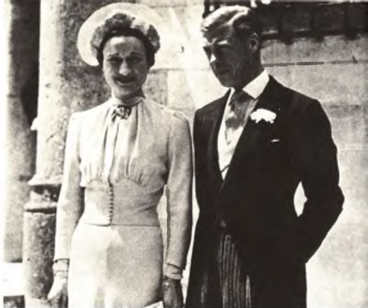
Герцог и герцогиня Виндзорские во время свадьбы.

Коронация Георга V в Лондоне 22 июня 1911 г. С ним рядом — королева Виктория-Мария.