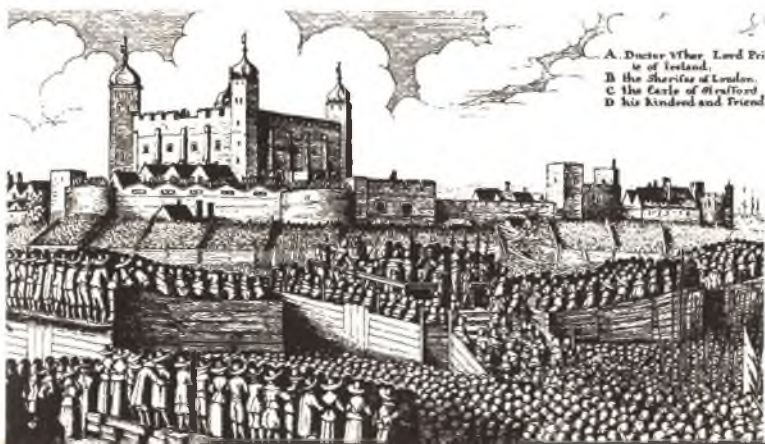
Вид на публичную казнь у стен Тауэра. Старинная гравюра.