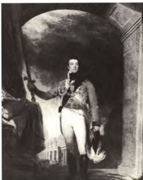
Герцог Веллингтонский после победы в битве при Ватерлоо. Художник Томас Лоуренс.