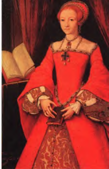
Леди Джейн Грей за несколько лет до того как ее возвели на трон. Художник "Мастер Джон".