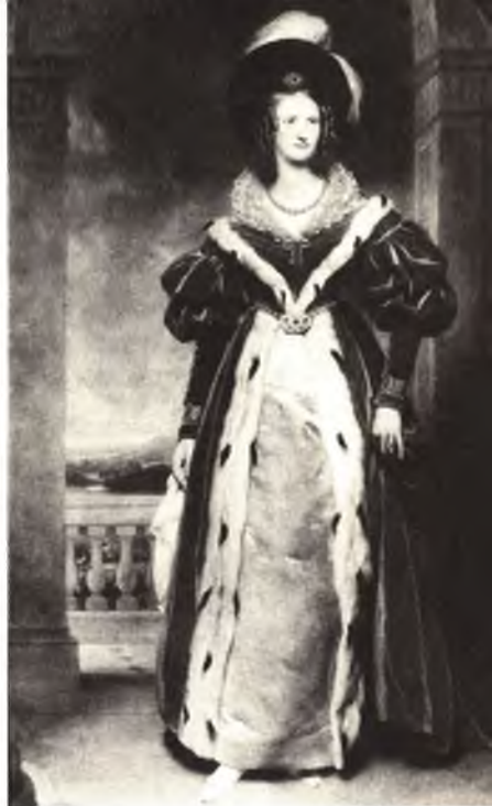
Супруга Вильгельма IV Аделаида. Из коллекции Елизаветы II.