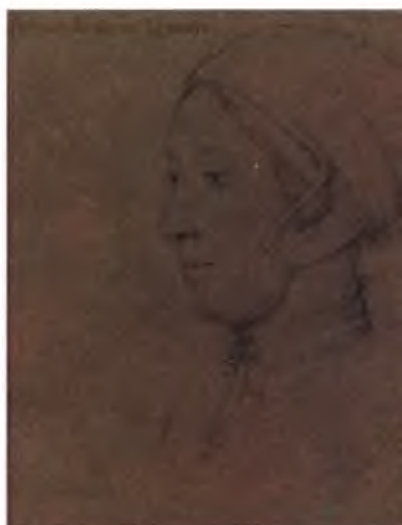
Анна Бoleyн, вторая жена Генриха VIII. Художник Гольбейн младший.