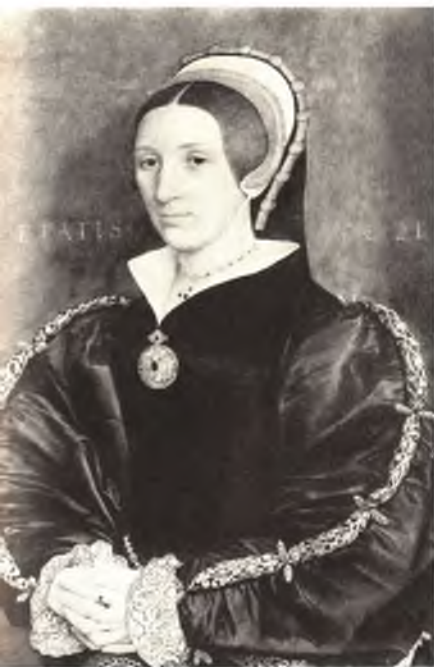
Кэтрин Говард, пятая жена Генриха VIII. Художник Гольбейн младший.