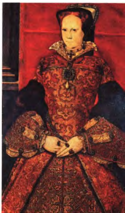
Мария Тюдор. Художник Ганц Юворт.