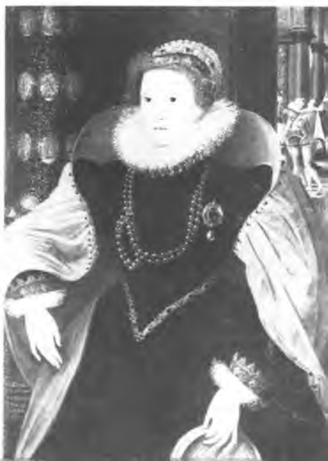
Елизавета I в преклонном возрасте с решетом — символом девственности. Художник неизвестен.