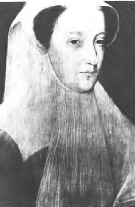
Мария Стюарт. Художник Дейл Бланк.