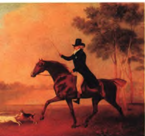
Георг IV. Художник Джордж Стаббс.