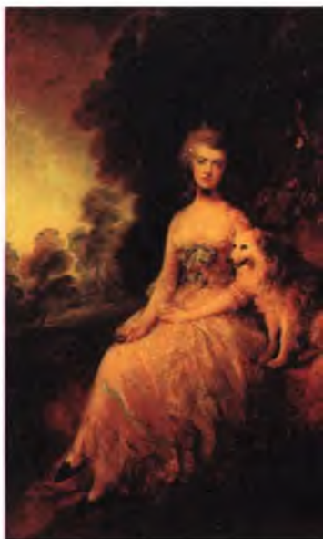
Пердита, миссис Робинсон. Художник Томас Гейнсборо.