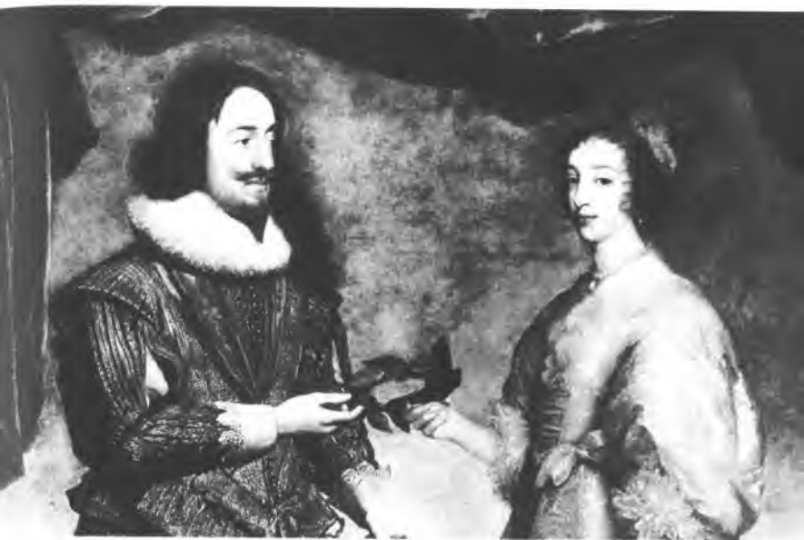
Карл I и его супруга Генриетта Мария. Художник Даниел Майтенс.