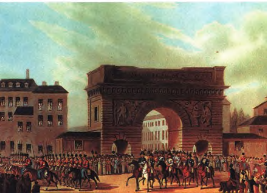
Вступление русских и других союзных войск в Париж 31 марта 1814 г. Гравюра неизвестного художника.