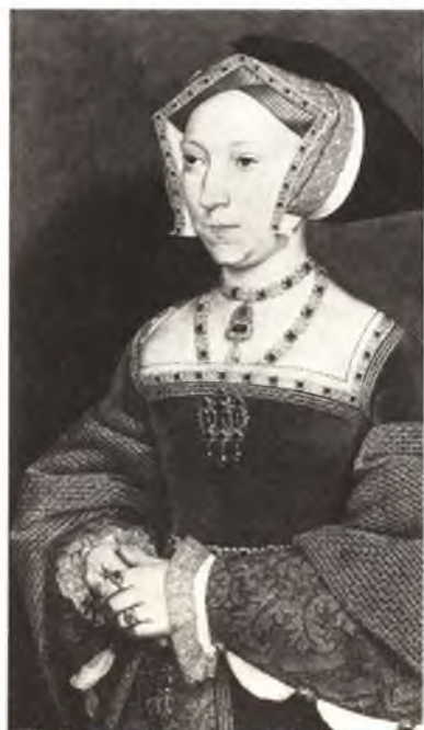
Анна Клевская, четвертая жена Генриха VIII. Художник Гольбейн младший.