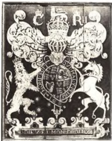
Герб британской монархии.