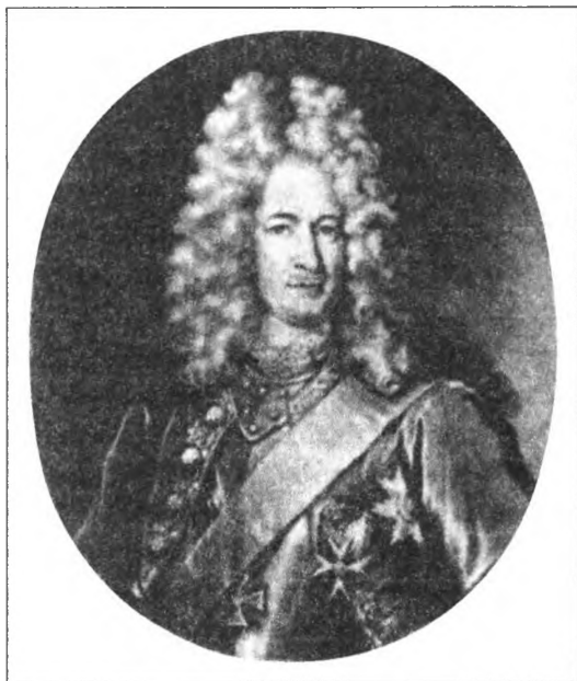
Меншиков А. Д. (1673–1729 гг.) Гравюра С. Лондини. 1697 г.