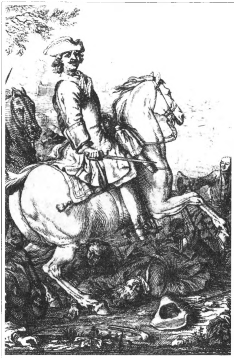
Петр I в Полтавском сражении.

Рисован и гравирован М. Мартен (сын). Г. летбуль XVIII века. Фрагмент.