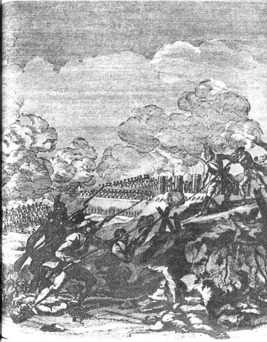
Сражение при Прохоровке 30 августа 1757 г. Гравюра неизвестного художника, 3-я четверть XVIII века