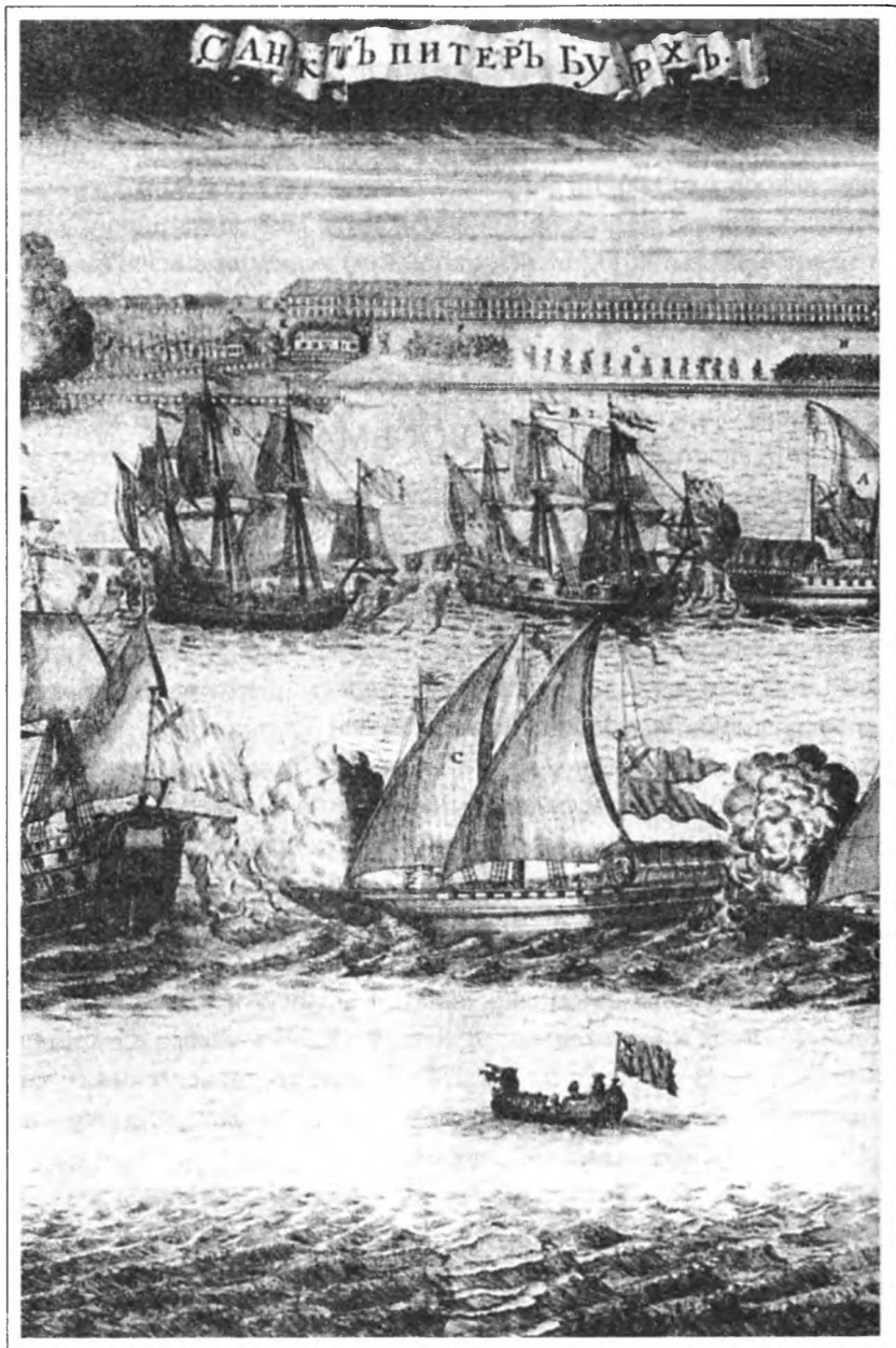
Торжественный вход в Петероурі 8 сентября 1720 г. четырех шведских фрегатов, взятых в плен в сражении при Гренгаме. Гравюра А. Зубова. 1720 г. Фрагмент.