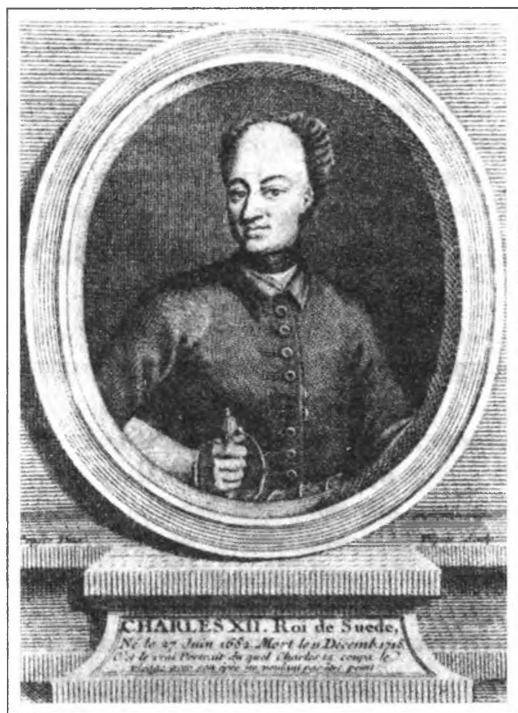
Карл XII. 1697–1718 гг. Гравюра Э. Финке по оригиналу Крафа. Конец XVIII—начало XIX века