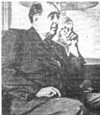
Ян Масарик – министр иностранных дел Чехословакии. Предполагаемая жертва МГБ

Отто Ион, руководитель западногерманской разведки, был «выведен» КГБ на территорию ГДР