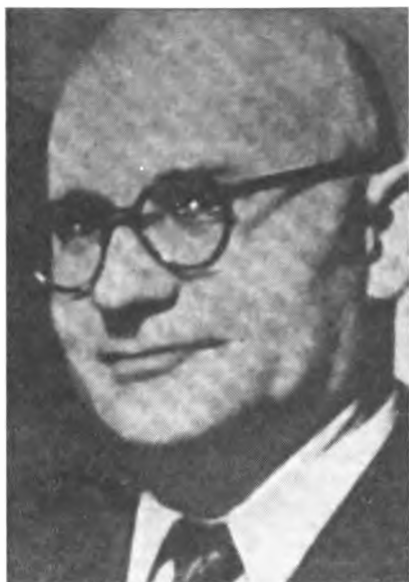
Конкурент С. Бандеры, один из лидеров ОУН Л. Ребет