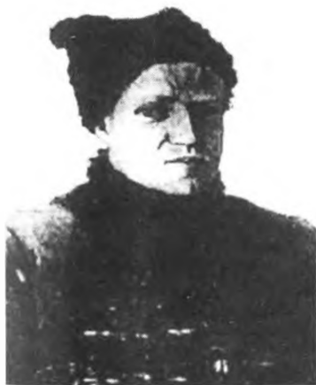
Генерал Ю. Тютюнник – руководитель антибольшевистского движения в начале 20-х годов