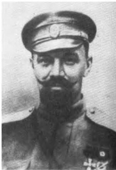
Генерал А. П. Кутепов, глава РОВС – погиб в ходе попытки похищения в Париже в 1930 г.