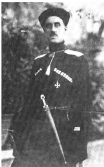
П. Н. Врангель – предполагаемая жертва ОГПУ