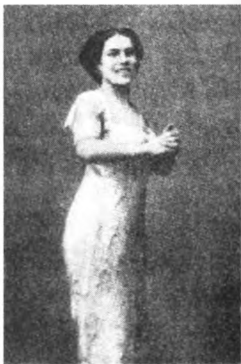
Супруги генерал Н. В. Скоблин и певица Н. В. Плевацкая, агенты ИНО НКВД