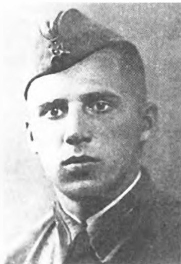
И. Миклашевский, участник предполагавшегося покушения на Гитлера