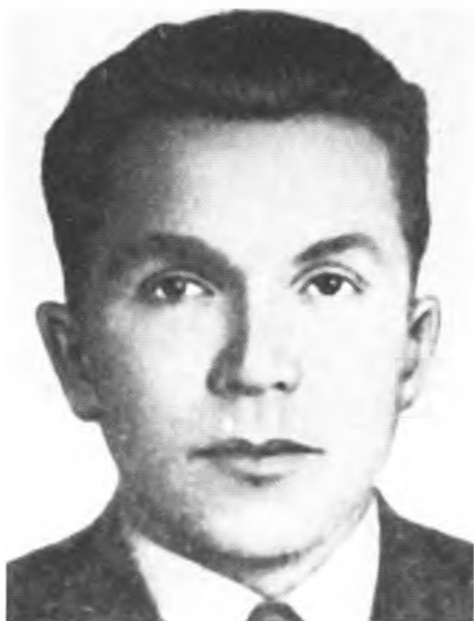
Знаменитый Н. И. Кузнецов, лик- видировавший многих руководи- телей немецкой администрации на Украине