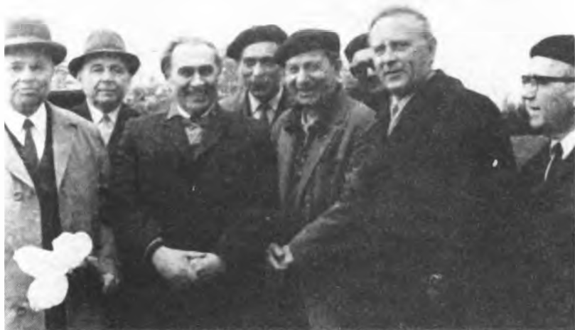
В годы войны спецоперации в основном проводило 4-е управление НКВД. Руководитель 4-го управления П. Судоплатов (третий слева) и его соратники