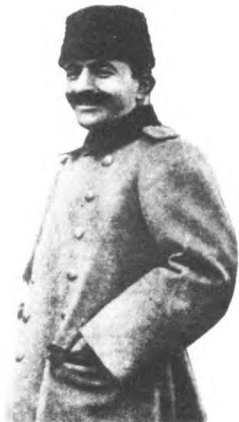
Турецкий авантюрист Энвер-паша, бывший военный министр Турции