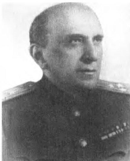
Я. И. Серебрянский – организатор похищения Кутепова, один из руководителей партизанского движения в годы войны