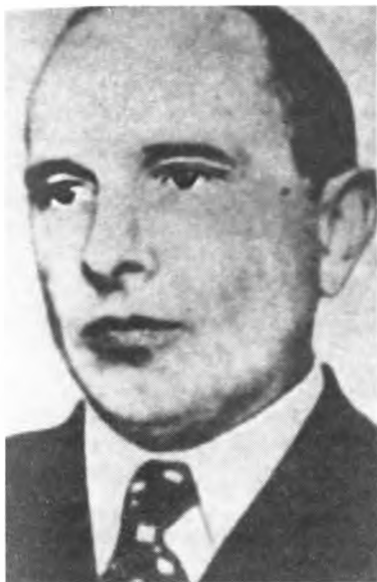
Лидер ОУН С. Бандера