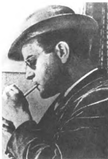
Убийца Троцкого Р. Меркадер