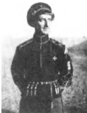
Командующий отдельной Семиреченской армией Б. В. Анненков