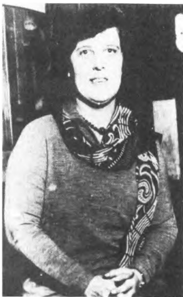
Бесследно исчезла в США порвавшая с советской разведкой Ж. С. Пойнтц