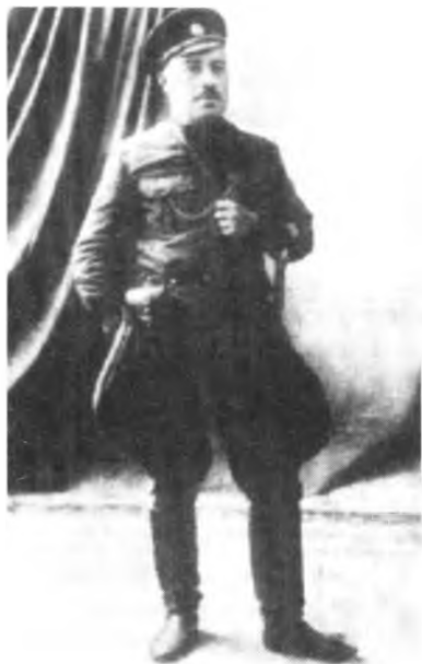
Атаман А. И. Дутов, генерал-лейтенант, атаман Оренбургского казачества