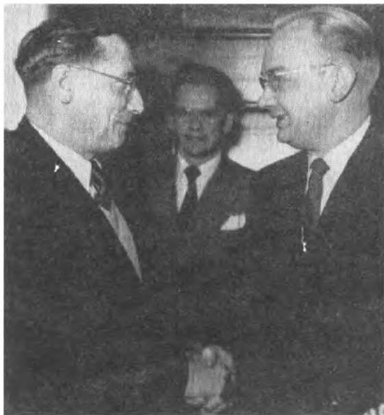
Николай Хохлов (слева) дает интервью после неудачного покушения на Околовича