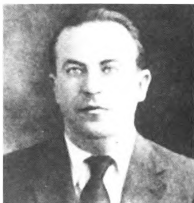
И. Рейсс (И. Порецкий) – советский разведчик, ставший невозвращенцем и убитый чекистами