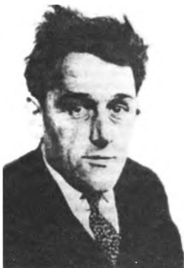
Вилли Мюнценберг, видный коммунист, порвавший со Сталиным. Его гибель до сих пор остается загадкой