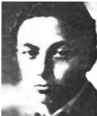
Секретарь Троцкого Рудольф Клемент