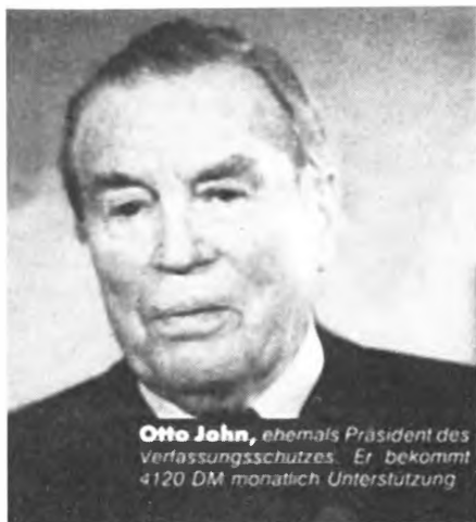
Otto John , ehemals Präsident des Verfassungsschutzes. Er bekommt 4120 DM monatlich Unterstützung

Отто Ион, руководитель западногерманской разведки, был «выведен» КГБ на территорию ГДР