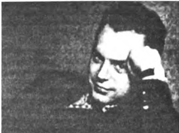
Сын Троцкого Лев Седов