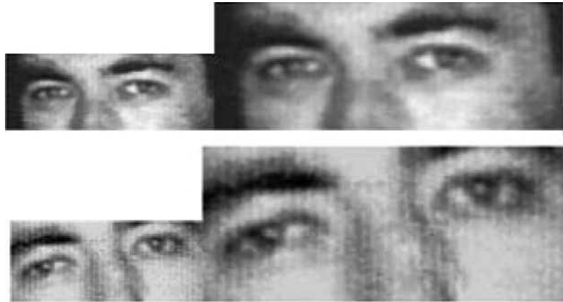
Глаза человека А.

а. 3. Эти отличия могут быть вызваны различными условиями освещения и/или степеней расслабленности человека А и человека В либо иными причинами. Поэтому я не могу прийти к заключению, что эти отличия являются определяющим доказательством того, что эти два человека не являются одним и тем же лицом.