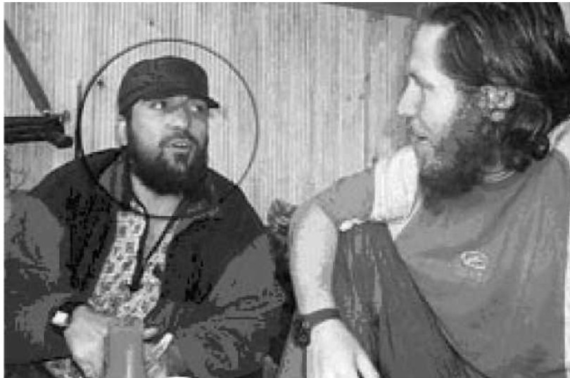
Фото человека, похожего на А. Гочияева.

7. Представляется, что между человеком А и человеком В имеются три отличия. Однако, поскольку эти отличия могут иметь приемлемые объяснения, то они являются недостаточными для исключения человека А. Тем не менее они бросают тень сомнения на утверждение о том, что человек А и человек В являются одним и тем же лицом. Эти отличия иллюстрируются ниже и сопровождаются моими комментариями.