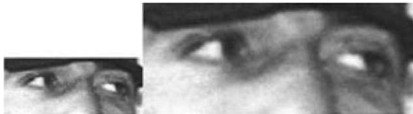
Глаза человека В.