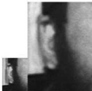
Ухо человека Б.