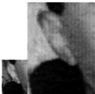
Ухо человека А.

б.2. Поэтому вновь эти очевидные отличия в строении уха сами по себе не являются определяющим доказательством того, что человек А и человек В не являются одним и тем же лицом