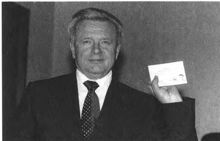
Февраль 2000 года. Губернатор Самарской области К. Титов зарегистрирован в качестве кандидата в президенты РФ