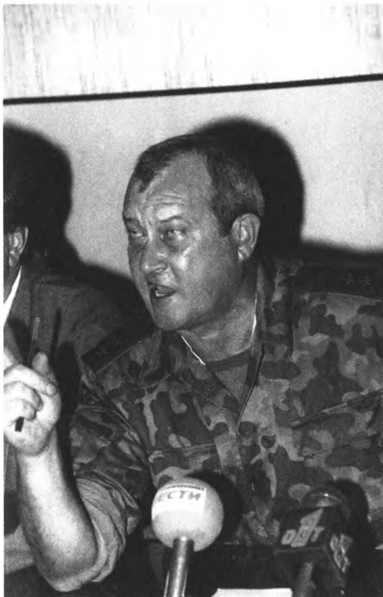
Один из руководителей федеральных войск в Чечне В. Пуликовский. В мае 2000 г. он был назначен представителем президента в Дальневосточном административном округе