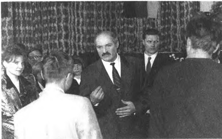
Президент Белоруссии А. Лукашенко посетил соседнюю Смоленскую область