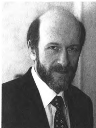
Руководитель президентской администрации А. Волошин