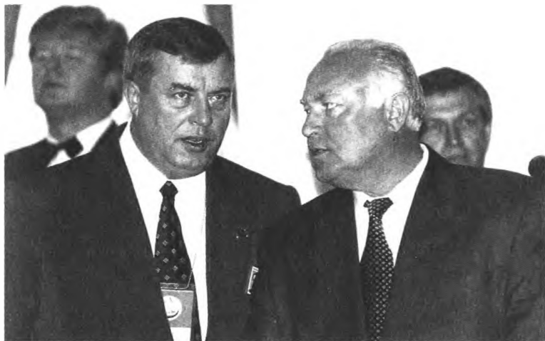
Председатель Госдумы Г. Селезнев и В. Черномырдин