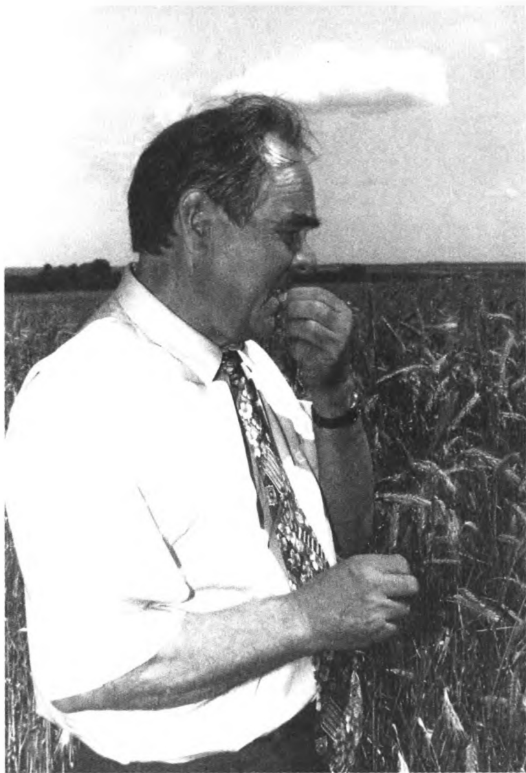
Президент Татарстана М. Шаймиев даже зерно сам пробует на зуб