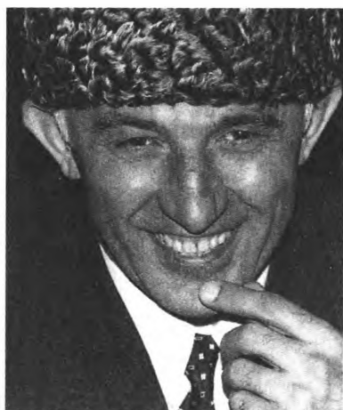
А. Масхадов — президент Чеченской Республики