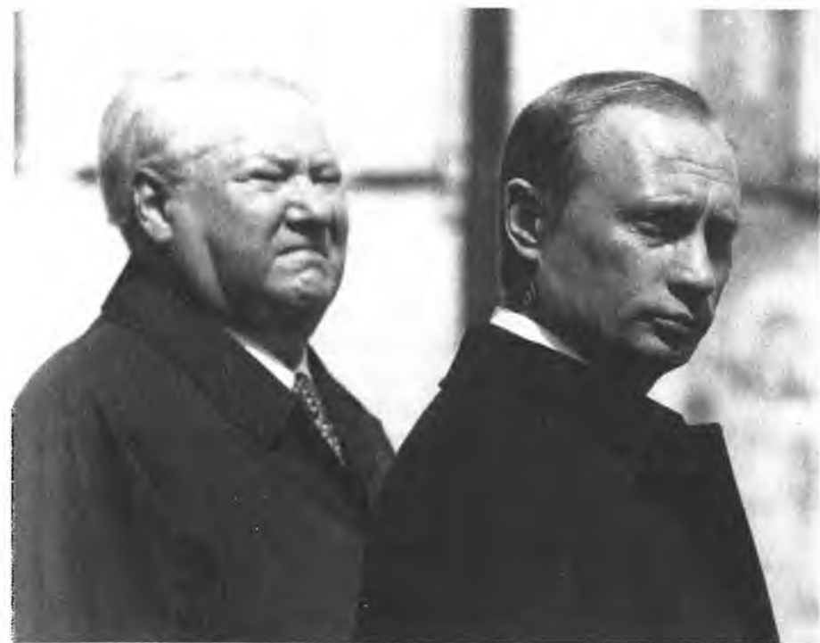
После инаугурации президента В. Путина. Первый и второй президенты России на Соборной площади Кремля