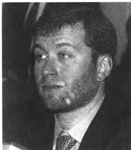
Депутат Р. Абрамович во время первого пленарного заседания Госдумы третьего созыва. Январь 2000 г.