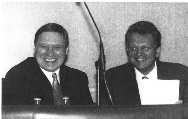
Премьер-министр правительства России М. Касьянов и вице-премьер В. Христенко