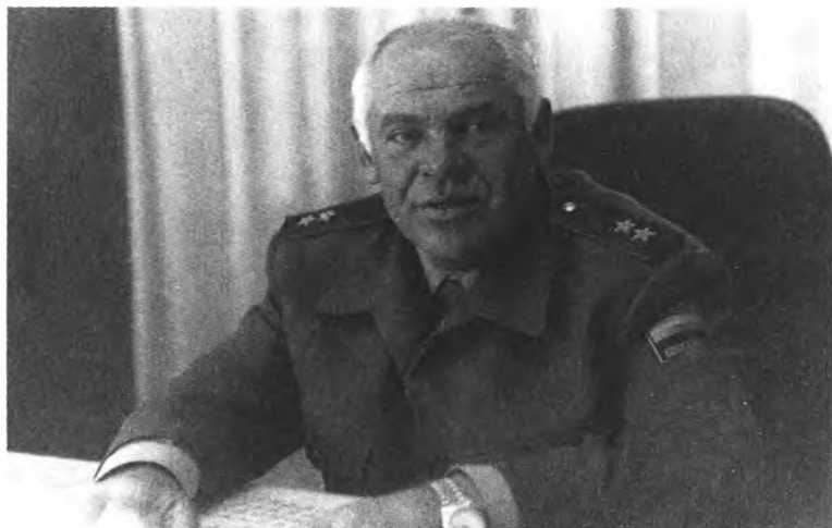
Один из руководителей антитеррористической операции в Чечне В. Казанцев. В мае 2000 г. генерал армии В. Казанцев стал представителем президента в Северо-Кавказском административном округе