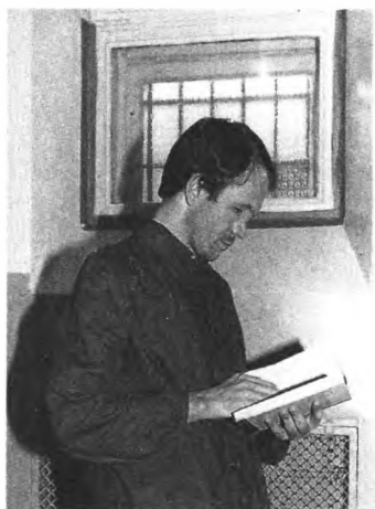
С. Радуев в следственном изоляторе «Лефортово»