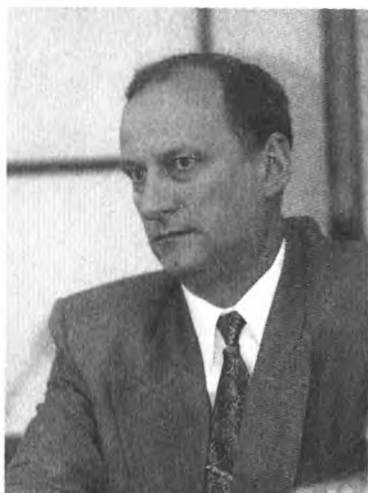
Директор ФСБ России генерал-полковник Н. Патрушев