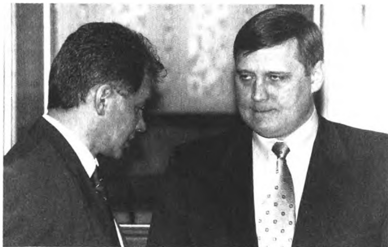
Перед заседанием правительства РФ. Вице-премьер С. Шойгу и министр финансов М. Касьянов