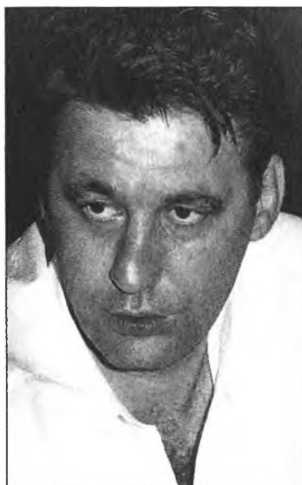
Экс-мэр г. Грозного Б. Гантамиров во время второй чеченской кампании действовал на стороне федеральной власти