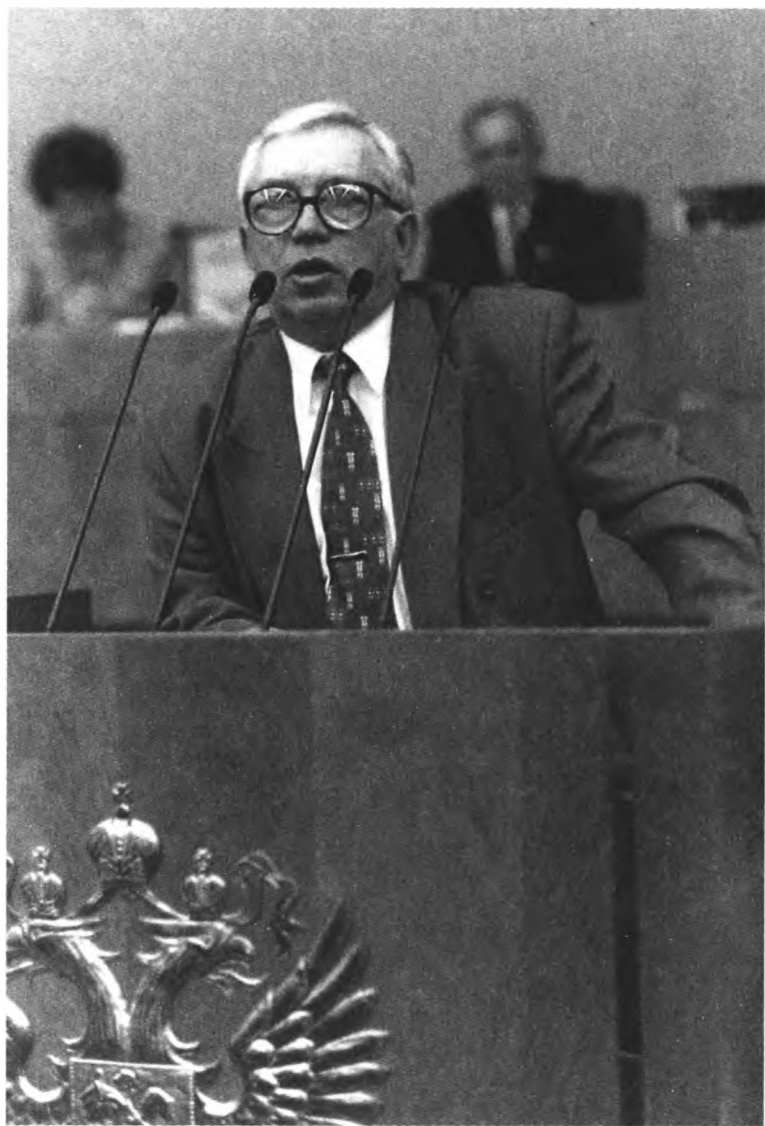
Вице-спикер Госдумы третьего созыва В. Лукин