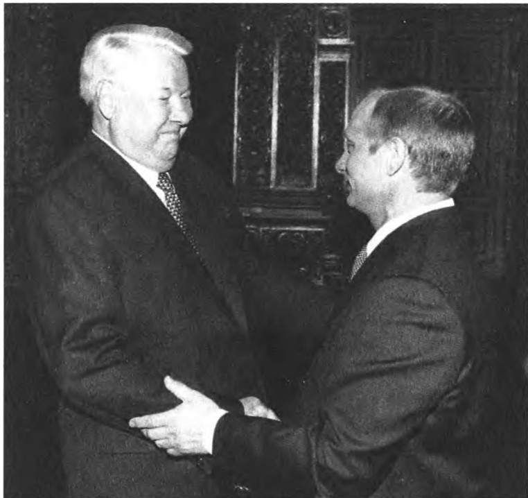
7 мая 2000 года. Б. Ельцин поздравляет В. Путина после его инаугурации в Андреевском зале Большого Кремлевского дворца