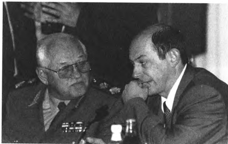
Министр обороны И. Сергеев и министр внутренних дел России В. Рушайло