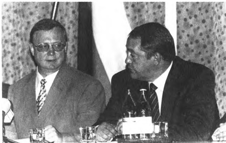
Июль 1999 года. Премьер-министр С. Степашин представляет главу нового министерства по делам печати М. Лесина