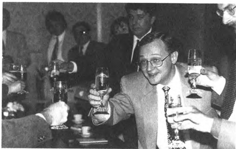
С. Кириенко после отставки встретился с журналистами