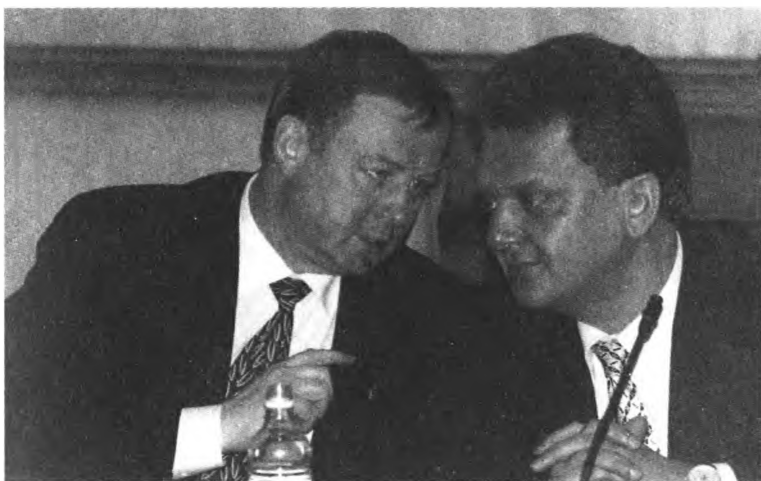
Премьер С. Степашин и первый вице-премьер правительства России В. Христенко