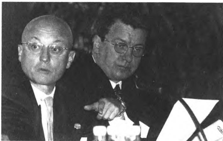
Заместитель директора Института Европы РАН С. Караганов (слева) и заместитель руководителя администрации президента РФ С. Приходько открывают ассамблею Совета по внешней и оборонной политике