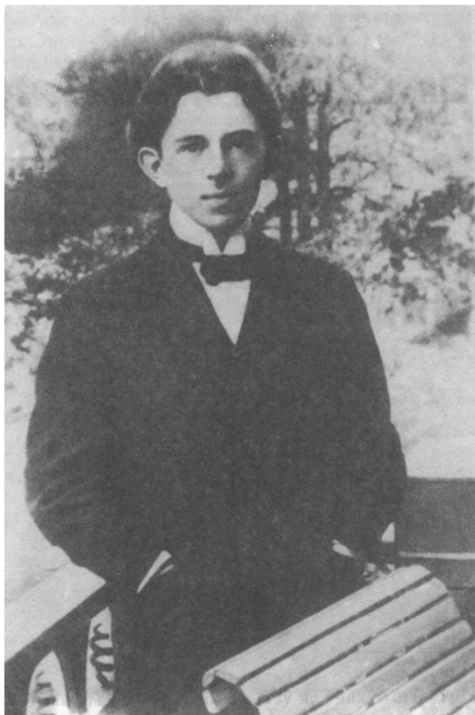
О. Э. Мандельштам. 1910 г.