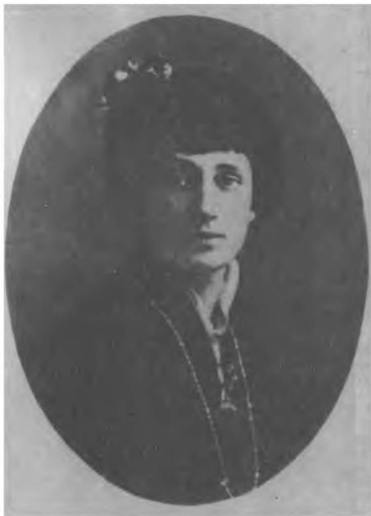
А. А. Ахматова. 1910-е годы.