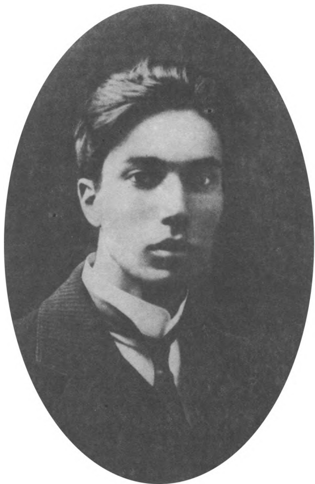
Б. Л. Пастернак. 1906 г.