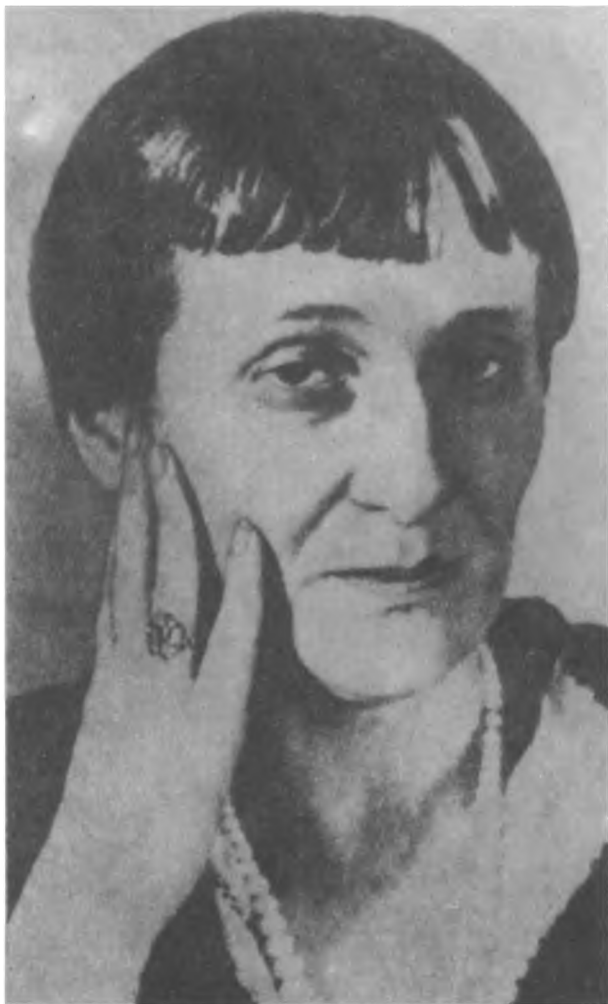
А. А. Ахматова. 1940 г.