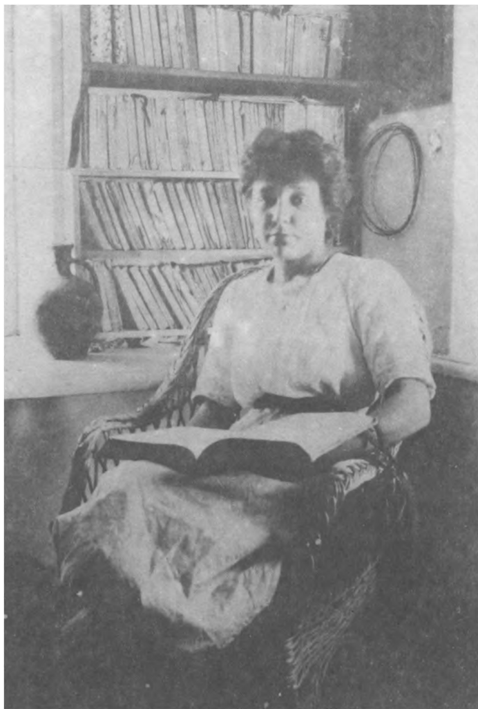
М. И. Цветаева. 1911 г.