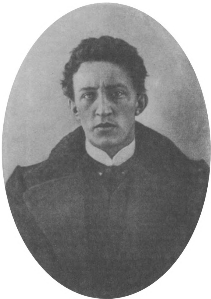
А. А. Блок. 1906 г.