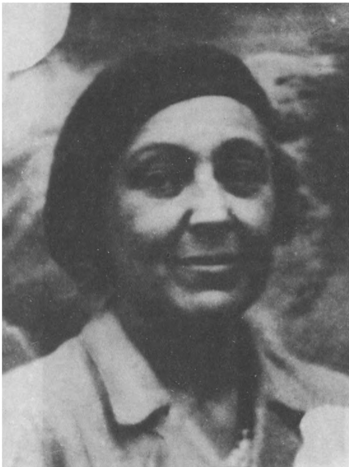
М. И. Цветаева. 1941 г.