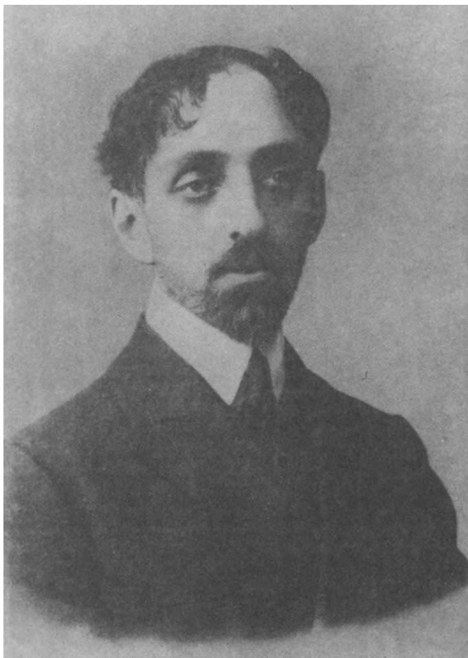
М. А. Кузмин. 1910-е годы.