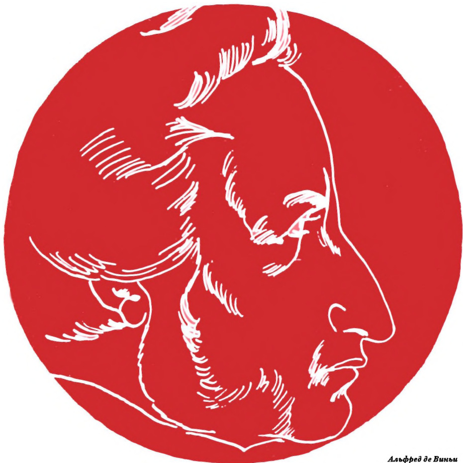
Альфред де Виньи

Среди славных фигур, украшающих этот портал 1 , должна быть отведена ниша и для Виньи. Я попытаюсь объяснить, почему он был одним из первых, кто в отроческие годы приобщил меня к литературе. Позднее, отталкиваемый какой-то его замкнутостью, смущаемый также «изъянами в этом металле», я стал