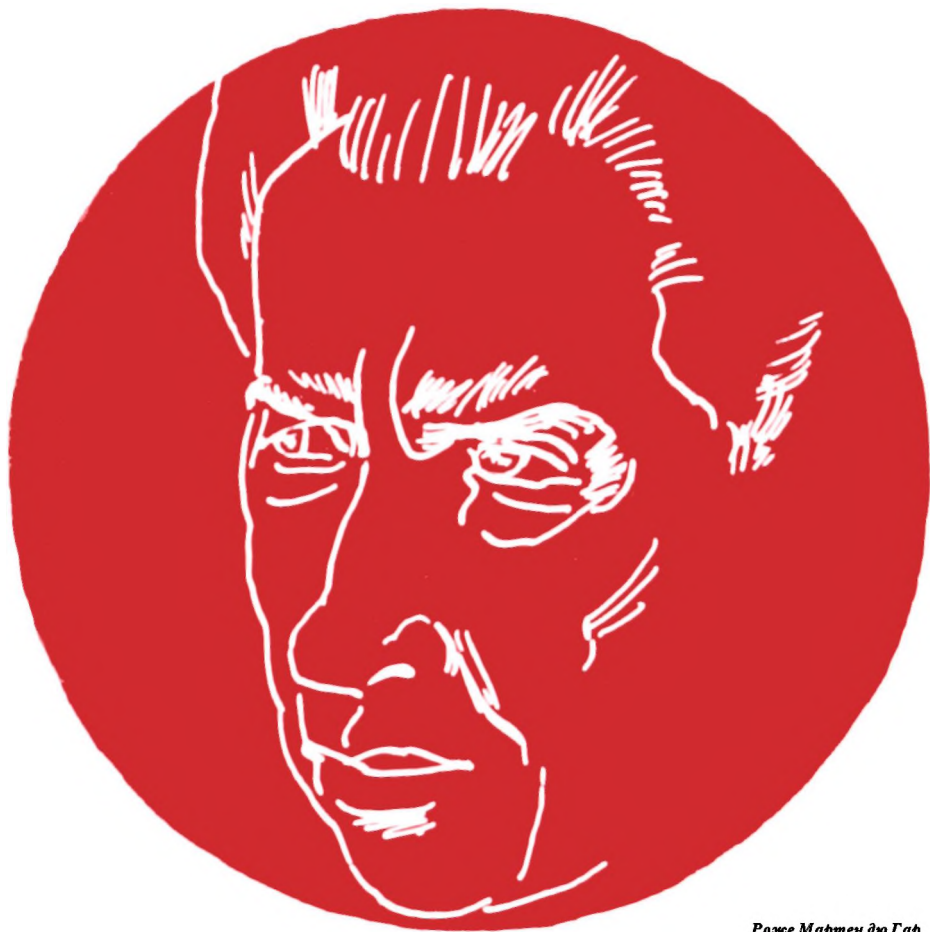
Роже Мартен дю Гар

* Статья дается с сокращениями. — Прим. ред.