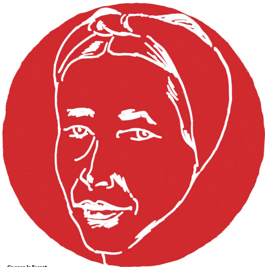
Симона де Бовуар

Имена Сартра и Симоны де Бовуар в сознании читателей неотделимы друг от друга. Похоже, это нравится обоим. Каждый из них счастлив, что живет рядом с человеком, которым восхищается. Их философии схожи. На протяжении многих лет они сопоставляли свои взгляды, анализировали,