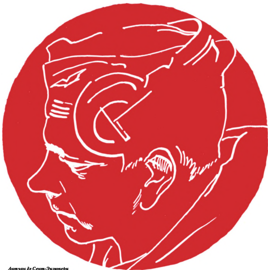
Антуан де Сент-Экзюпери

Авиатор, гражданский и военный летчик, эссеист и поэт, Антуан де Сент-Экзюпери вслед за Виньи, Стендалем, Вовенаргом, вместе с Мальро, Жюлем Руа 1 , а также несколькими солдатами и моряками принадлежит к числу немногих романистов и философов действия, которых породила наша страна. В отличие от