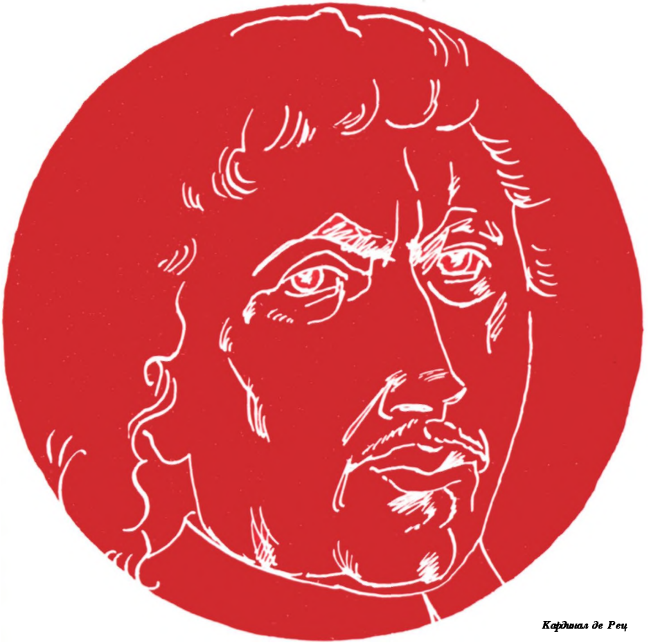
Кардинал де Рец

Жан-Франсуа-Поль де Гонди, в будущем кардинал де Рец, родился в сентябре 1613 года в великолепном замке Монмирайя в Шампани; украшенные газонами террасы замка выделяются над равниной, образованной в двадцати лье от Парижа рекой Пти-Морен, в которой в день рождения Жана-Франсуа