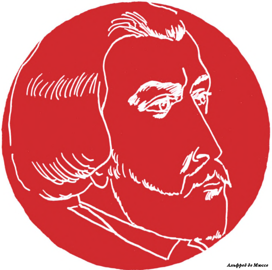
Альфред де Мюссе

Судьба театра Альфреда де Мюссе была необычной. В наши дни некоторые из его пьес считаются шедеврами французского театра. Современные режиссеры с удовольствием возобновляют их постановку. Актеры и актрисы оспаривают друг у друга роли в этих пьесах. Критики сравнивают комедии Мюссе с комедиями Мариво, Аристофана и Шекспира. И мы полагаем, что они правы.