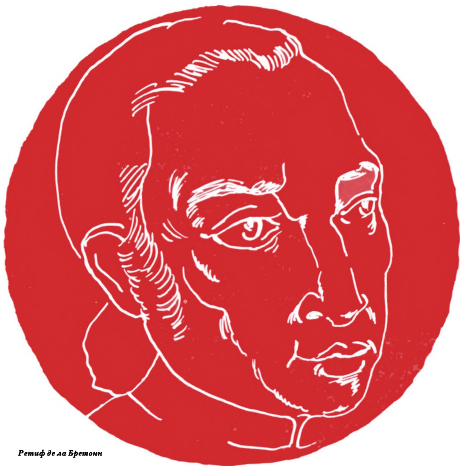
Ретиф де ла Бретонн

Заслуживает ли эта книга второго ряда того, чтобы стоять в первом, как считали Стендаль, изучавший по Ретифу нравы века, и Жерар де Нерваль 1 , говоривший: «Быть может, ни у одного писателя не развито до такой степени, как у Ретифа, ценнейшее качество – воображение». Поль Валери в 1934 году писал