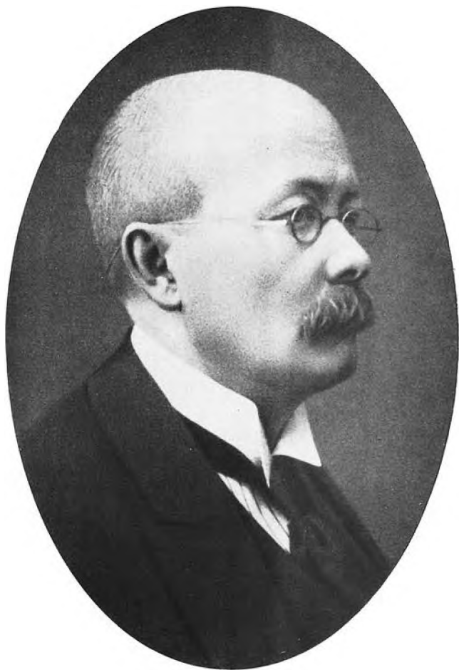
П. Д. Боборыкин 1890 г.