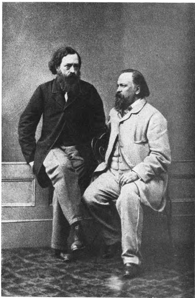
А. И. Герцен и Н. П. Огарев 1860 г.