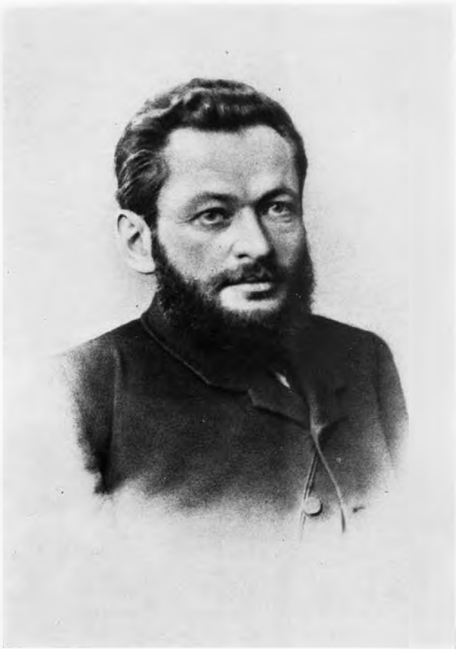
Вл. Бакст 1860-е гг.