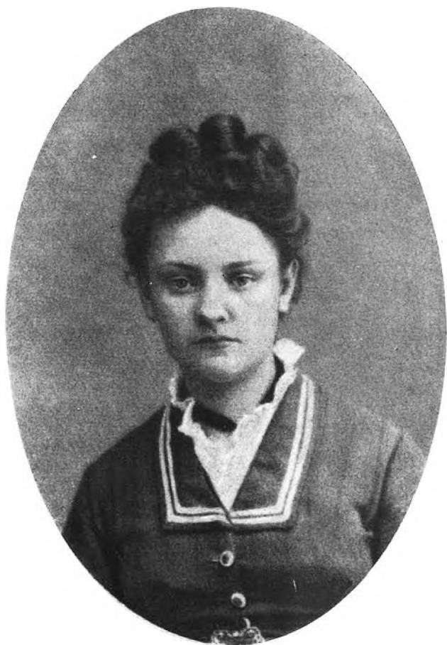
Лиза Огарева-Герцен 1870-е гг.