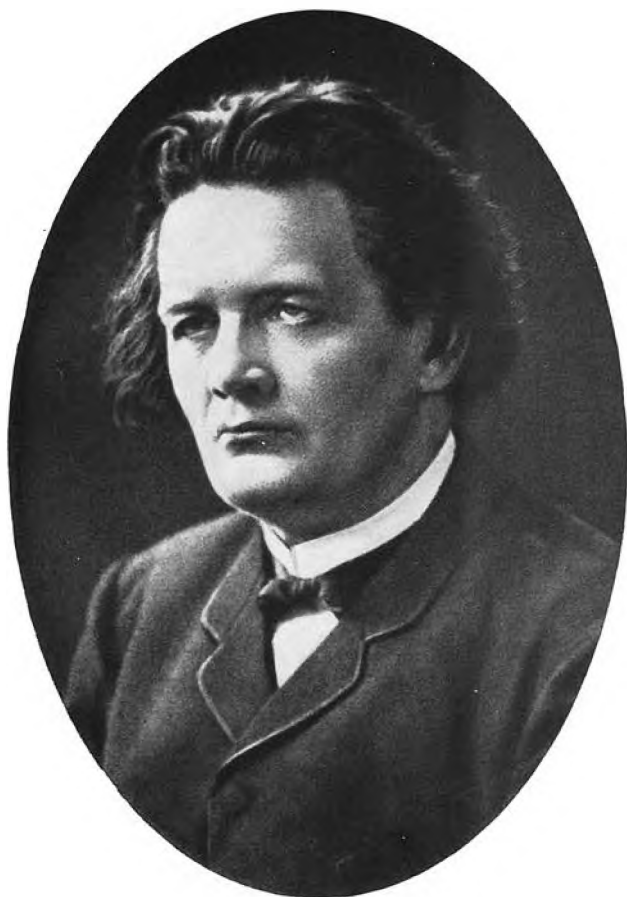
А. Г. Рубинштейн