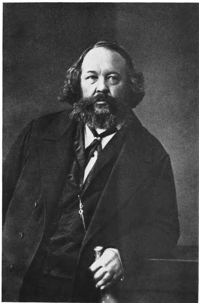
М. А. Бакунин 1860-е гг.