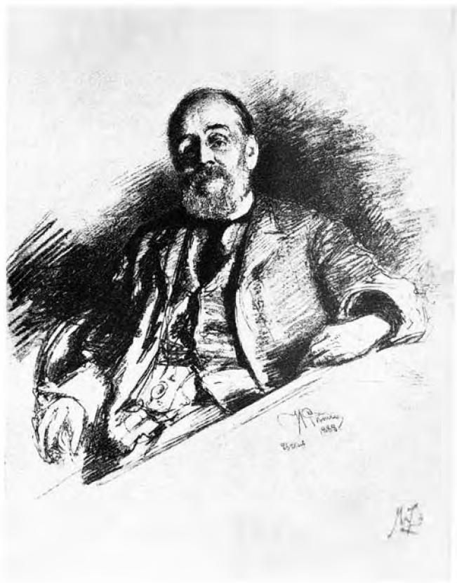
И. А. Гончаров 1888 г.