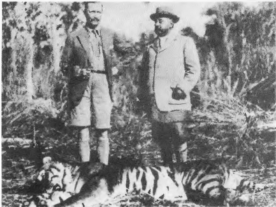
Маннергейм рядом с убитым им в Непале великолепным тигром. Февраль 1937 г.