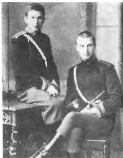
Кадет Маннергейм в кавалерийском училище.