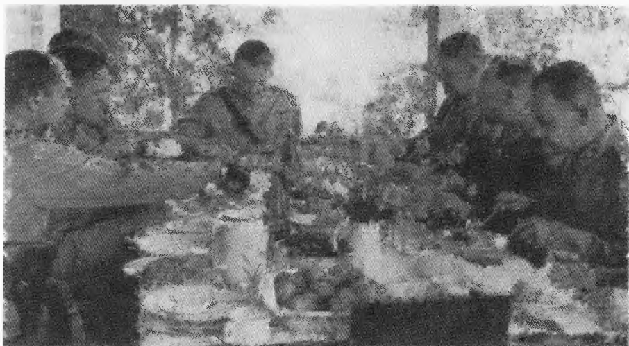
Застолья Маннергейма были широко известны. 1 августа 1941 г.