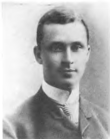
Маннергейм — выпускник лицея Гельсингфорса. 1887 г.