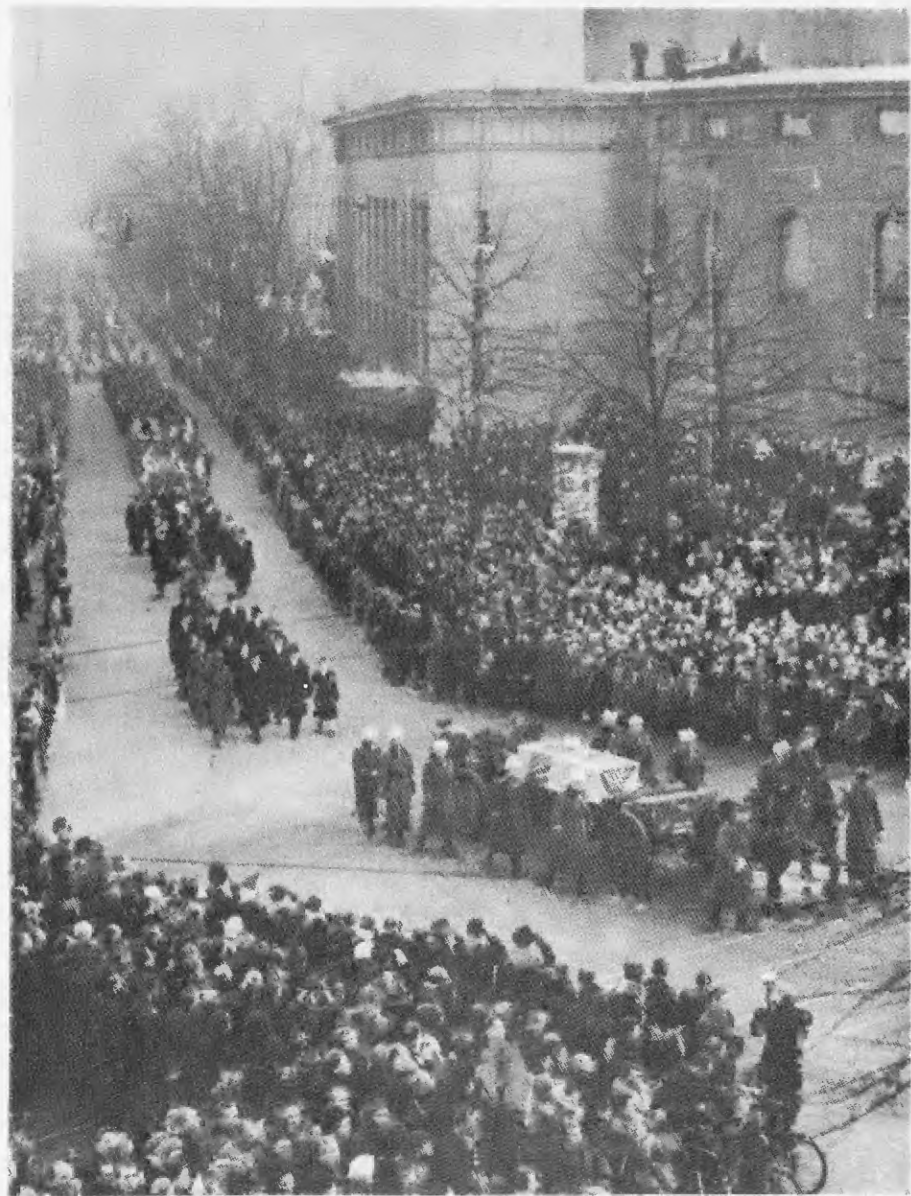
Похороны Маннергейма. Хельсинки, 4 февраля 1951 г.