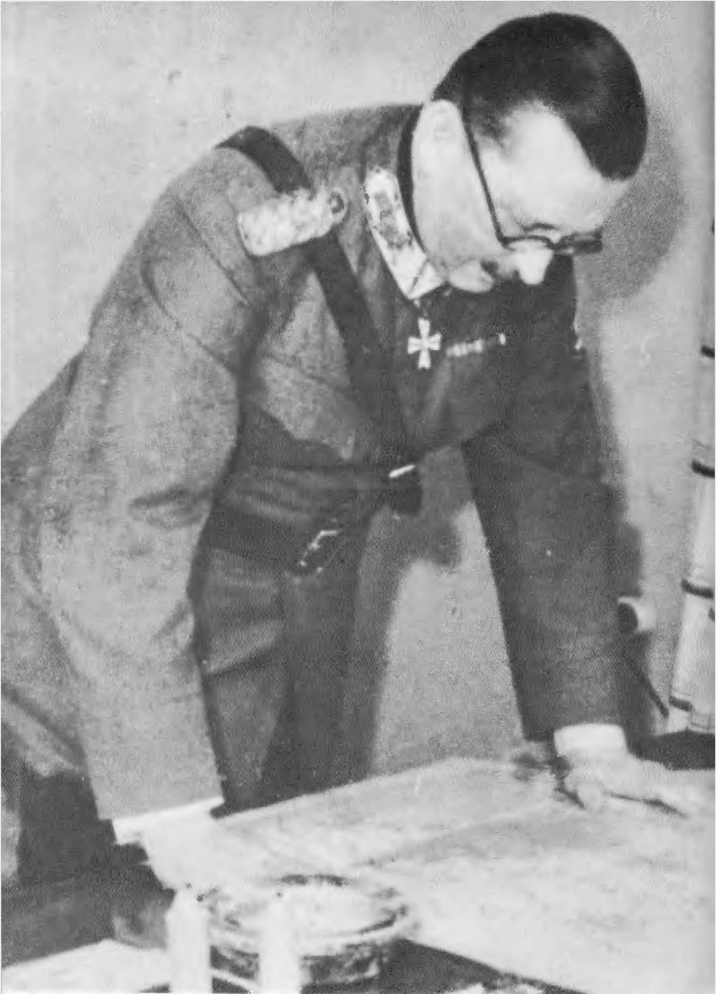
Маннергейм в своем рабочем кабинете в народной школе Отава. Январь 1940 г.