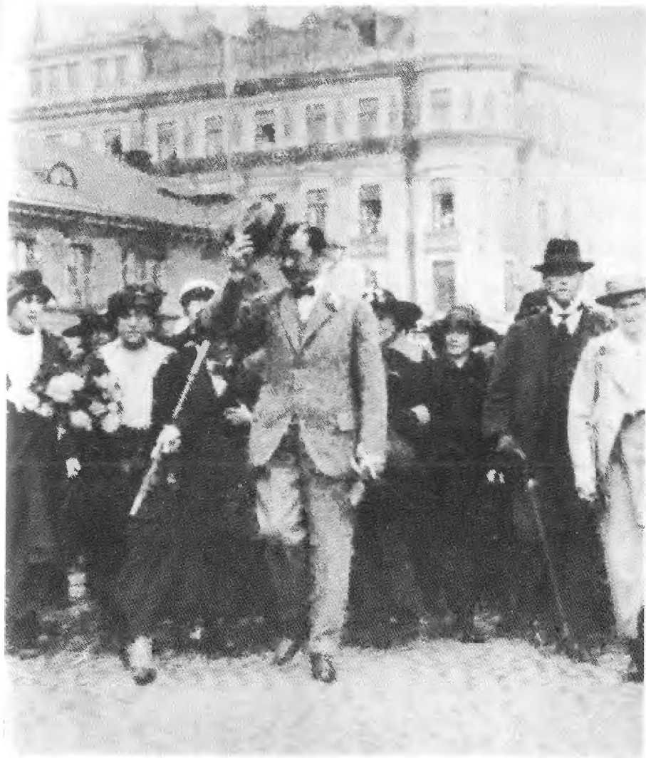
Маннергейм уезжает за границу. 17 сентября 1919 г.