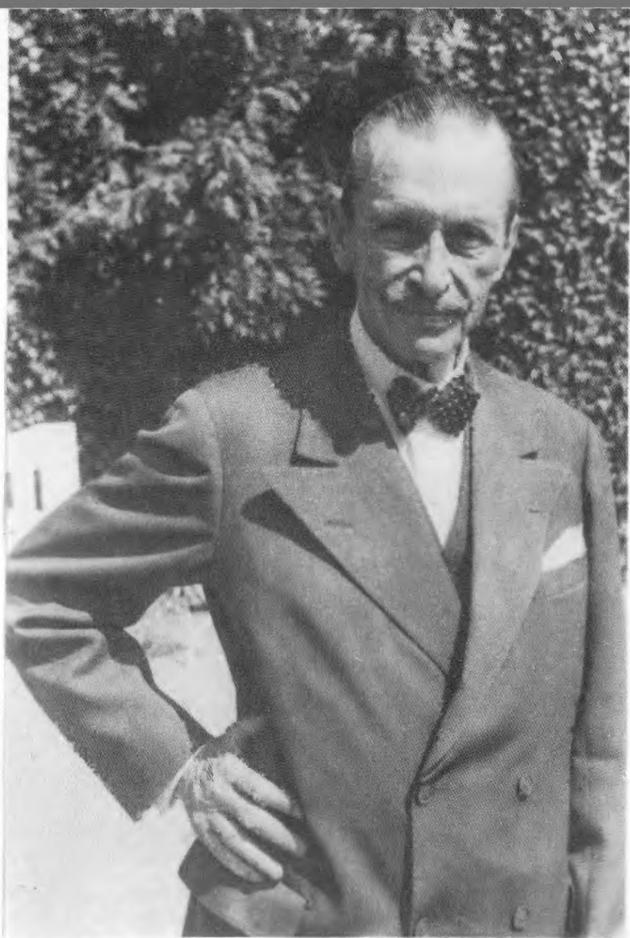
Маннергейм на девятом десятке жизни.