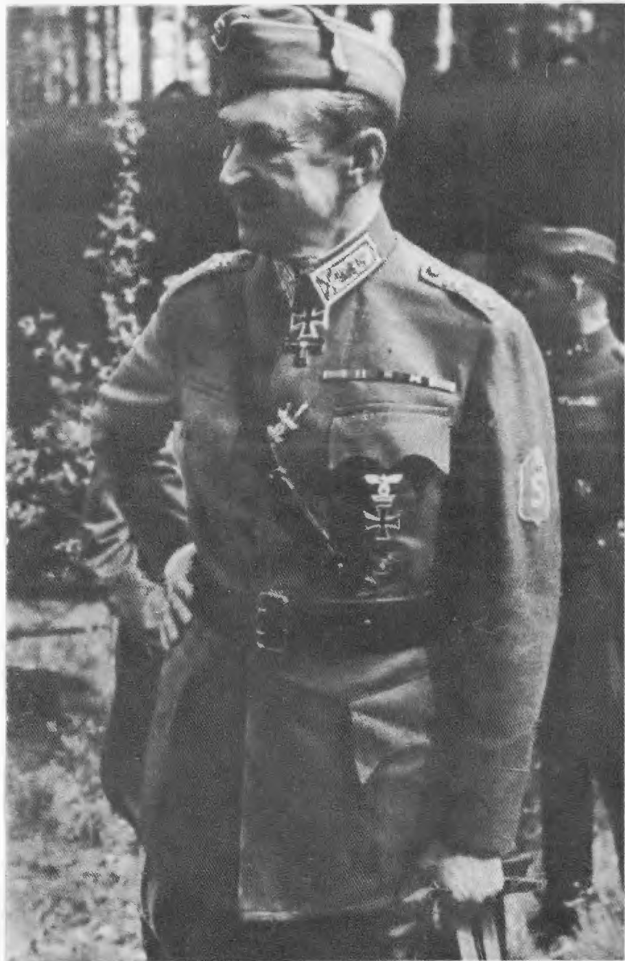
Фотография Маннергейма для немецкого журнала «Сигнал». 4 июня 1942 г.