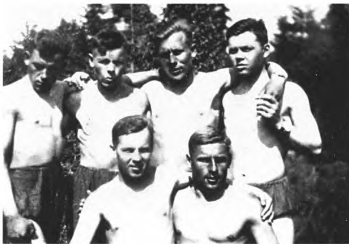
Летчики 55-го истребительного авиационного полка на отдыхе. Крайний справа вверху – Г.А. Речкалов. Кировоград, 1939 г.