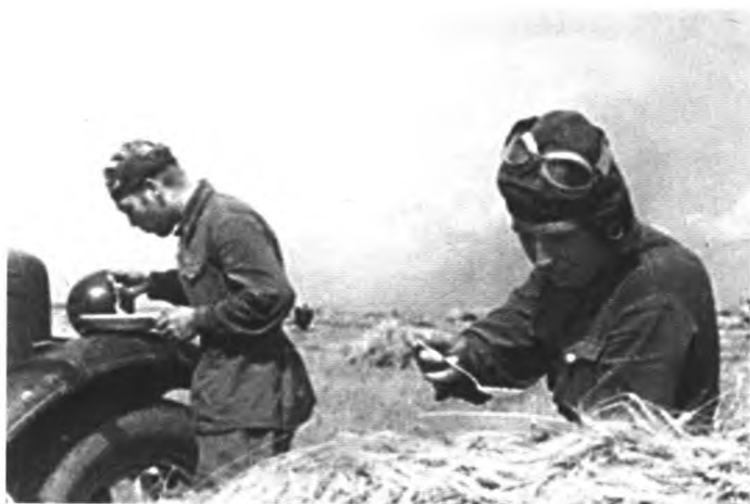
Краткий обеденный перерыв между боями. Июнь 1941 г.