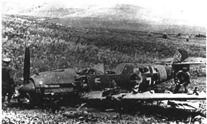
Разбитый немецкий истребитель «Мессершмитт» – результат боевой деятельности летчиков полка. Июнь 1941 г.