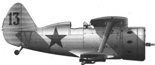
Истребитель И-153 «Чайка» Г.А. Речкалова (рисунок М. Быкова).