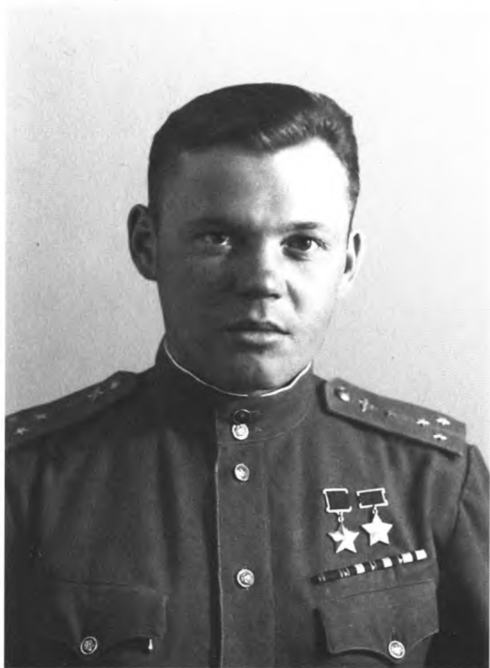
Дважды Герой Советского Союза капитан Г.А. Речкалов, летчик полка.