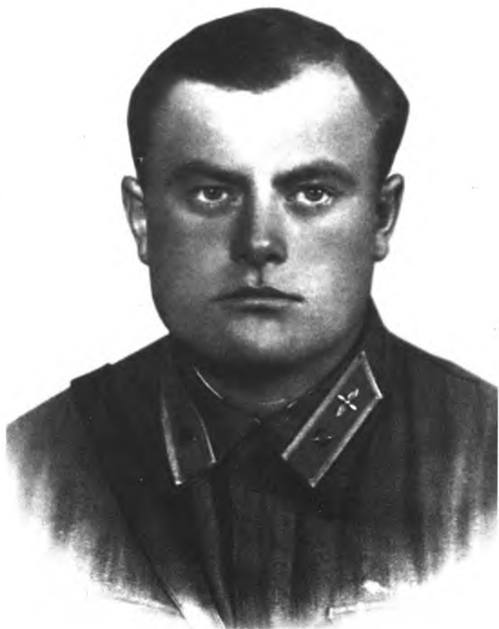
Летчик Александр Дмитриевич Гросул. 1941 г.