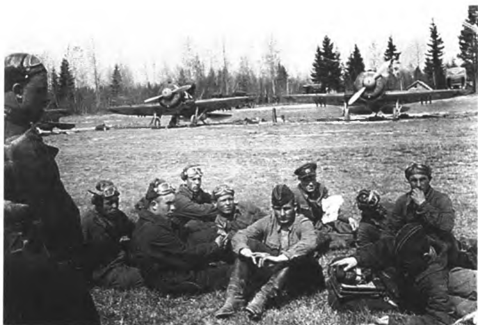
Летчики полка получают боевую задачу. Июнь 1941 г.