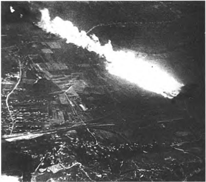
Горит сбитый немецкий бомбардировщик. 27 июня 1941 г.