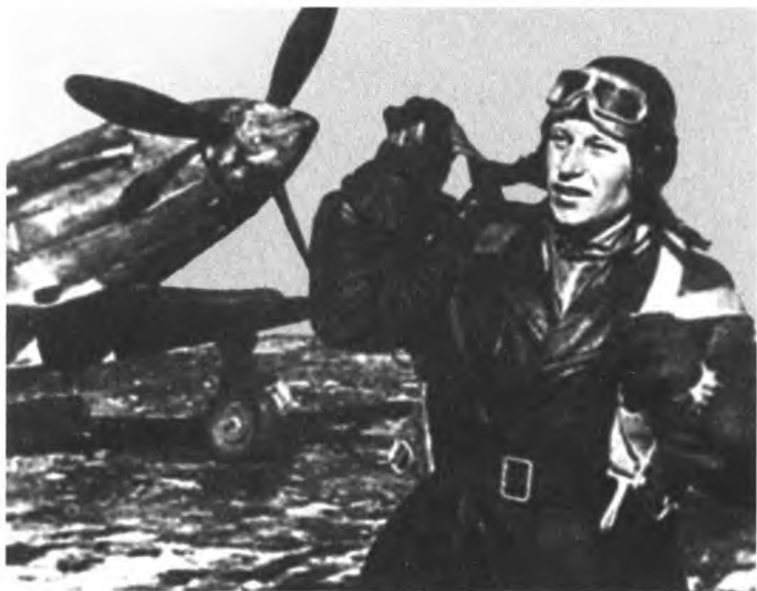
Летчик Александр Иванович Покрышкин, будущий командир полка. Весна 1942 г.