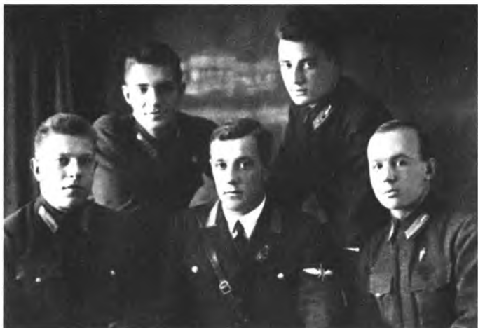
Сталинские соколы. В центре – летчик Степан Спиридонович Назаров.