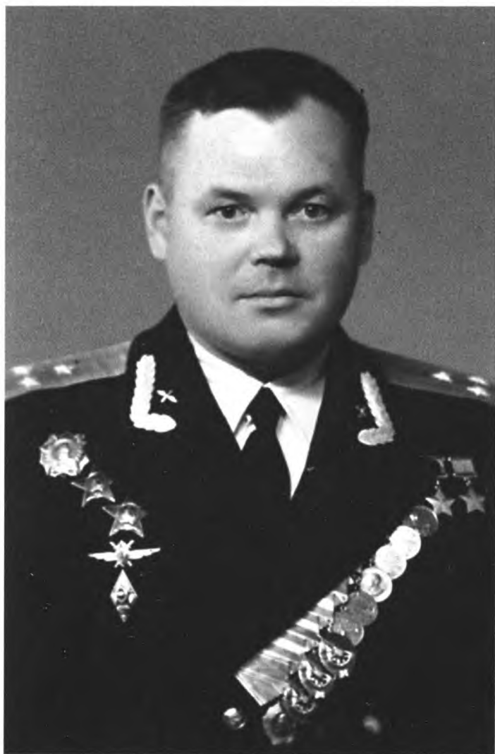
Дважды Герой Советского Союза полковник Г.А. Речкалов. 1958 г.