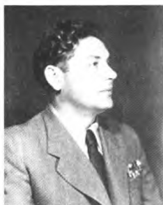
Дмитрий Трофимович Шепилов, назначенный Хрушевым министром иностранных дел, положил начало сближению Советского Союза с Арабским Востоком.