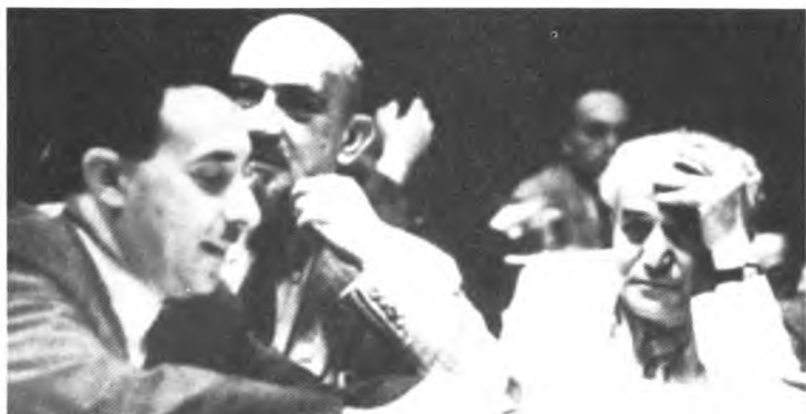
После ухода Бен-Гуриона ( справа ) в отставку Моше Шаретт стал премьер-министром.