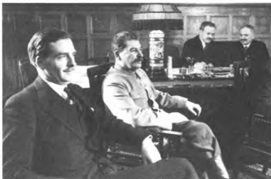
Британский премьер-министр Энтони Иден ( слева ), который когда-то приезжал в Москву и хорошо знал своих советских партнеров, начал войну на Ближнем Востоке в 1956 году.