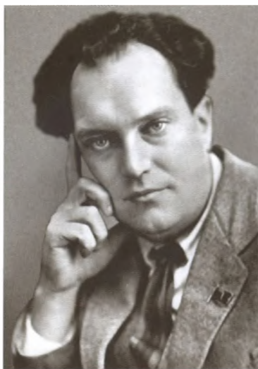
Валериан Владимирович Куйбышев