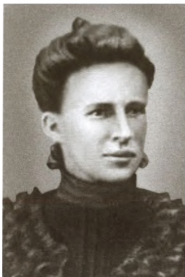
Елена Дмитриевна Стасова