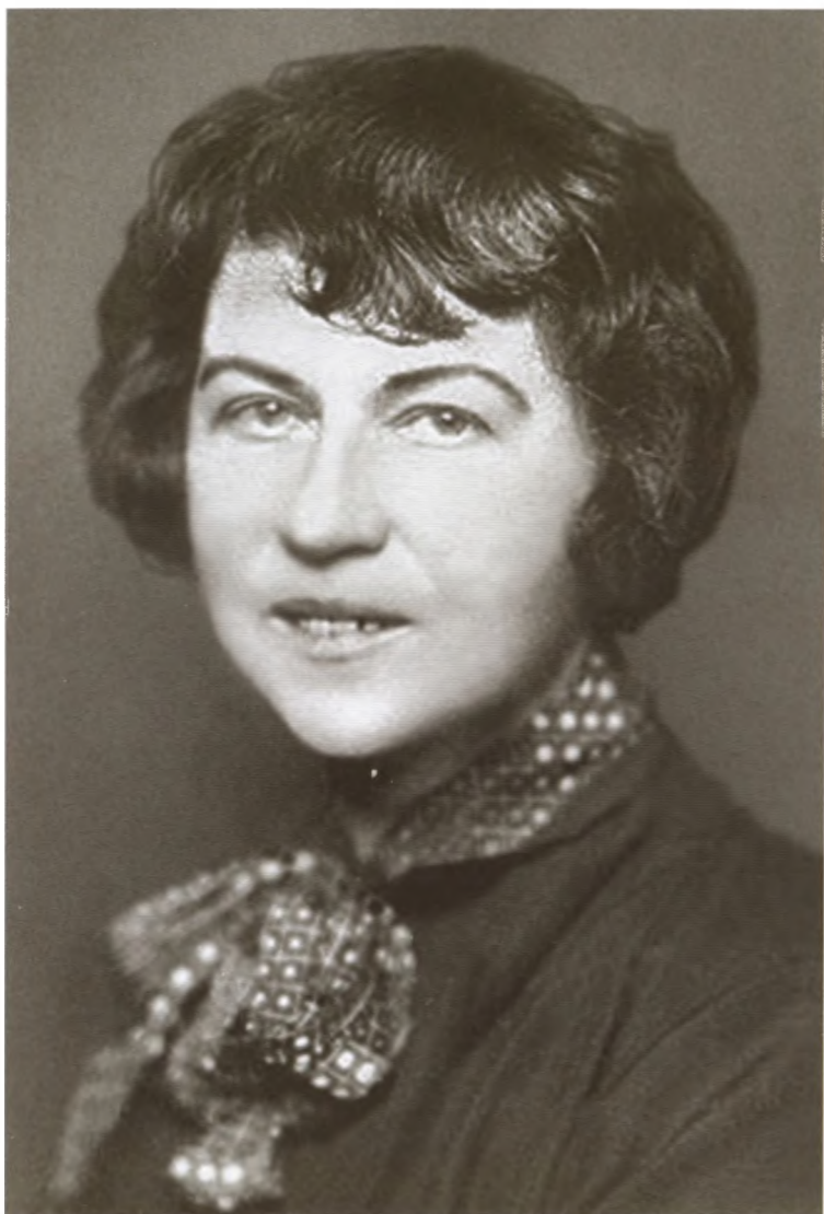
А. М. Коллонтай