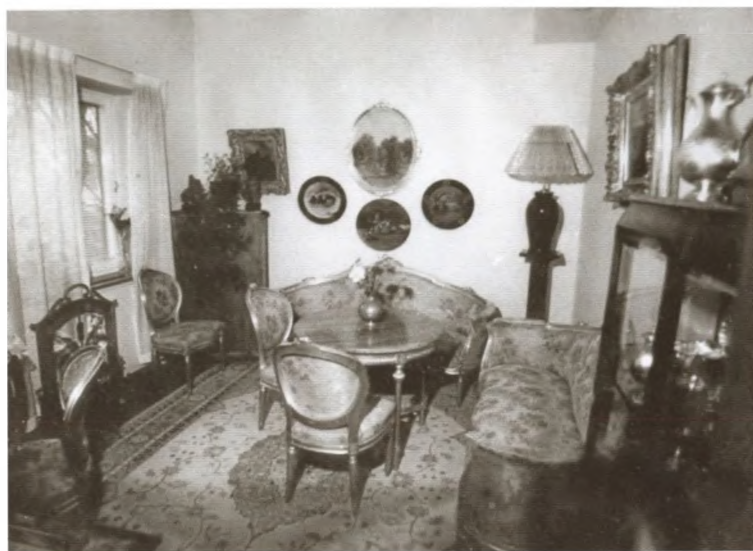
Мемориальная комната А. М. Коллонтай в посольстве СССР в Швеции. 1982 г.