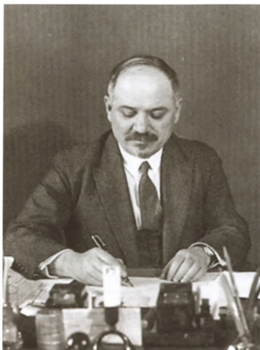
Иван Михайлович Майский