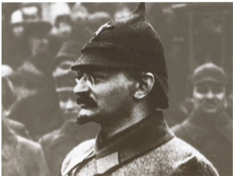
Лев Давидович Троцкий