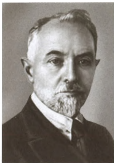
Леонид Борисович Красин