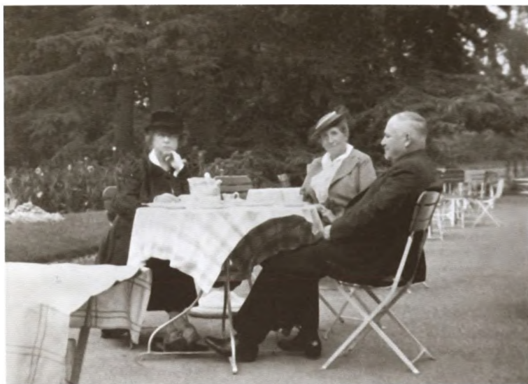
А. М. Коллонтай со знакомыми в кафе. Стокгольм