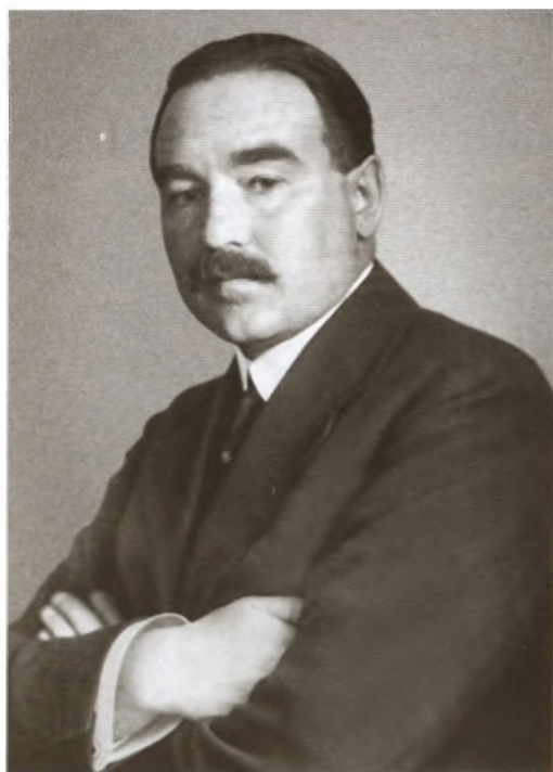
Александр Гаврилович Шляпников