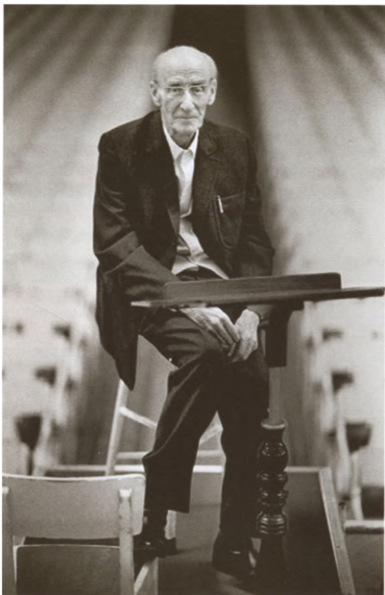
Евгений Александрович Мравинский