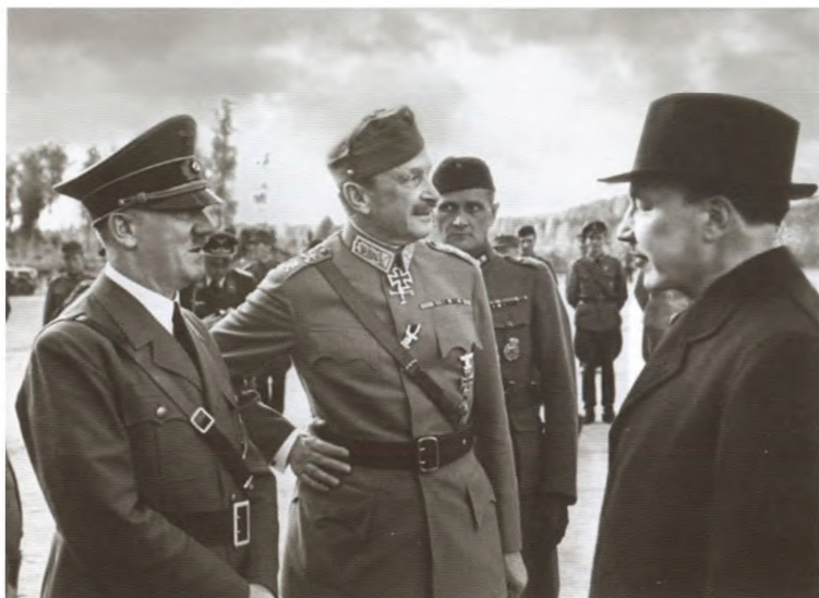
Адольф Гитлер и Карл Густав Эмиль Маннергейм (в центре)