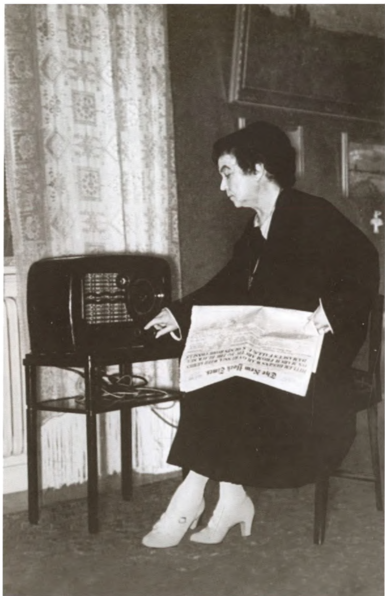
Коллонтай слушает радио