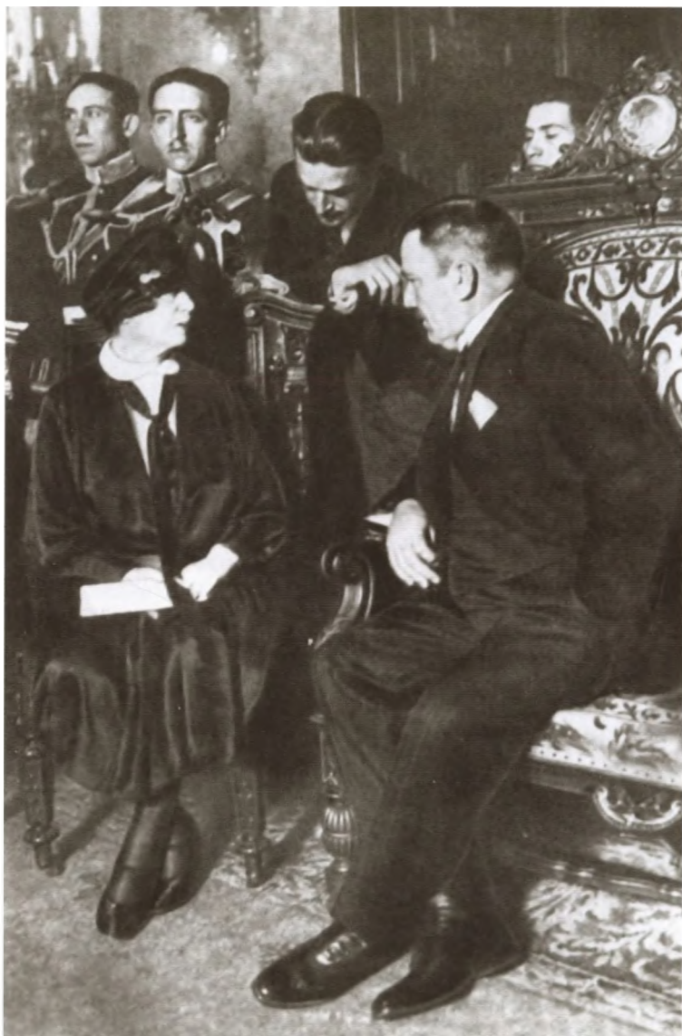
А. М. Коллонтай и президент Мексики Элиас Кальес после вручения верительных грамот. Мехико, 24 декабря 1926 г.