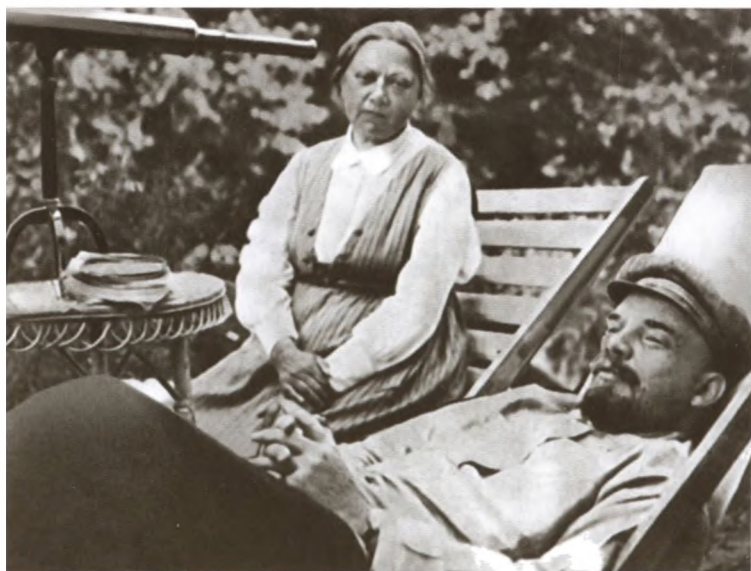
В. И. Ленин и Н. К. Крупская в Горках. 1922 г.