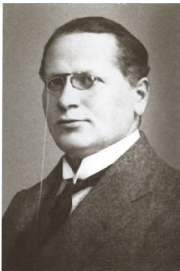
Максим Максимович Литвинов

Вячеслав Михайлович Молотов (в центре) с женой Полиной Жемчужиной (вторая справа) на дипломатическом приеме