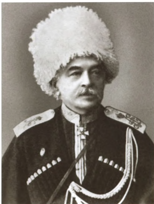
Михаил Иванович Драгомиров