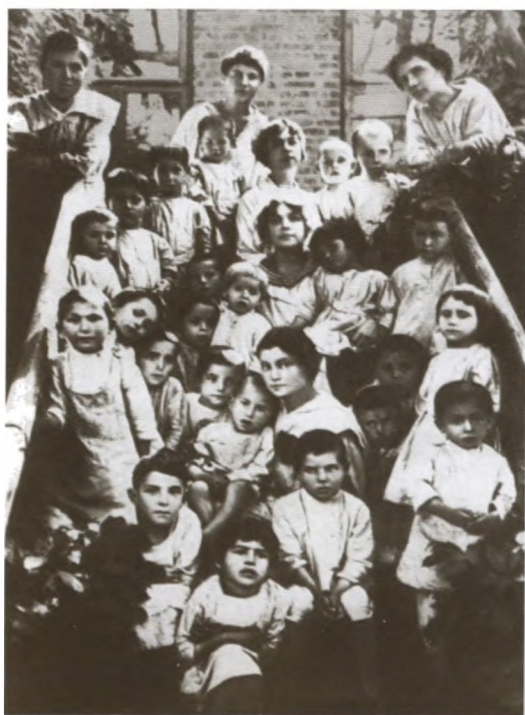
А. М. Коллонтай среди беспризорников. Начало 1918 г.