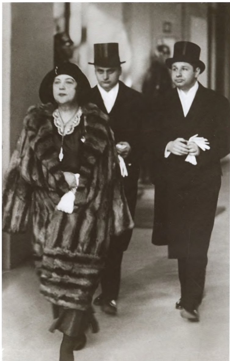
А. М. Коллонтай — чрезвычайный и полномочный посол СССР в Швеции