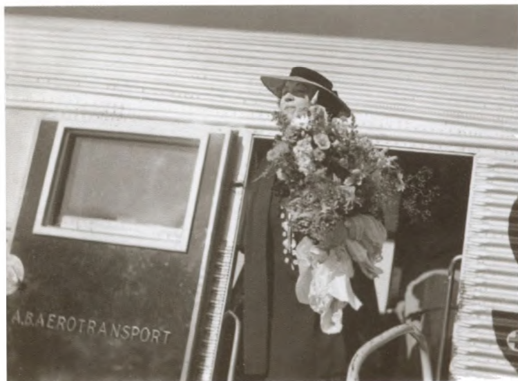
А. М. Коллонтай уезжает в Москву