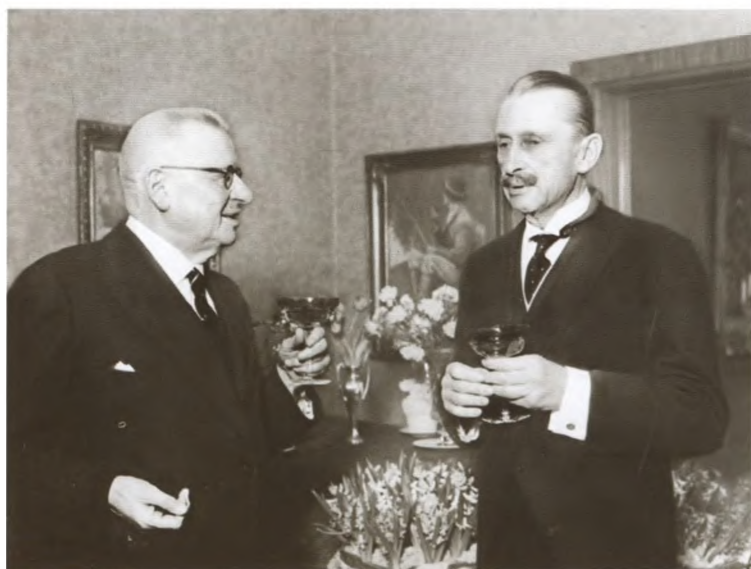
Юхо Кусти Паасикиви и Карл Густав Эмиль Маннергейм