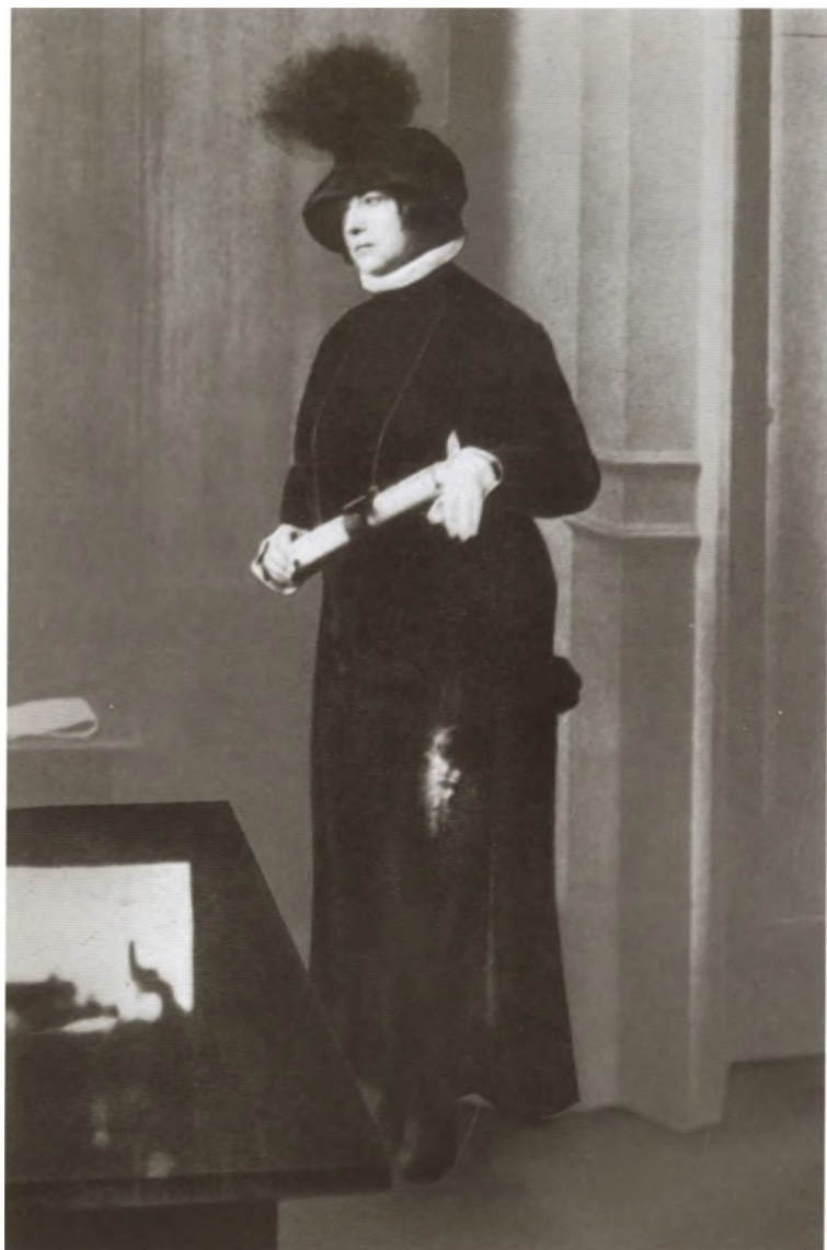
А. М. Коллонтай перед вручением верительных грамот королю Норвегии Хокону VII. Осло, сентябрь 1924 г.