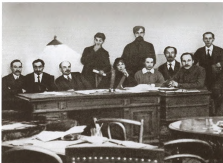
Заседание Совнаркома с участием В. И. Ленина. Пятая слева — А. М. Коллонтай. Петроград, 1918 г.