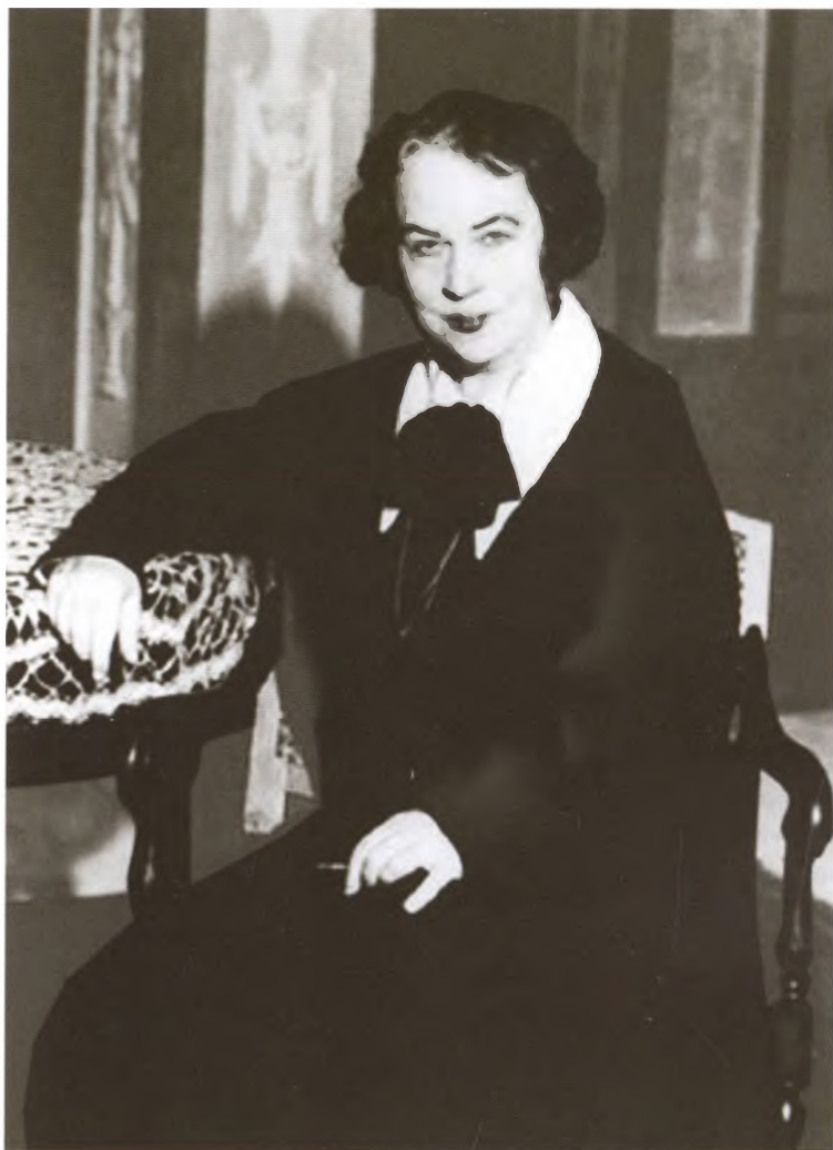
Александра Михайловна Коллонтай