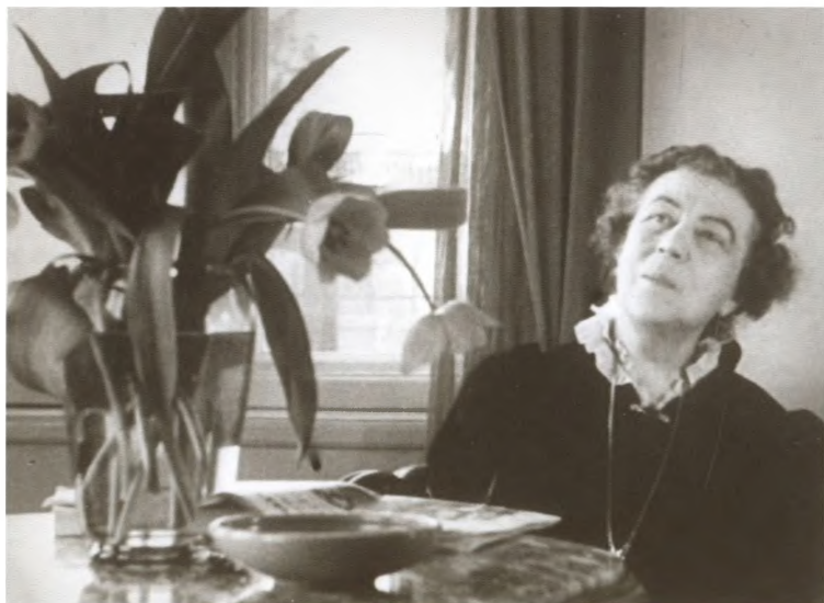
В рабочем кабинете. Стокгольм