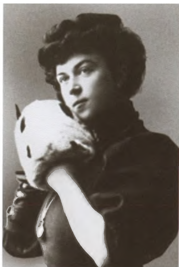
Александра Михайловна Коллонтай