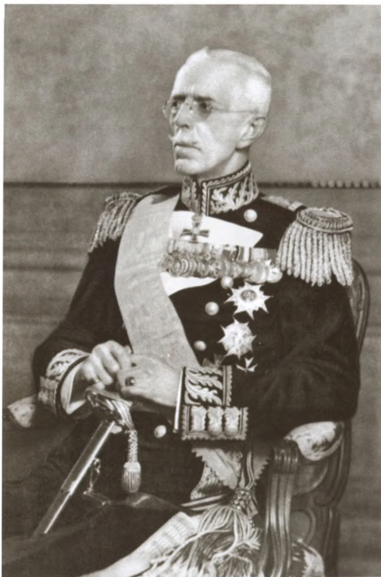
Король Швеции Густав V