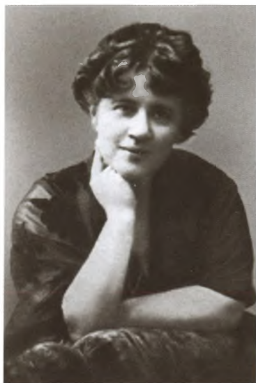
Татьяна Львовна Щепкина-Куперник