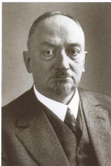
Георгий Васильевич Чичерин