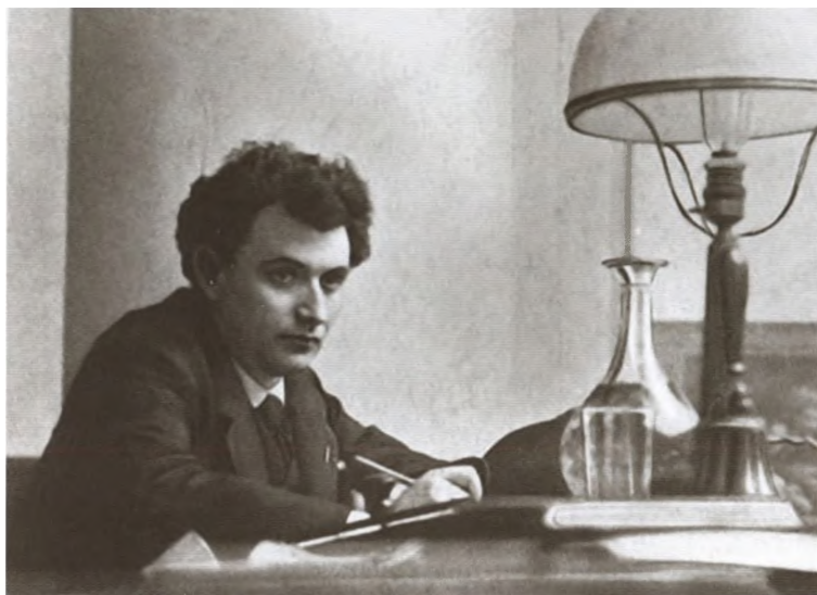
Григорий Евсеевич Зиновьев