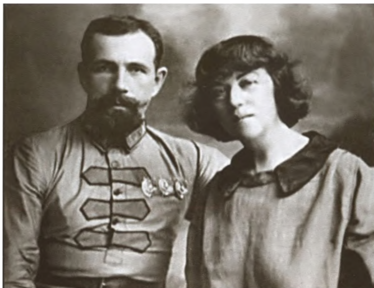
Павел Ефимович Дыбенко стал вторым мужем Александры Михайловны Коллонтай