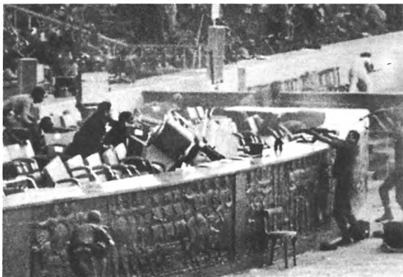
6 октября 1981 года. Египетского президента Анвара Садата, заключившего мир с Израилем, убили во время военного парада в Каире