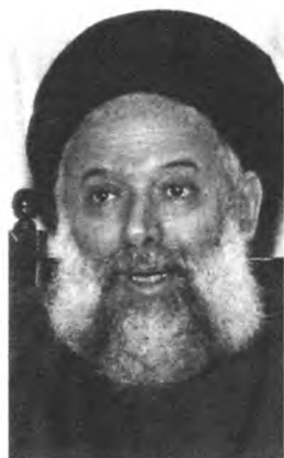
Самым опасным противником израильских спецслужб в Ливане стала шиитская организация Хезболла. Ее духовный лидер – Сейед Мухаммед Хусейн шейх Фадлалла