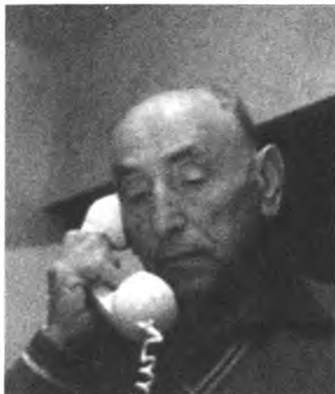
Основал Моссад подпольщик со стажем Иссер Харел, который родился в Витебске