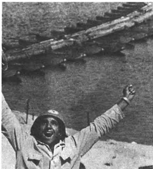
Октябрь 1973 года. Египетские войска форсировали Суэцкий канал. Ошибка разведки едва не погубила еврейское государство