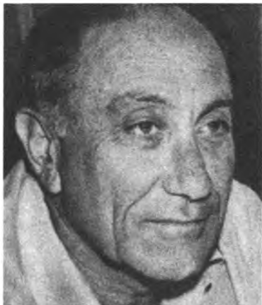
Руководитель Моссад Меир Амит был одним из тех, кто обеспечивал победу Израиля в шестидневной войне 1967 года. Амит был двоюродным братом известного советского поэта Бориса Слуцкого