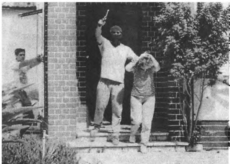
Израильские спецслужбы проводят тренировку по борьбе с захватом заложников