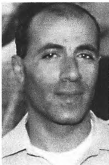
Мордехай Вануну, бывший техник ядерного центра в Димоне (фото сверху), покинув страну, рассказал, что Израиль создал ядерное оружие. Моссад насильно вернула его в Израиль, и Вануну предстал перед судом