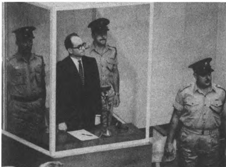
Оперативники Моссад нашли бежавшего в Аргентину военного преступника эсэсовца Адольфа Эйхмана и вывезли его в Израиль, где он в 1961 году предстал перед судом