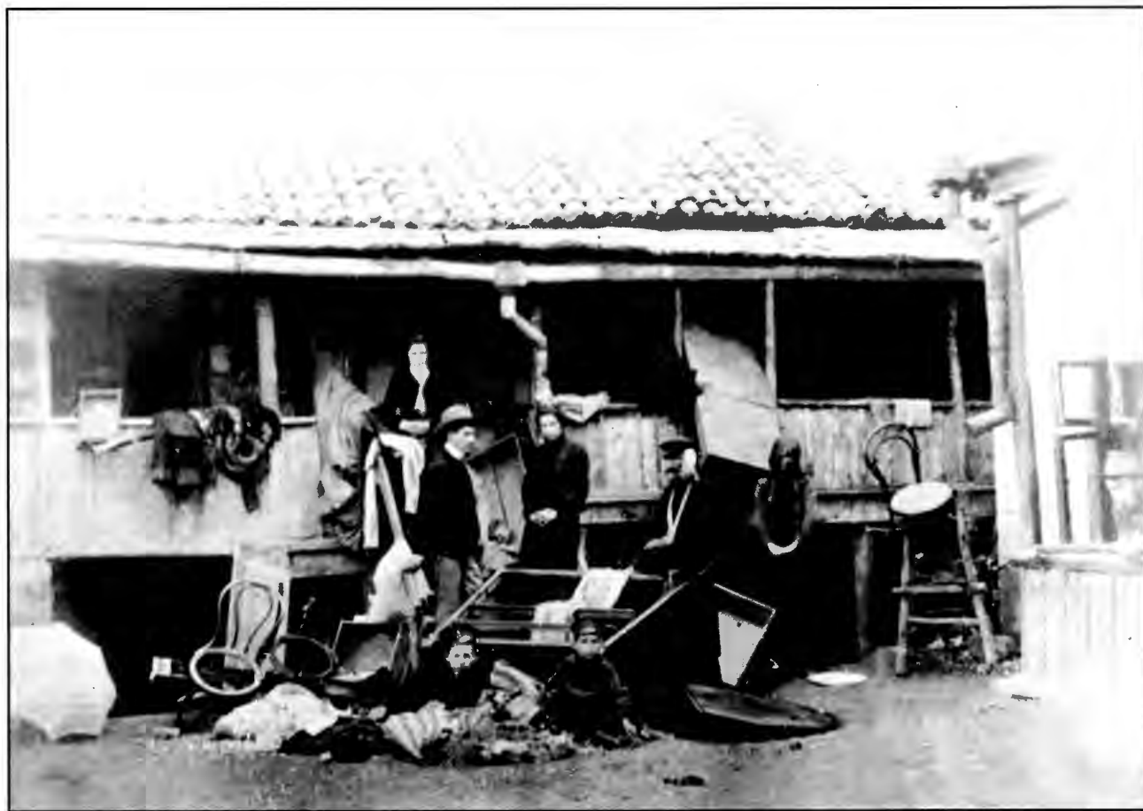
На ул. Кагульской