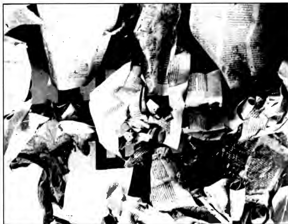
Оскверненные свитки Торы