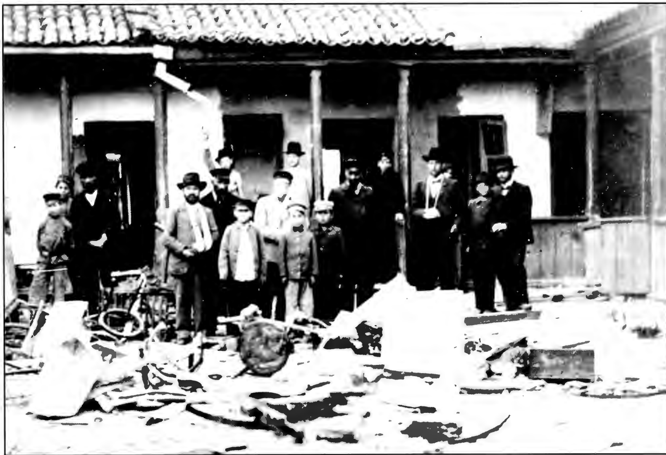
У разгромленного дома