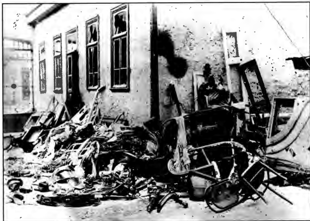
Разгромленный дом Олидорта на ул. Рениской