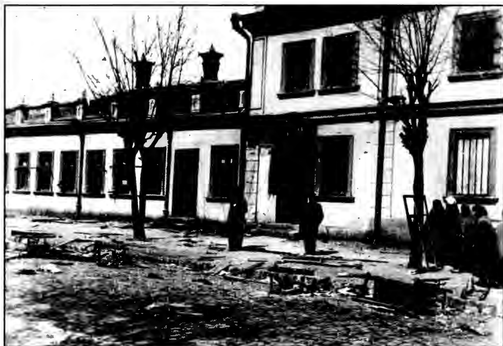
Разгромленные дома Мильмана на ул. Гостинной