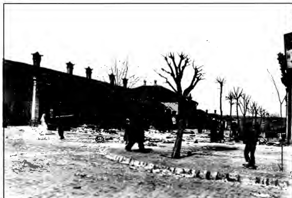
На ул. Свечной