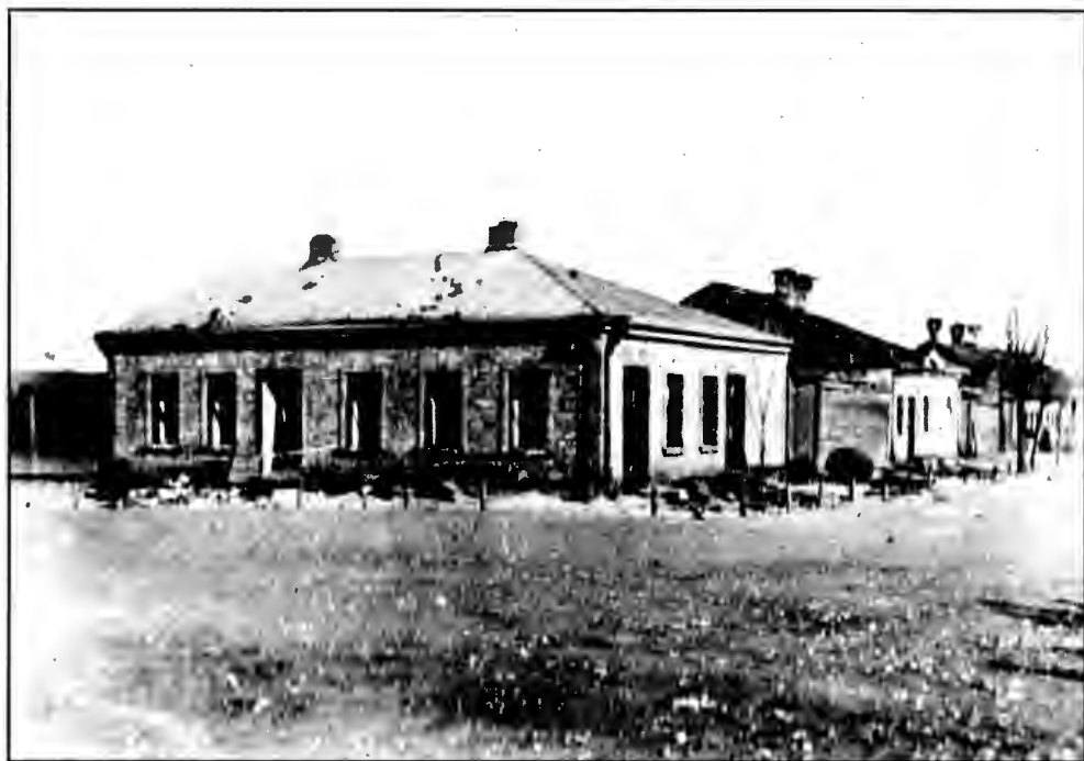
На ул. Килийской