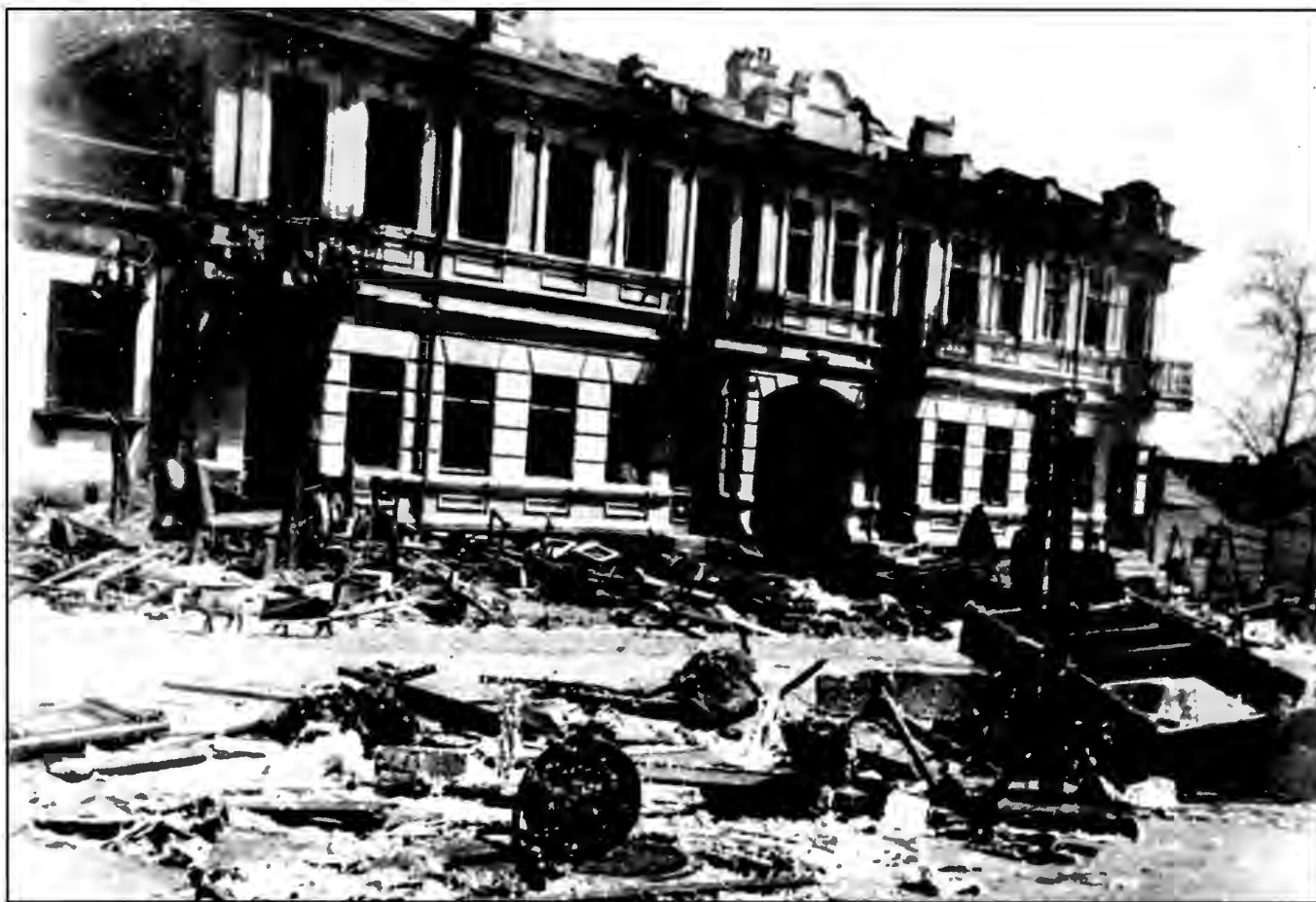
Разгромленный дом Мундера на ул. Николаевской