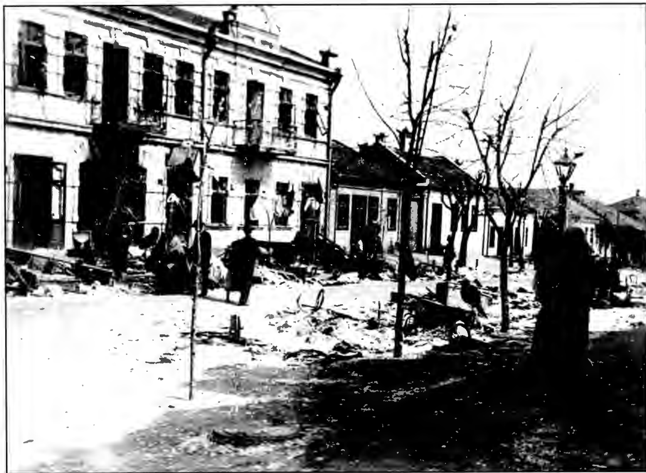
Общий вид ул. Николаевской