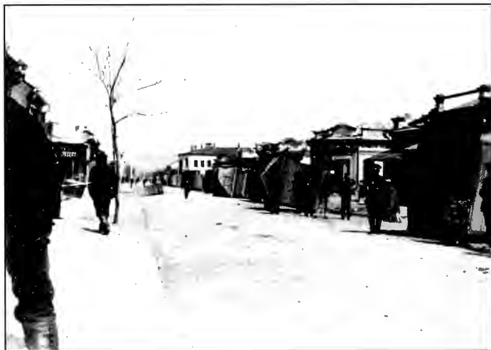
Разгромленные деревянные лавки Нового базара на ул. Болгарской