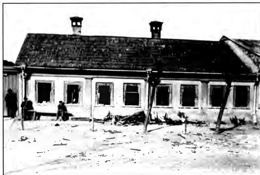
На ул. Подольской