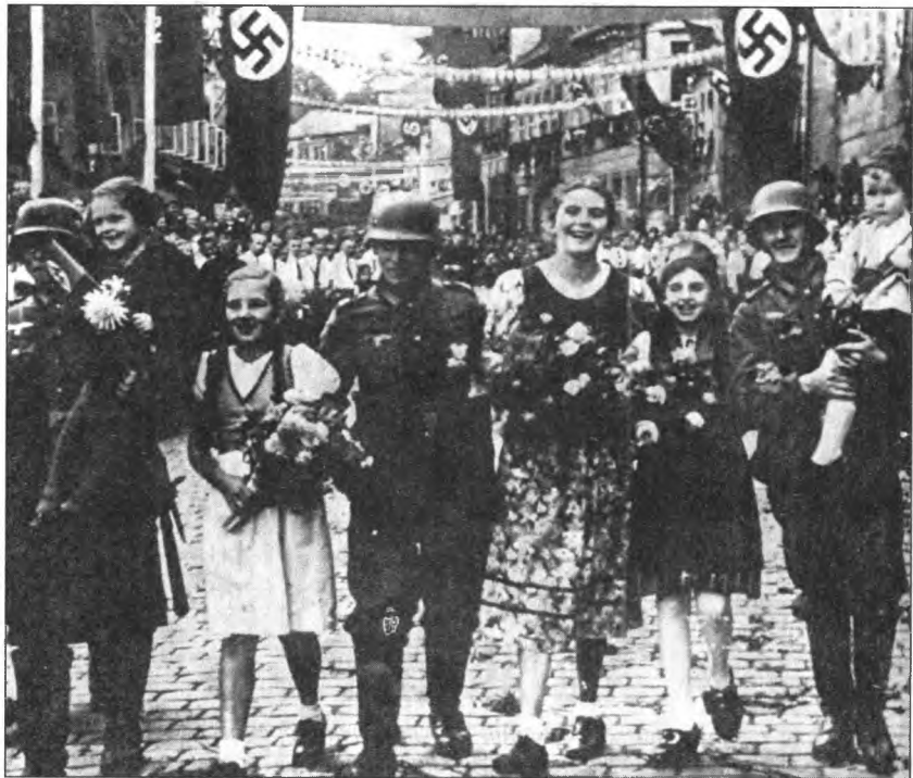
Судетские немцы приветствуют германские войска. Октябрь 1938 г.