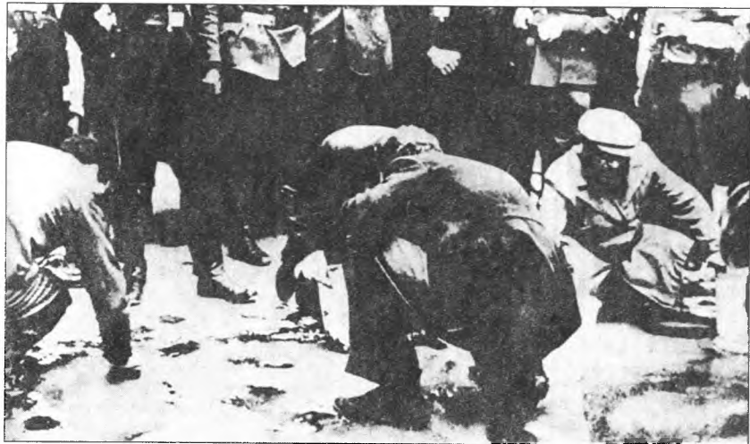
«Аншлюсс». Евреев заставляют мыть тротуары в Вене. 1938 г.