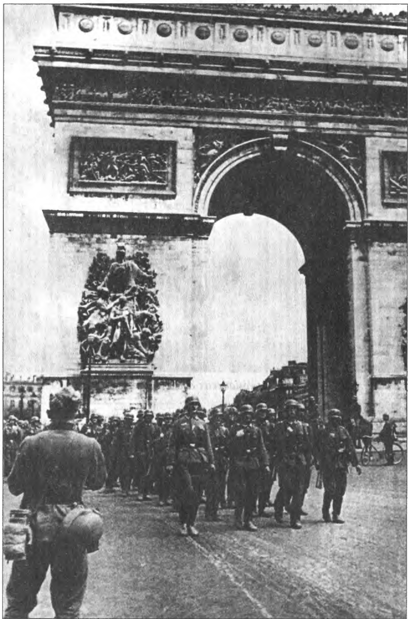
Парад войск вермахта у Триумфальной арки. Париж, 14 июня 1940 г.