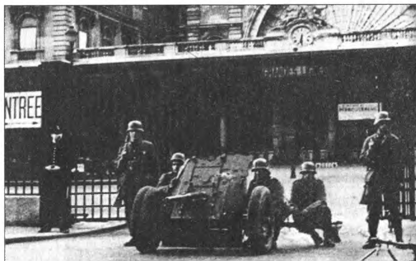
Немецкая 37-мм пушка на улицах Парижа. 14 июля 1940 г.