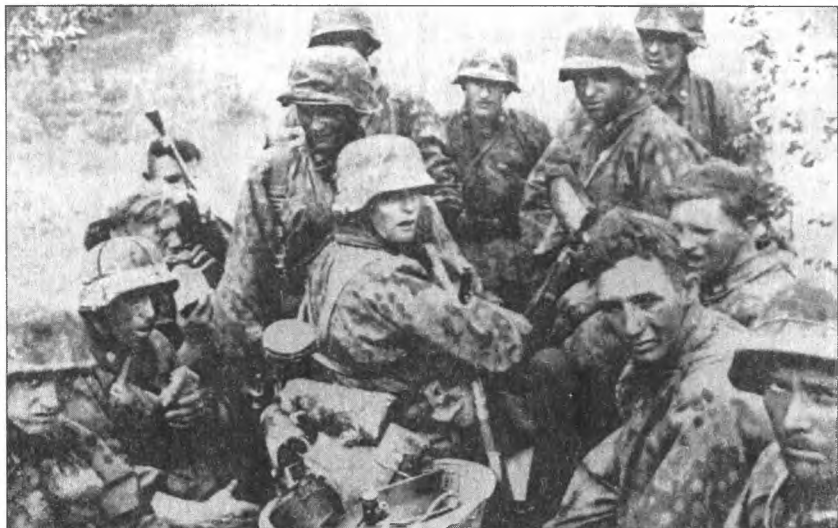
Солдаты дивизии «Дас Рейх» в районе Смоленска. Август 1941 г.