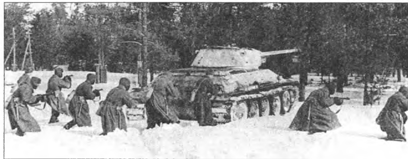
Советское контрнаступление под Москвой. Декабрь 1941 г.