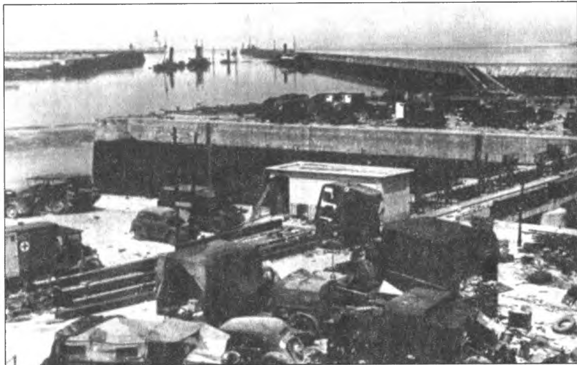
Трофейная техника и затопленные корабли в Дюнкерке. Июнь 1940 г.