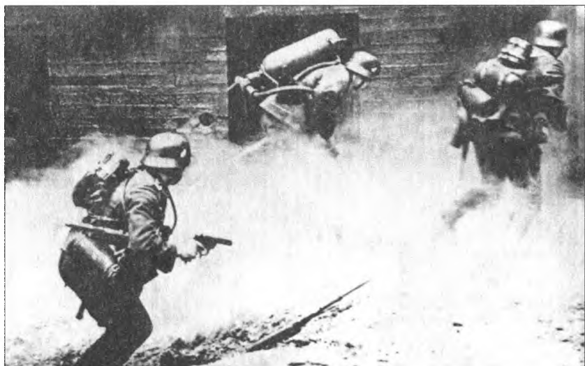
Действия вермахта на Украине. Июль 1941 г.