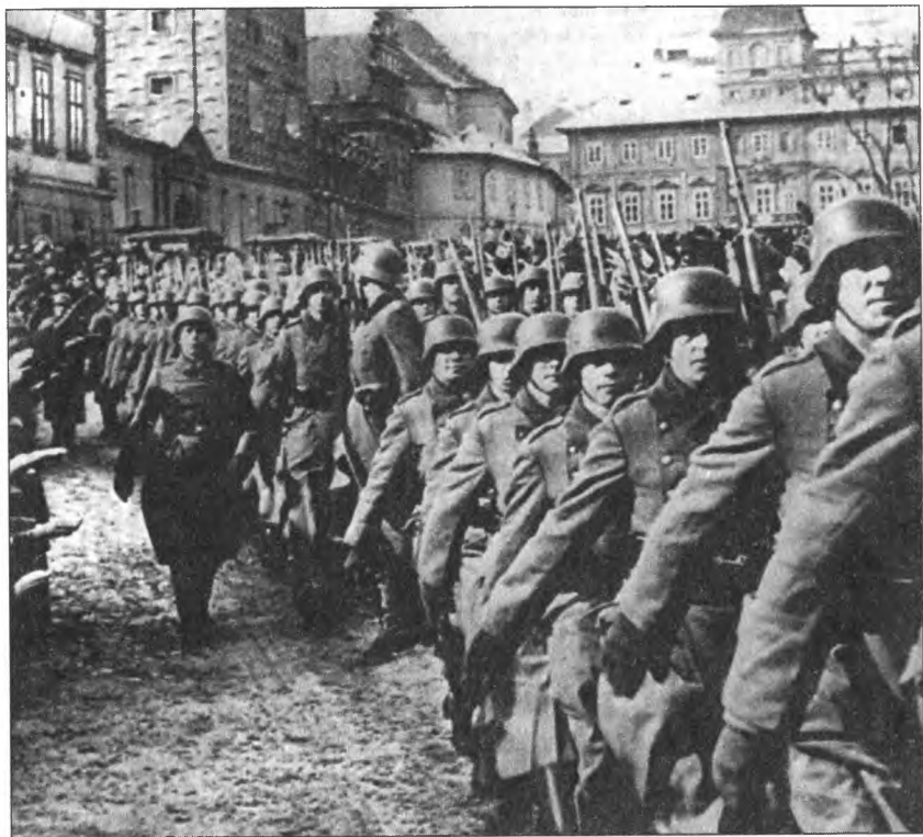
Ввод германских войск в Прагу

Так жители Праги встречали немцев. 15 марта 1940 г.