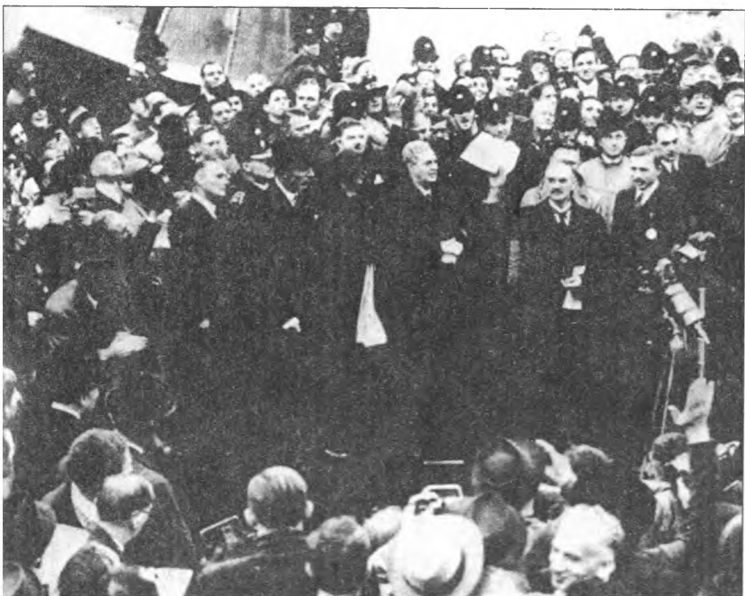
«Я привез вам мир на вечные времена!» Н. Чемберлен после Мюнхена.