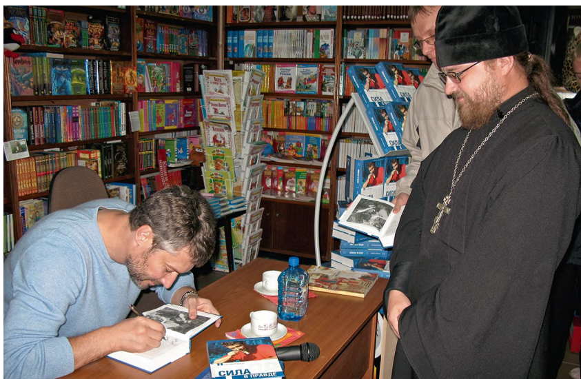
Автограф-сессия мемуарной книги Ройзмана «Сила в правде», изданной в 2007 г. Работа в Думе, деятельность фонда, музей иконы, трофи-рейды — сюда вошло все