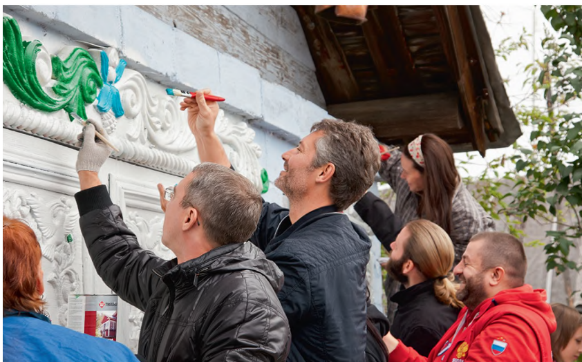
Реставрация дома кузнеца Кириллова в деревне Кунара