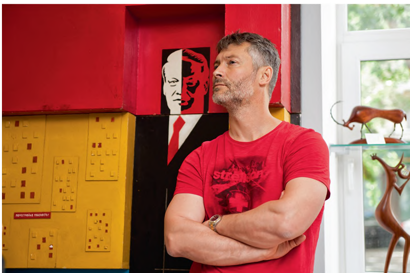
Галерея «Арт-Птица», открытие выставки «Президенты России» (2013 г.)