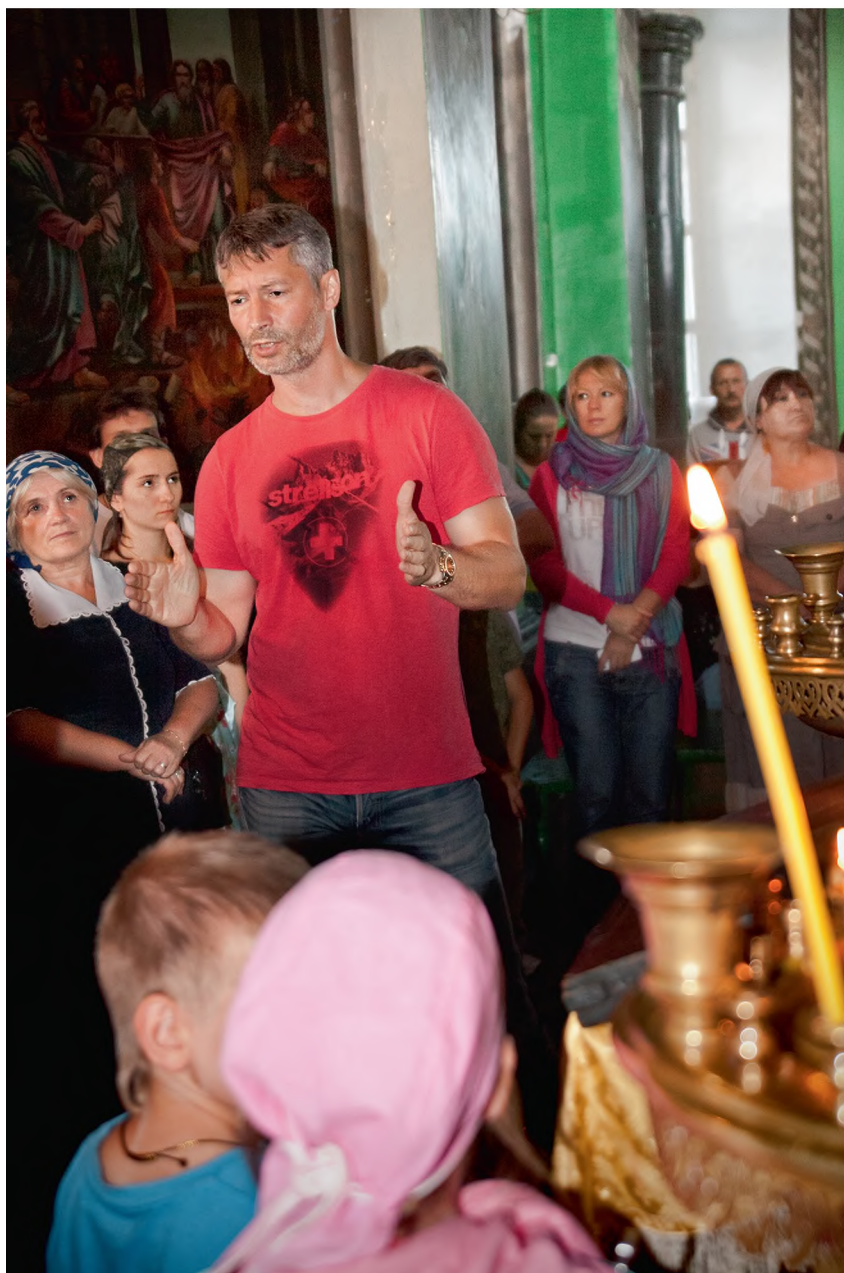
Храм в Быньгах под руководством Ройзмана был отреставрирован реабилитантами фонда «Город без наркотиков». А в 2013 г. было возбуждено уголовное дело по факту восстановления православного храма