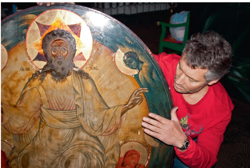
Десятки икон храма в Быньгах Ройзман восстанавливал за свой счет. В 2013 г. его обвинят в том, что он не реставрировал эти иконы, а украл