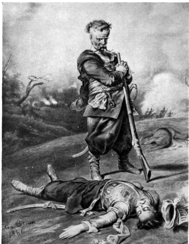
Литография П. Соколова к повести «Тарас Бульба».