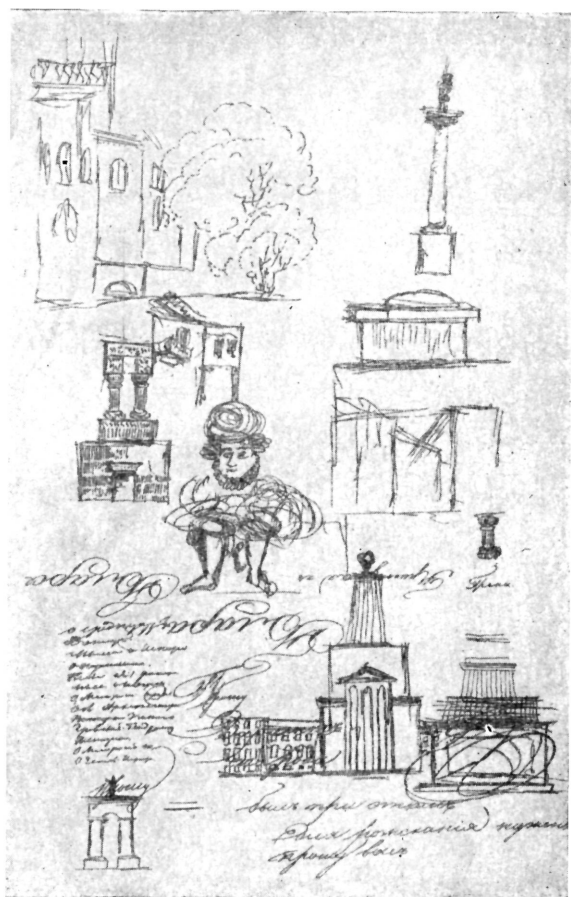
Страница из рукописи Н. В. Гоголя с его рисунками к «Арабескам».