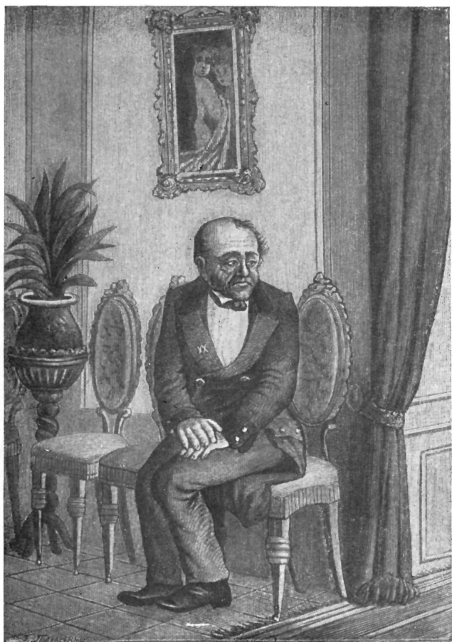
Гравюра на дереве Г. Тарасенко к повести «Шинель».