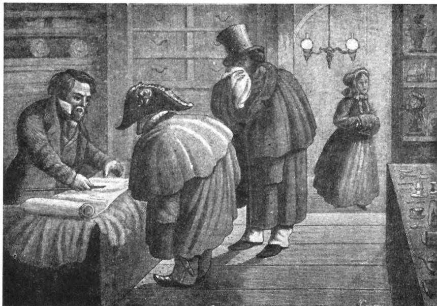
Гравюра на дереве Г. Тарасенко к повести «Нос».