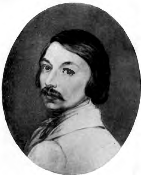
Н. В. ГОГОЛЬ Акварель И. Жерена, 1836 г.