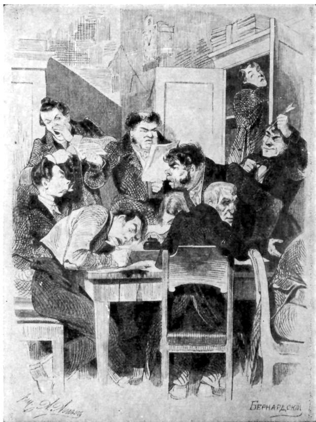
Чиновники в канцелярии присутствия. Рисунок А. А. Азина, гравюра Е. Е. Бернадского.