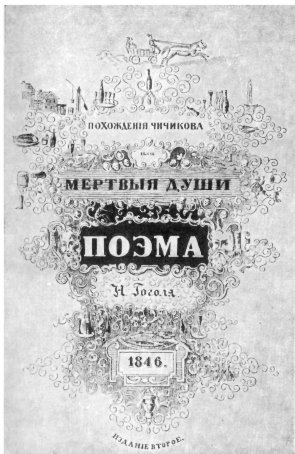
Обложка второго издания «Мертвых душ» (по рисунку Н. В. Гоголя).