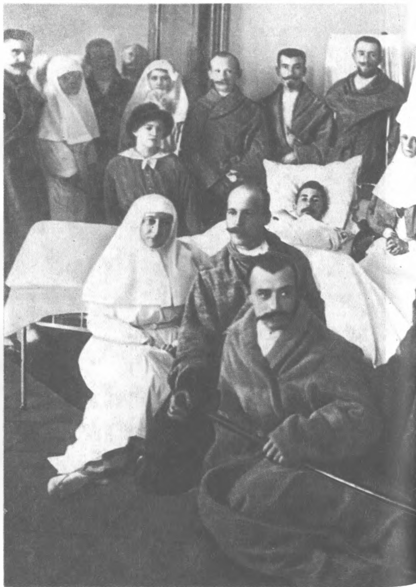
Госпиталь в Царском Селе. Императрица Александра Федоровна, наследник престола Алексей, великие княжны Мария, Ольга и Анастасия среди раненых (1916 г.)