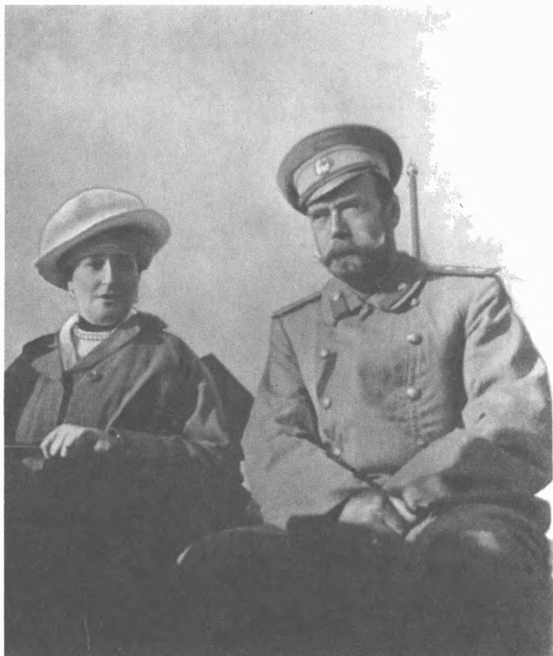
Николай II и Александра Федоровна (1916 г.)