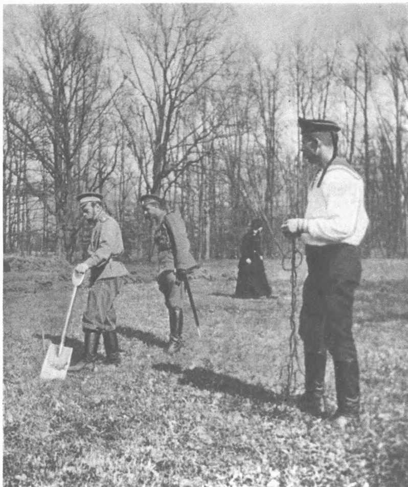
Николай II после отречения. Царское Село (май 1917 г.)