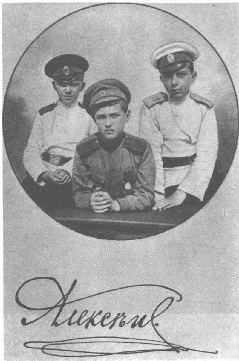
Наследник престола Алексей с друзьями-кадетами (1915 г.)