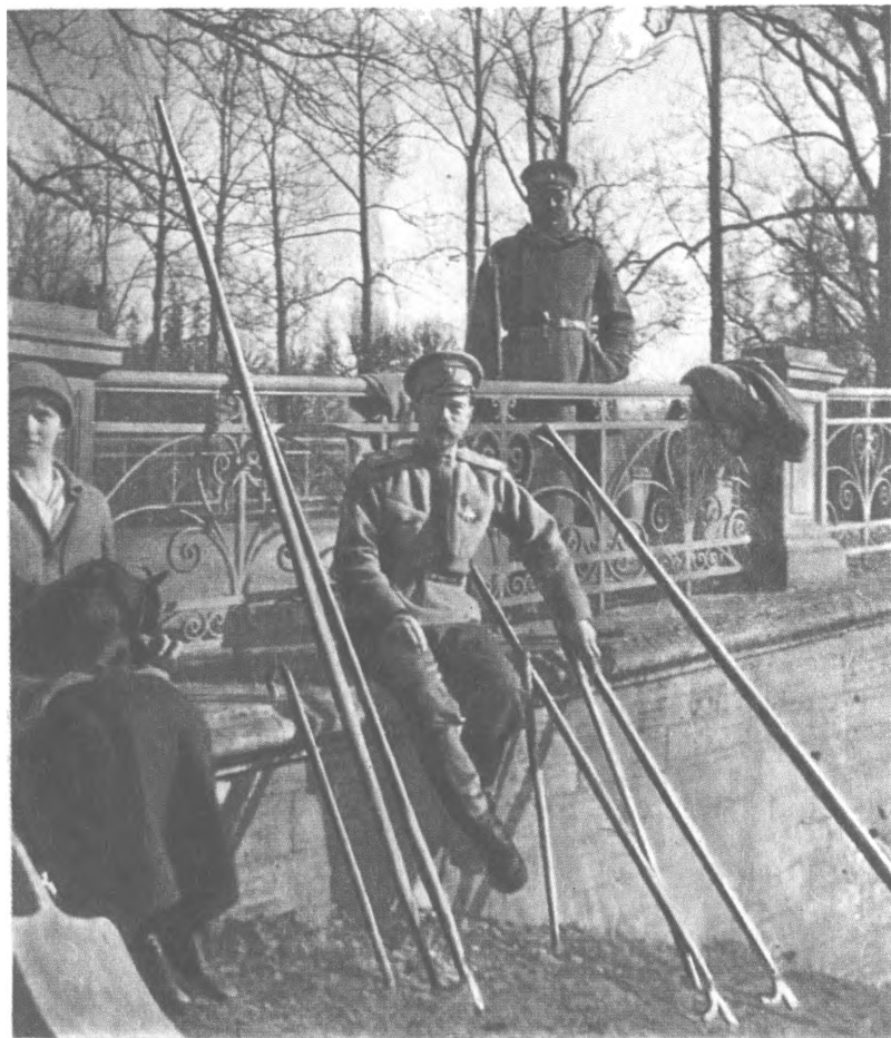
После отречения. Николай II с дочерью Татьяной (май 1917 г.)