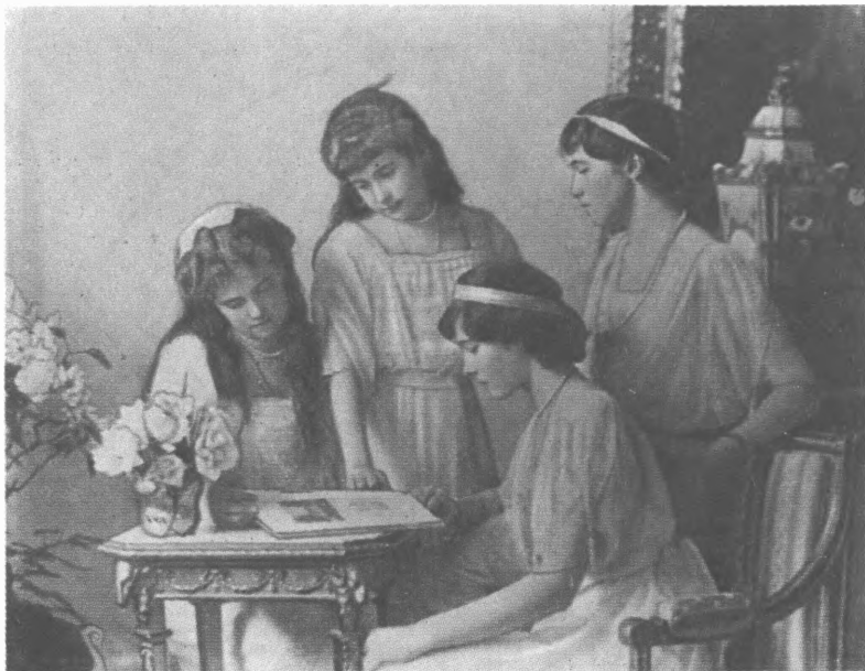
Великие княжны Мария, Ана- стасия, Ольга, Татьяна