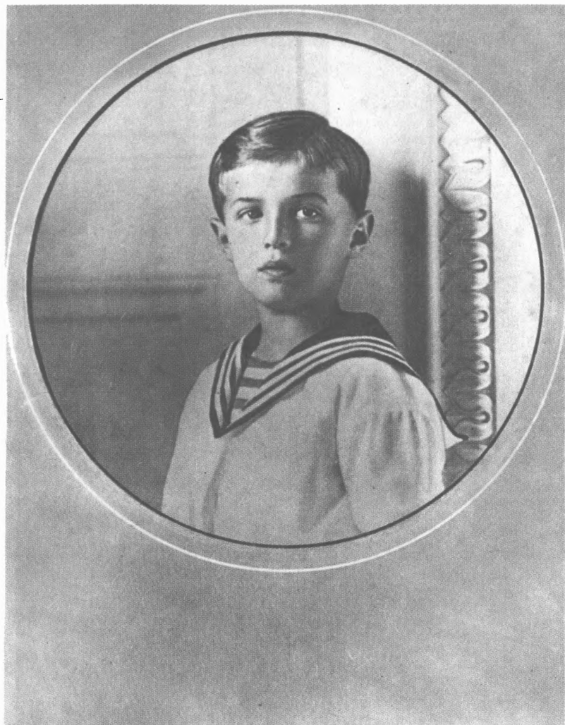
Царевич Алексей (1910 г.)