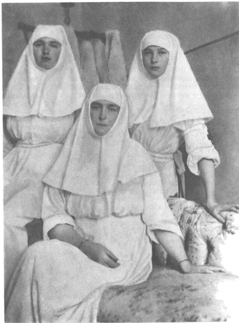
В царскосельском госпитале. Царица Александра Федоровна с дочерьми Ольгой и Татьяной (1916 г.)