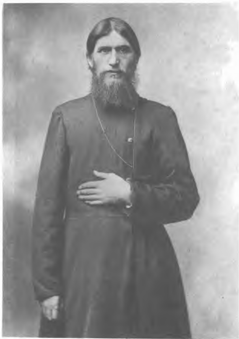
Григорий Распутин (1916 г.)