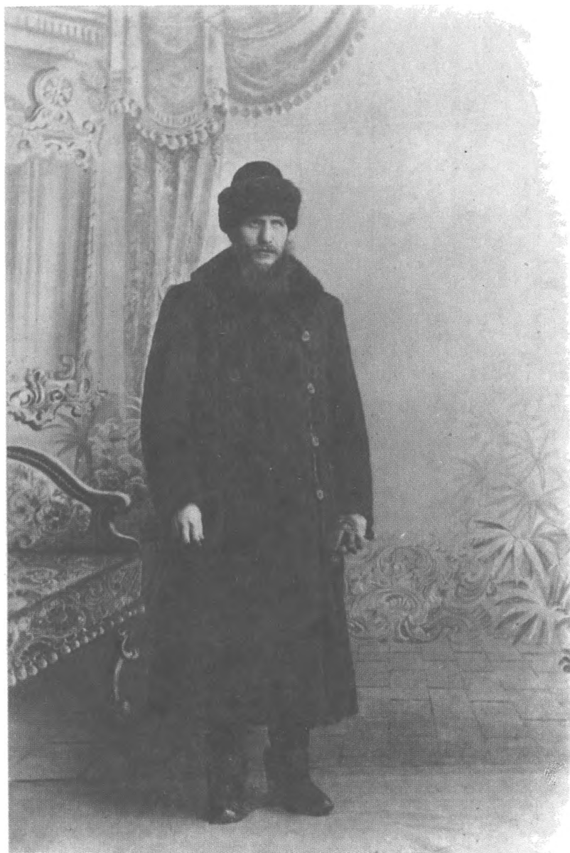
Григорий Распутин (1916 г.)