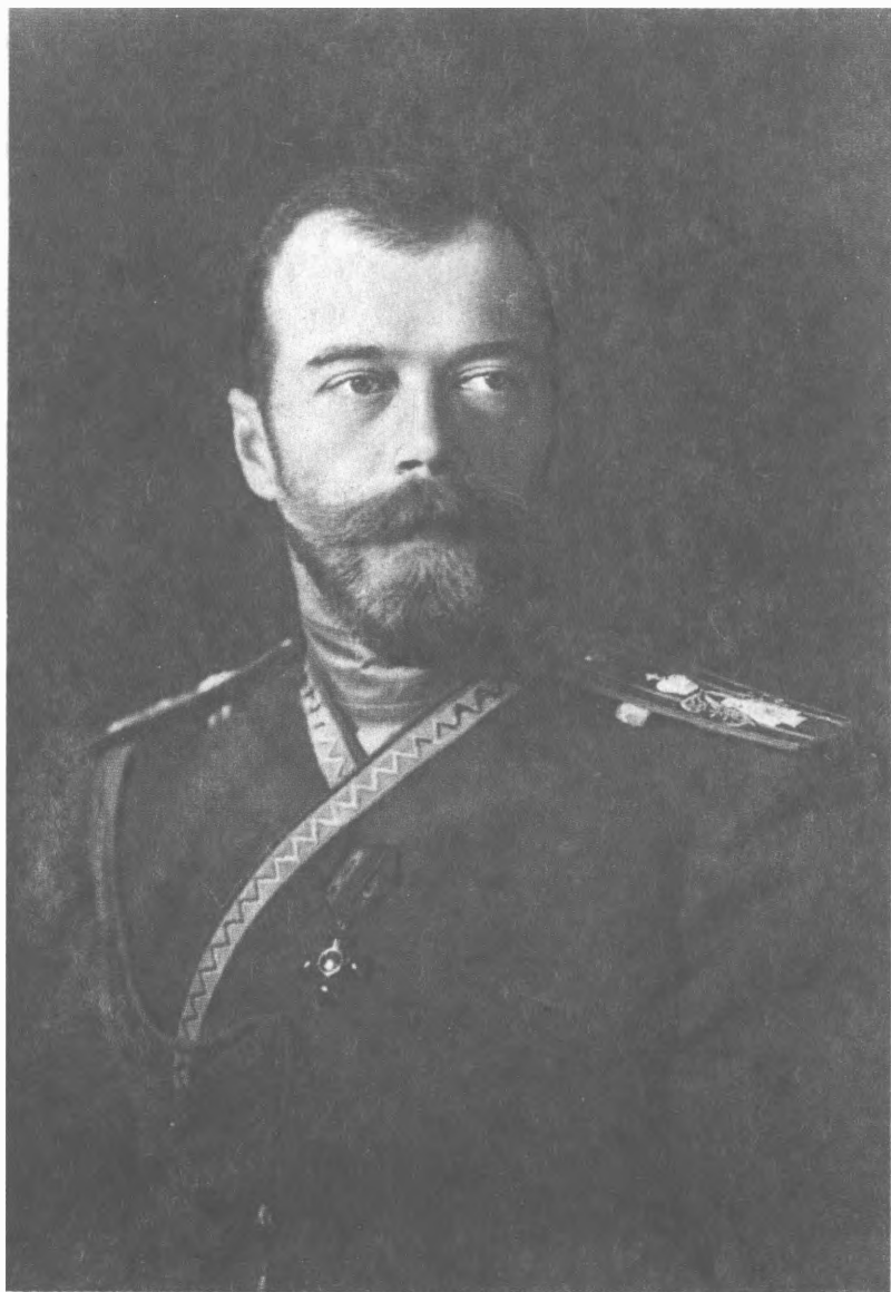
Император Николай II (1912 г.)