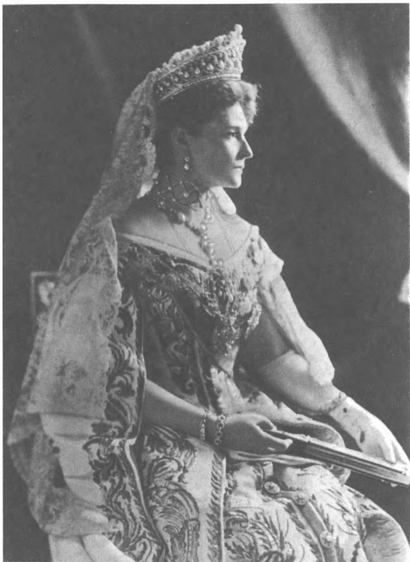
Императрица Александра Федоровна (1907 г.)