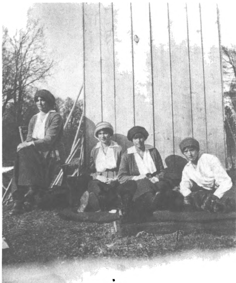
Великие княжны Мария, Ольга, Анастасия, Татьяна (май 1917 г.)