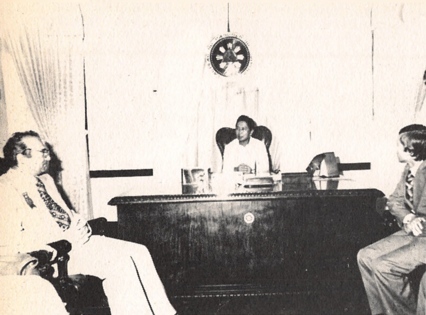
Корчной и Карпов у президента Маркоса